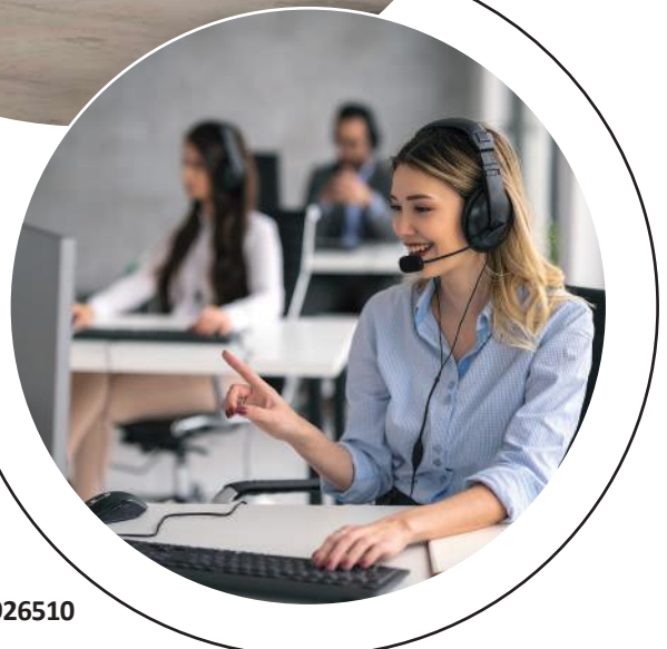
Ventas Dixilina: WhatsApp 3416926510