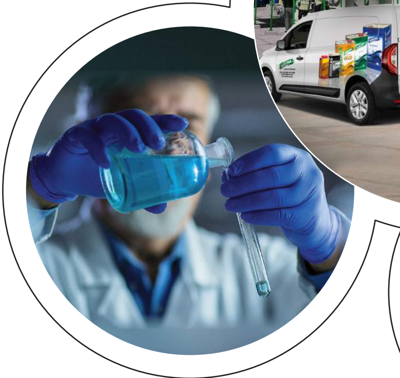
Moderno laboratorio de investigación y desarrollo

Ágil y eficiente sistema de venta y distribución