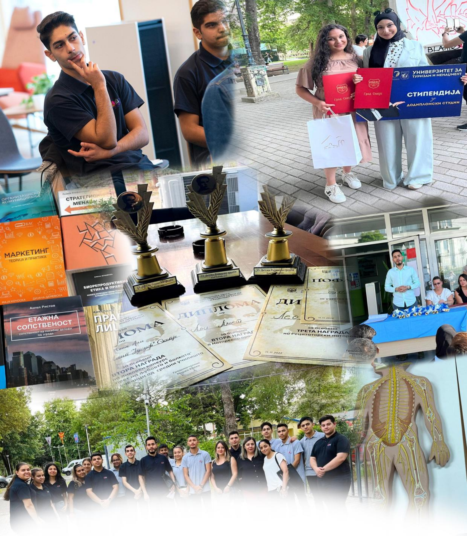
СРЕДНО УЧИЛИШТЕ НА ГРАД СКОПЈЕ „ШАИП ЈУСУФ“ – СКОПЈЕ ул. „Вашингтонска“ бр. 44, Шуто Оризари, Скопје sugsshqipjusuf.edu.mk тел. 02 2600 332