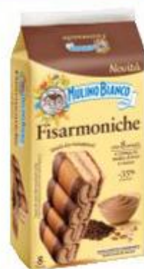
MULINO BIANCO FISARMONICHE 264 G