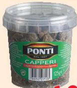
PONTI CAPPERI AL SALE 125 G