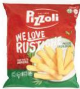
PIZZOLI WE LOVE RUSTICHE PATATE LE CASALINGHE 750 G