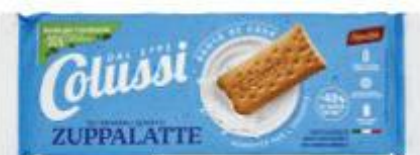
COLUSSI ZUPPALATTE 250 G