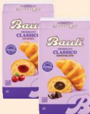
BAULI CROISSANT FARCITI ALBICOCCA/ CILIEGIA/ CIOCCOLATO/ CREMA/PISTACCHIO 5/6 PEZZI