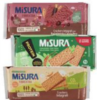
MISURA CRACKERS VARI TIPI E GRAMMATURE