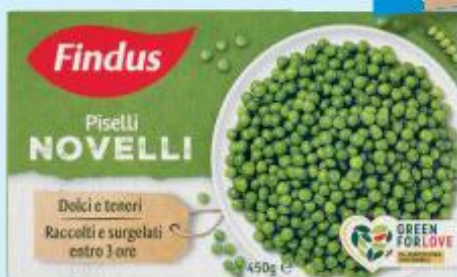
FINDUS PISELLI NOVELLI 450 G