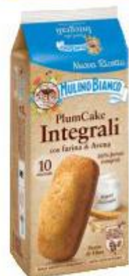
MULINO BIANCO PLUMCAKE INTEGRALI 10 PEZZI