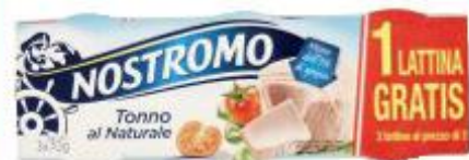
NOSTROMO TONNO AL NATURALE 70 G X 3