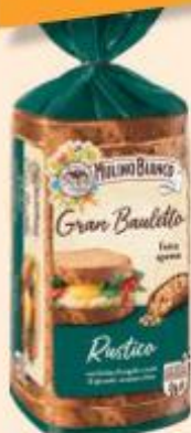
MULINO BIANCO GRAN BAULETTO RUSTICO 500 G