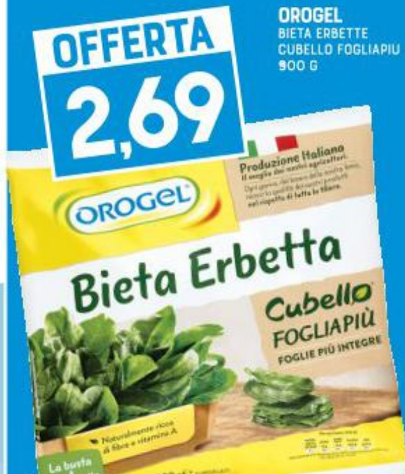
OROGEL BIETA ERBETTE CUBELLO FOGLIAPIÙ 900 G