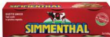
SIMMENTHAL CARNE MAGRA IN GELATINA 140 G X 3