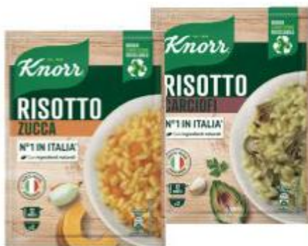
KNORR RISOTTO VARI GUSTI 175 G