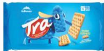
GALBUSERA TRA 250 G