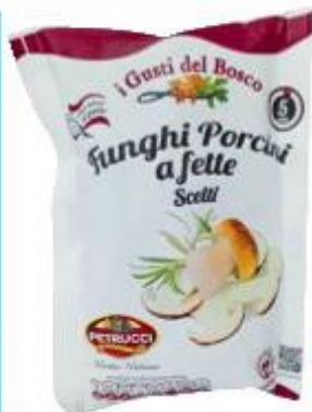
PETRUCCI PORCINI A FETTE 100 G