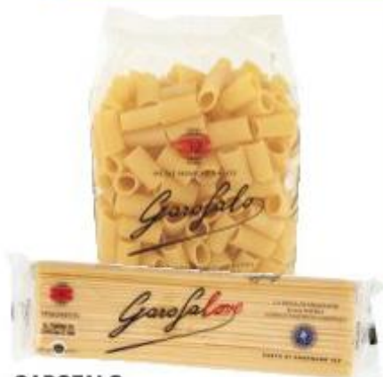
GAROFALO PASTA DI SEMOLA VARIE TRAFILE 500 G