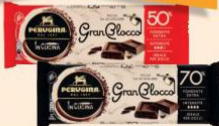
PERUGINA GRAN BLOCCO DI CIOCCOLATO LATTE 30%/ FONDATE 50% - 70% 150 G