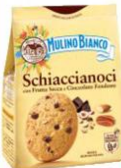
MULINO BIANCO SCHIACCIANOCI 300 G