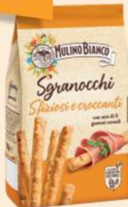
MULINO BIANCO SGRANOCCHI GRISSINI 210 G