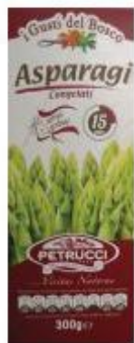
PETRUCCI ASPARAGI 300 G