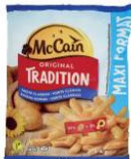
MC CAIN PATATINE TRADIZIONALI 2,5 KG