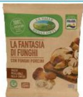
LA VALLE DEGLI ORTI FANTASIA DI FUNGHI 300 G