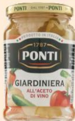
PONTI GIARDINIERA ALL'ACETO VASO - 300 G