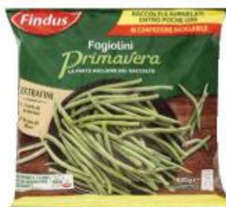
FINDUS FAGIOLINI PRIMAVERA 600 G