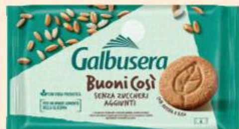
GALBUSERA BUONI COSÌ CLASSICI/CEREALI/ CON LATTE 330/300 G