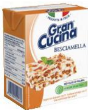
GRAN CUCINA BESCIAMELLA 200 ML