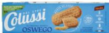
COLUSSI OSWEGO 250 G