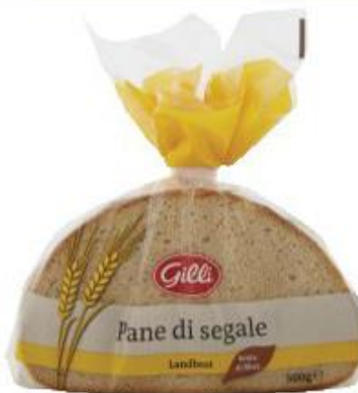
GILLI PANE SEGALE 500 G