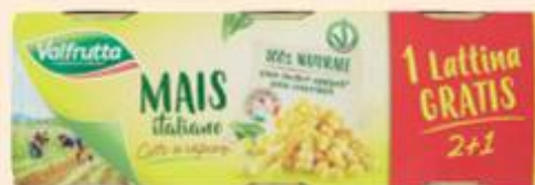
VALFRUTTA MAIS ITALIANO COTTO A VAPORE 326 G X 2 - 1 LATTINA GRATIS