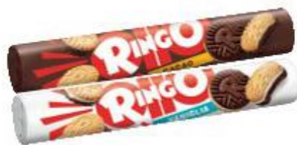
PAVESI RINGO CACAO/VANIGLIA TUBO - 165 G