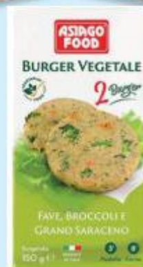
ASIAGO FOOD BURGER VEGETALE FAVE - BROCCOLI - GRANO SARACENO/ KALE E QUINOA/ POMODORO E MALZANZANE 150 G