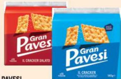
PAVESI GRAN PAVESI CRACKER SALATI/NON SALATI 560 G