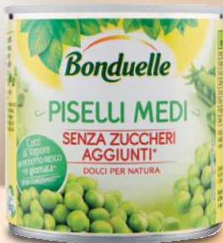
BONDUELLE PISELLI MEDI COTTI A VAPORE 305 G