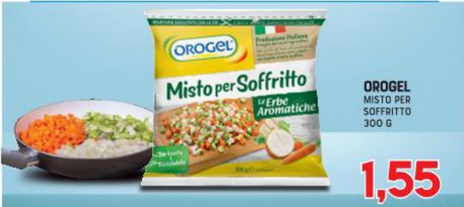
OROGEL MISTO PER SOFFRITTO 300 G