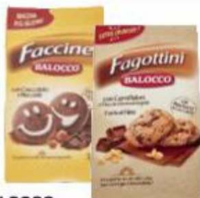
BALOCCO BISCOTTI VARI TIPI 350 G