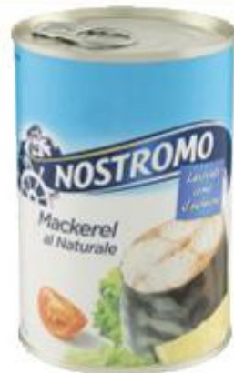
NOSTROMO MACKEREL AL NATURALE 425 G