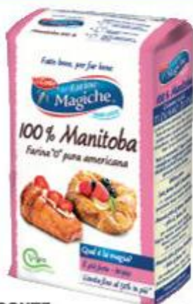
LO CONTE LE FARINE MAGICHE FARINA 100% MANITOBA 1 KG