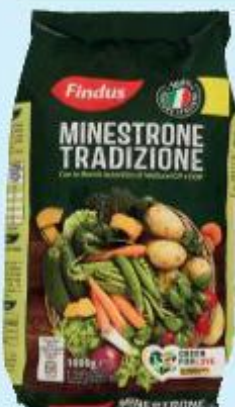
FINDUS MINISTRONE TRADIZIONE IGP E DOP 1 KG