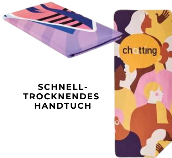
SCHNELL- TROCKNENDES HANDTUCH