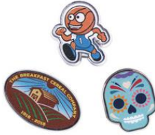
EISEN FULL COLOR DRUCK