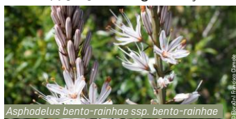
Asphodelus bentorainhae ssp. bento-rainhae

Relativamente à flora, podem ser observados remanescentes florestais na vertente norte, alguns castinçais ( Castanea sativa ) e carvalhais de carvalho-alvarinho ( Quercus robur ) e de carvalho-negral ( Quercus pyrenaica ). Associada a estes povoamentos, encontra-se a abrótea-da-gardunha ( Asphodelus bentorainhae ssp. bento-rainhae ), uma espécie endêmica e prioritária com distribuição restrita à Serra da Gardunha. No que diz respeito à fauna, estão associados ao curso de água espécies como a lontra ( Lutra lutra ) e endemismos ibéricos como o lagarto-de-água ( Lacerta schreiberi ), a salamandra-lusitânica ( Chioglossa lusitanica ) e o bordalo ( Squalius alburnoides ). É ainda comum a ocorrência de insetos, nomeadamente lepidópteros (p. ex. Euphydryas aurinia ), da fuinha ( Martes foina ) e de aves protegidas como o tartaranhão-caçador ( Circus pygargus ) e a águia-calçada ( Hieraetus pennatus ).