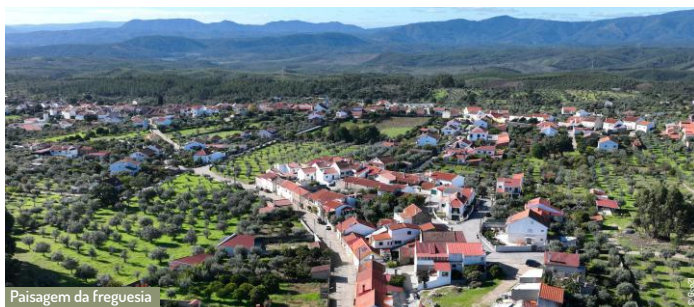
Paisagem da freguesia

É uma freguesia com 42,97 km 2 de área e 621 habitantes (Censos 2021), privilegiada em património natural. A Serra da Gardunha está integrada na Rede Natura 2000 e no Geopark Naturtejo e, apesar da reduzida área geográfica, é muito rica em biodiversidade e recursos naturais. A nível geológico, é dominada por granito e xisto, sendo a presença de água outra constante. A heterogeneidade paisagística (mosaico agrícola e florestal) é resultado da forte intervenção antropogénica.