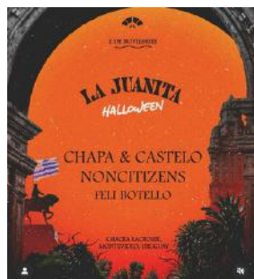
02.11 La Juanita // desde $900