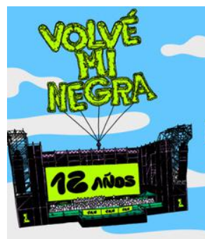
05.10 Vuelve mi Negra fiesta 12 años // Lote 3 $1950