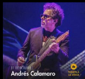
Andrés Calamaro // 31.10 Sala del Museo