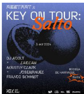
5.10 Key en SALTO // desde $950