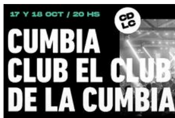
17/18.10 El Club de la Cumbia