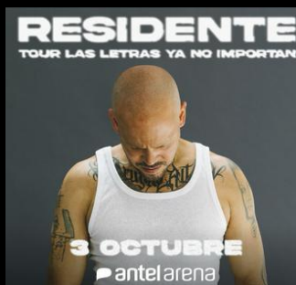
Residente // 03.10 Antel Arena