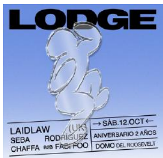
12.10 LODGE // desde $650