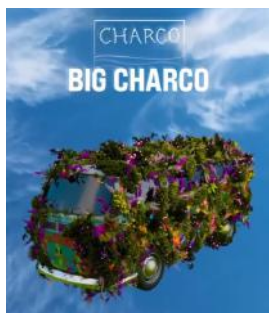
04.10 Big Charco // desde $690