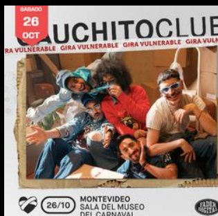
Gauchito Club // 26.10 Sala del Museo