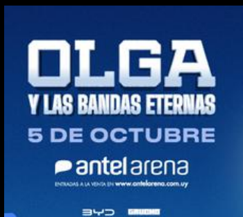
Olga y las bandas eternas // 05.10 Antel Arena