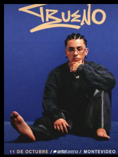
Trueno // 11.10