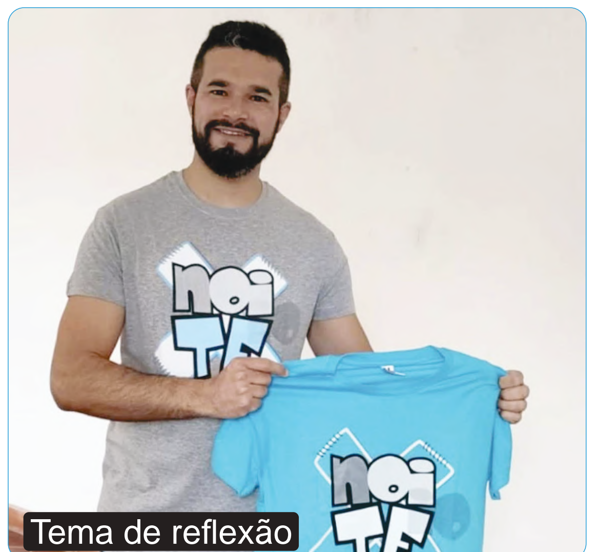
Tema de reflexão