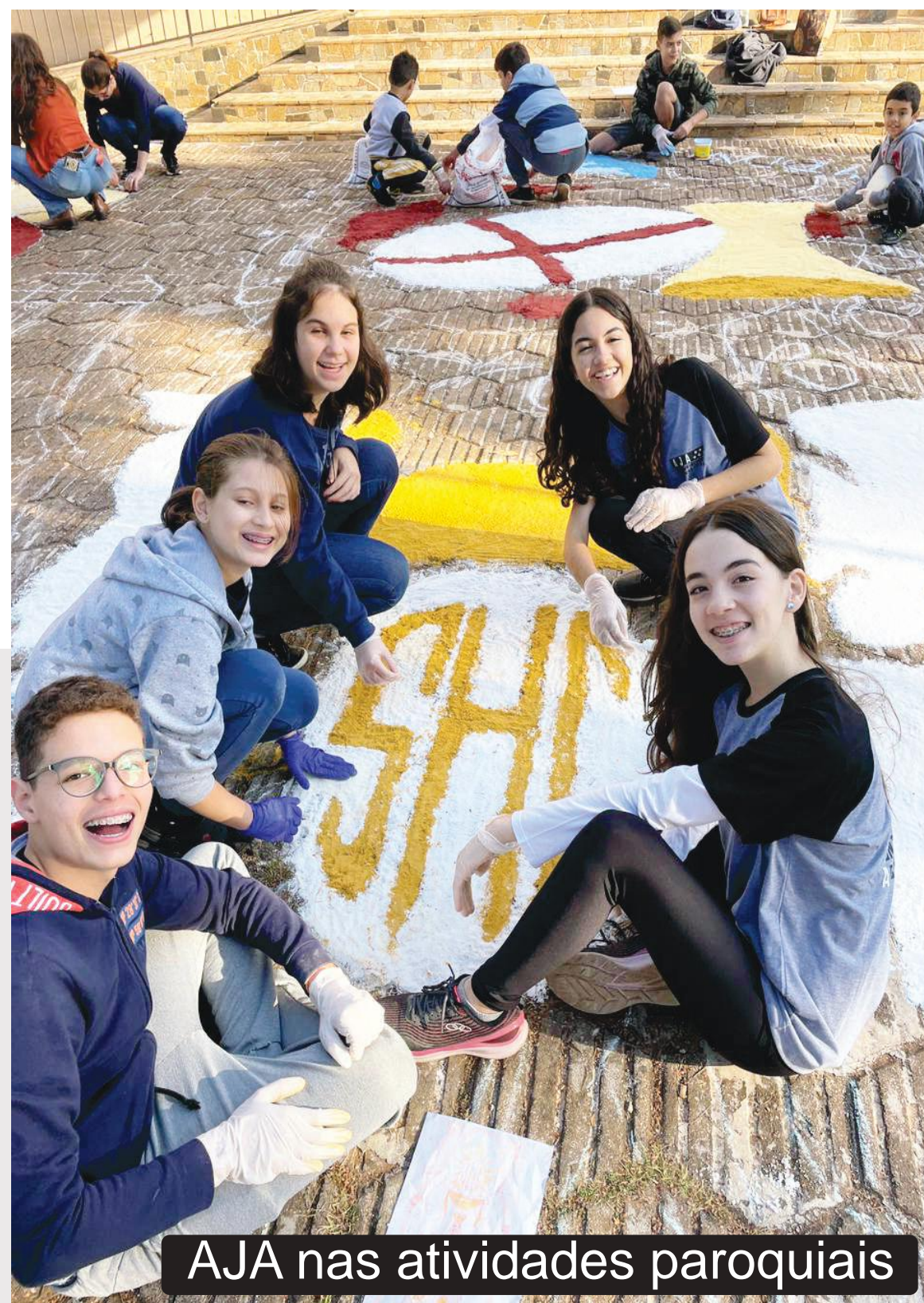
AJA nas atividades paroquiais

O AJA é um grupo de adolescentes e jovens de inspiração agostiniana fundado sobre a rocha e que perdura por mais de 10 anos junto à Paróquia Santo Antônio na cidade de Ourinhos (SP).