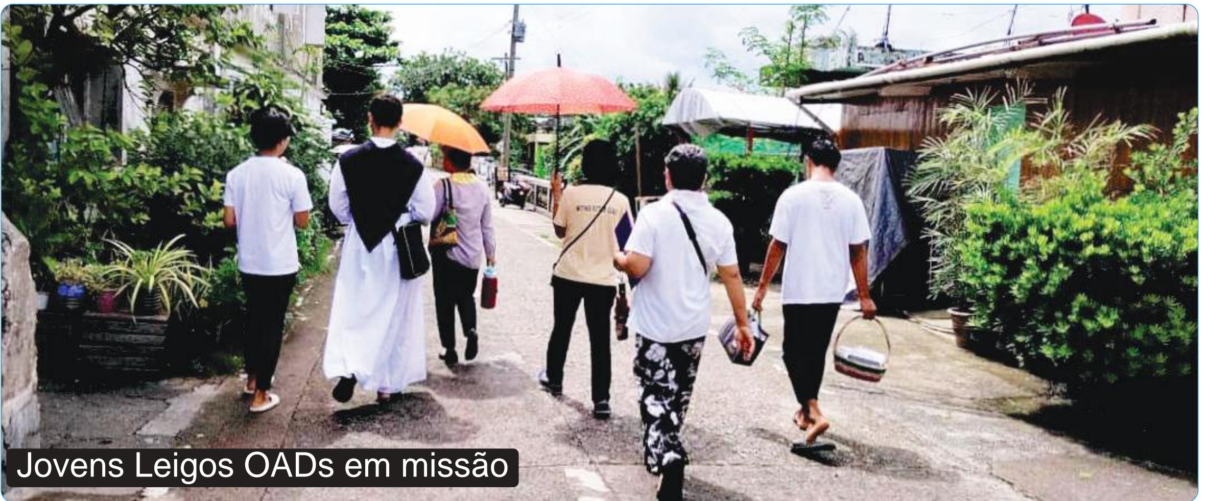
Jovens Leigos OADs em missão