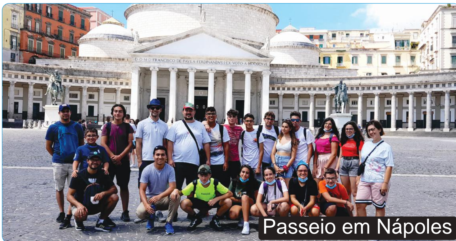
Passeio em Nápoles

Com o grupo, vivenciamos várias experiências, incluindo retiros espirituais, passeios em diferentes lugares na Itália, apresentações teatrais, atividades com crianças e encontros periódicos.