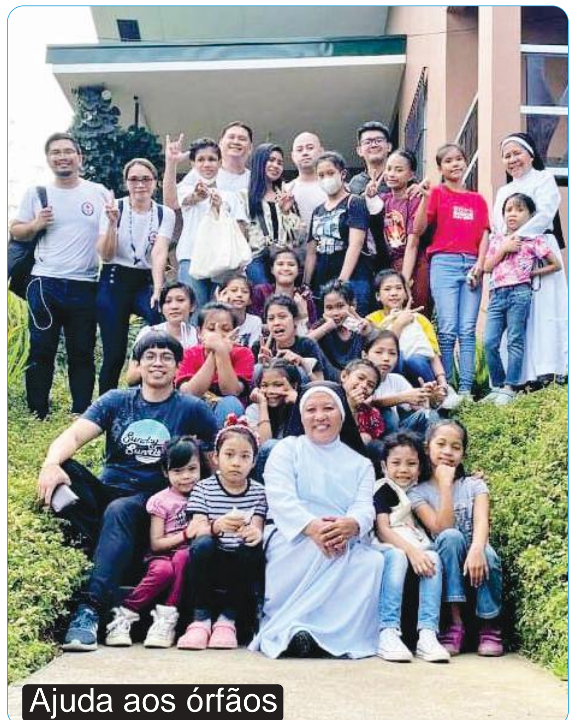
Ajuda aos órfãos