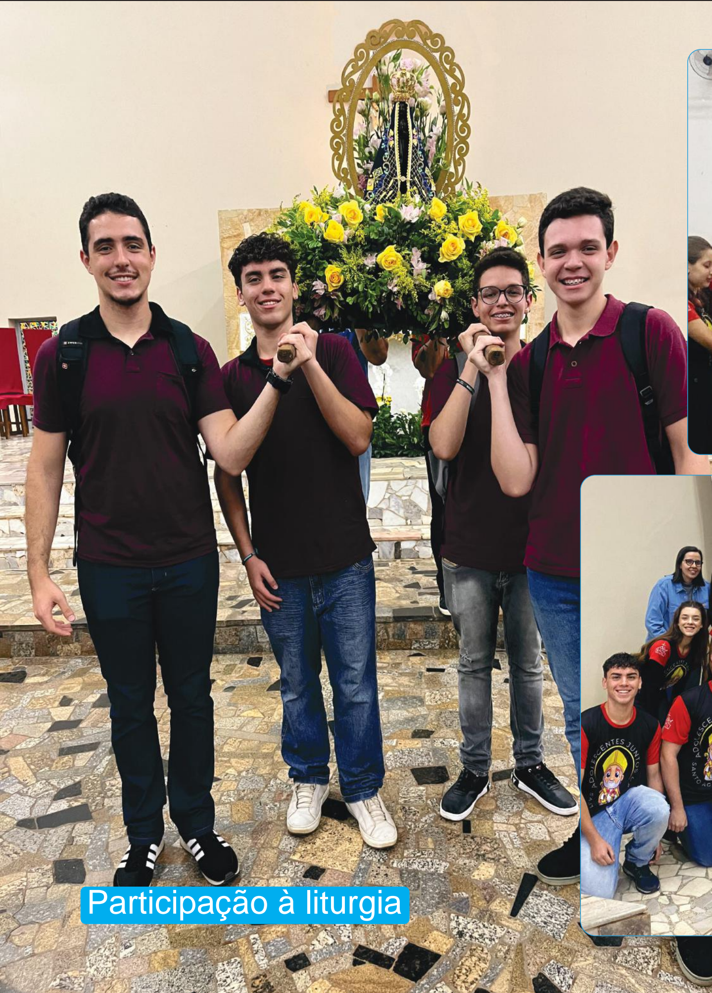
Participação à liturgia