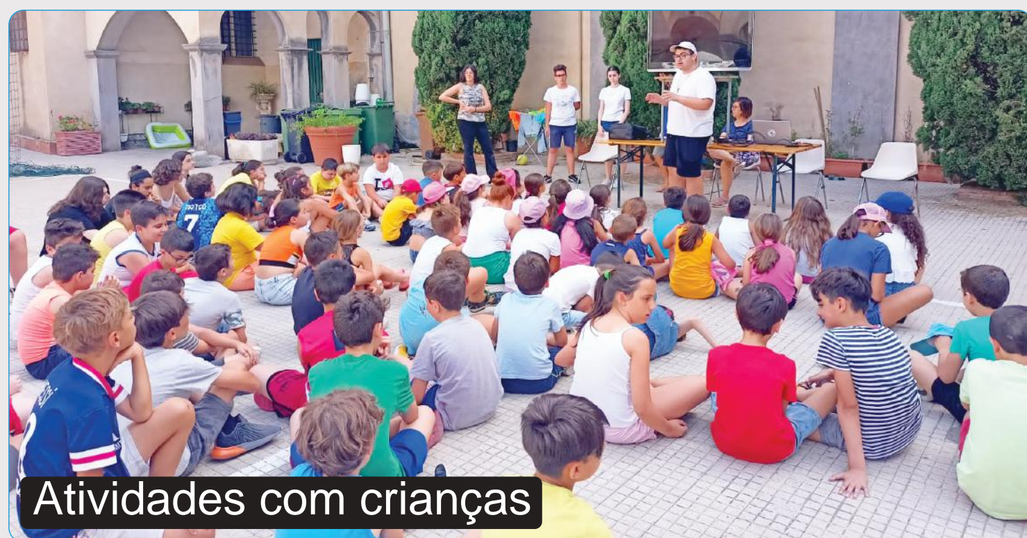
Atividades com crianças

Estou convencido de que esse sentimento de insatisfação dos jovens, sua recusa em se contentar facilmente, o desejo de conhecer coisas novas e fazer muitas