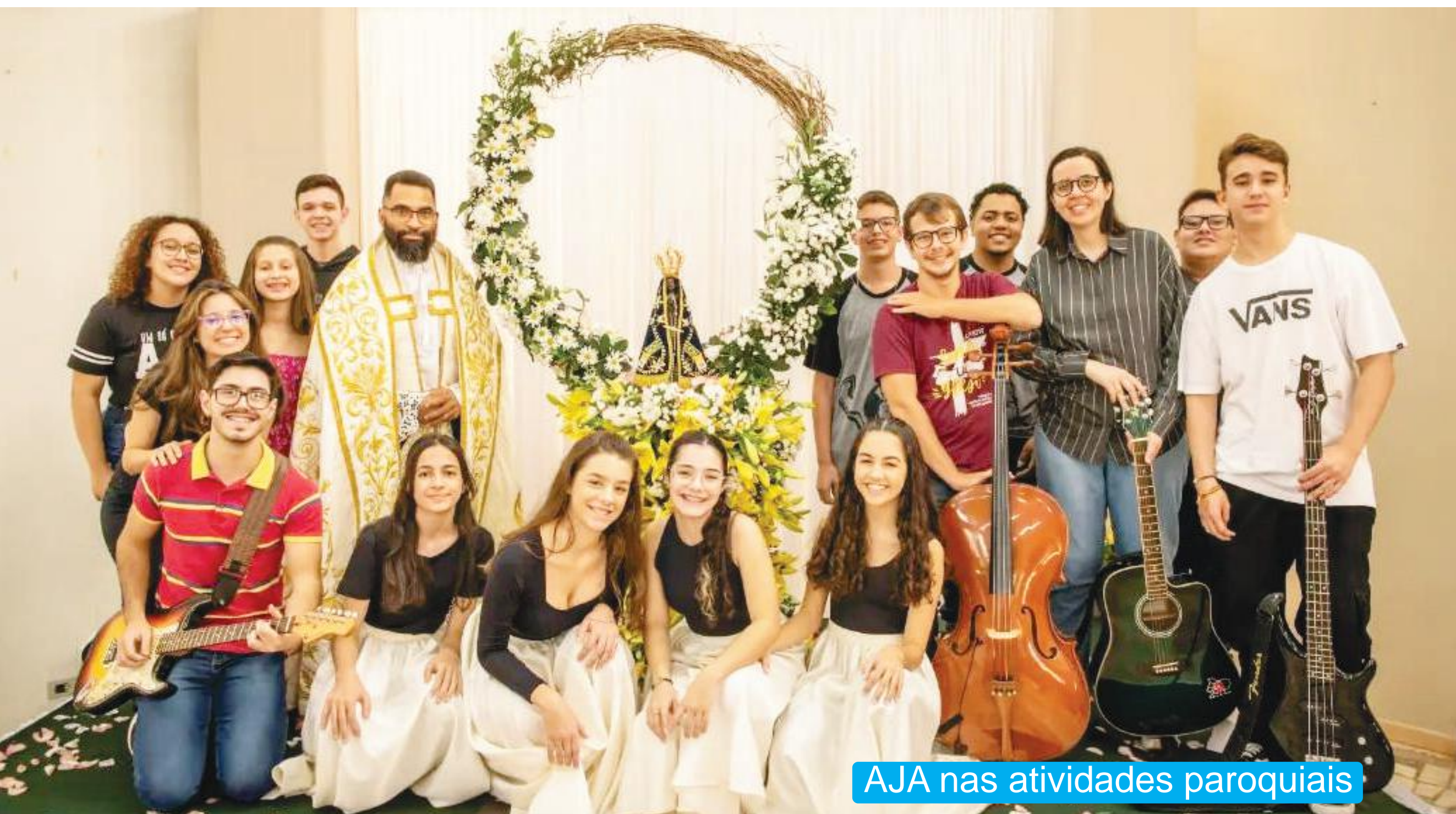
AJA nas atividades paroquiais