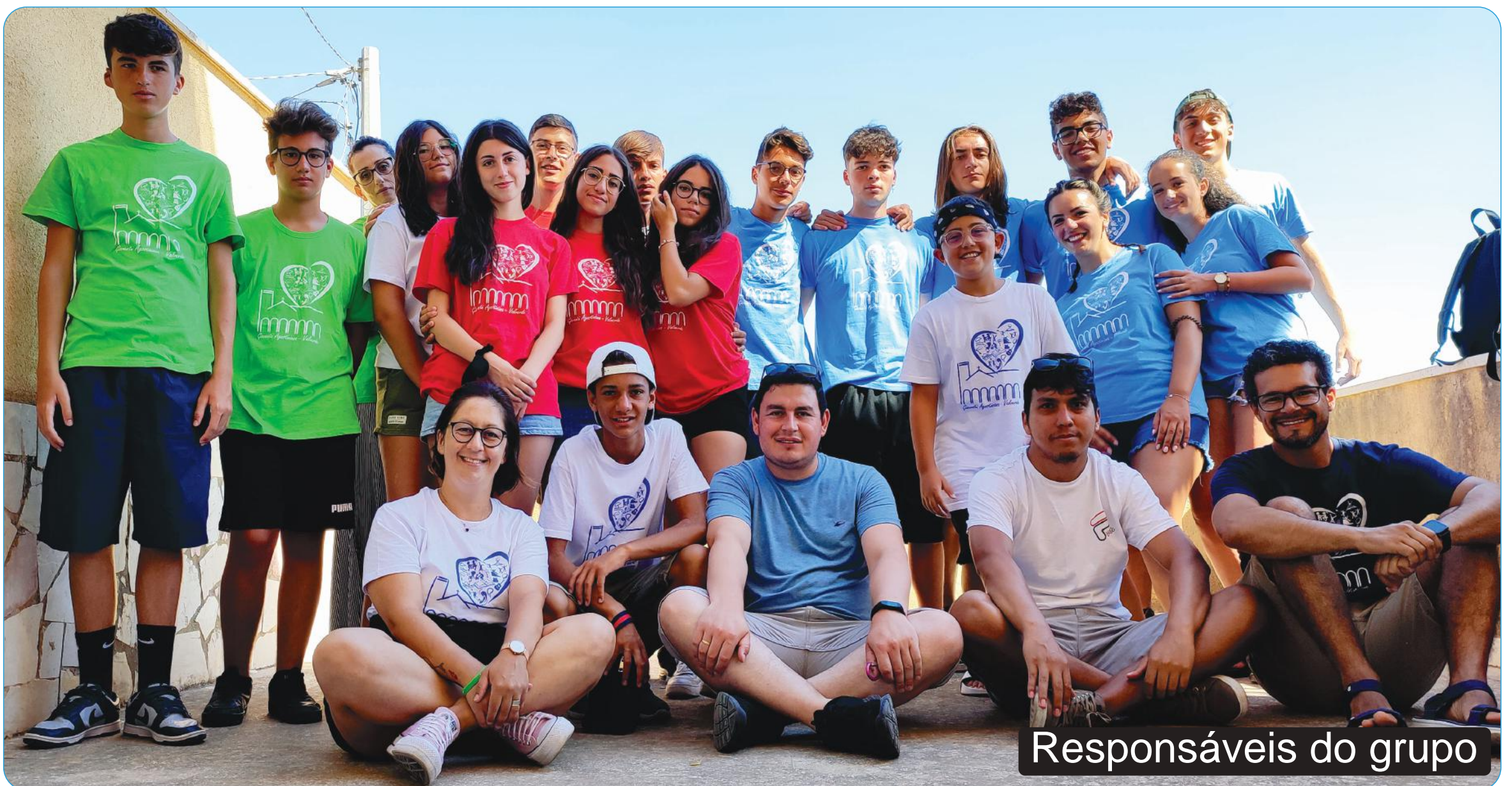
Responsáveis do grupo