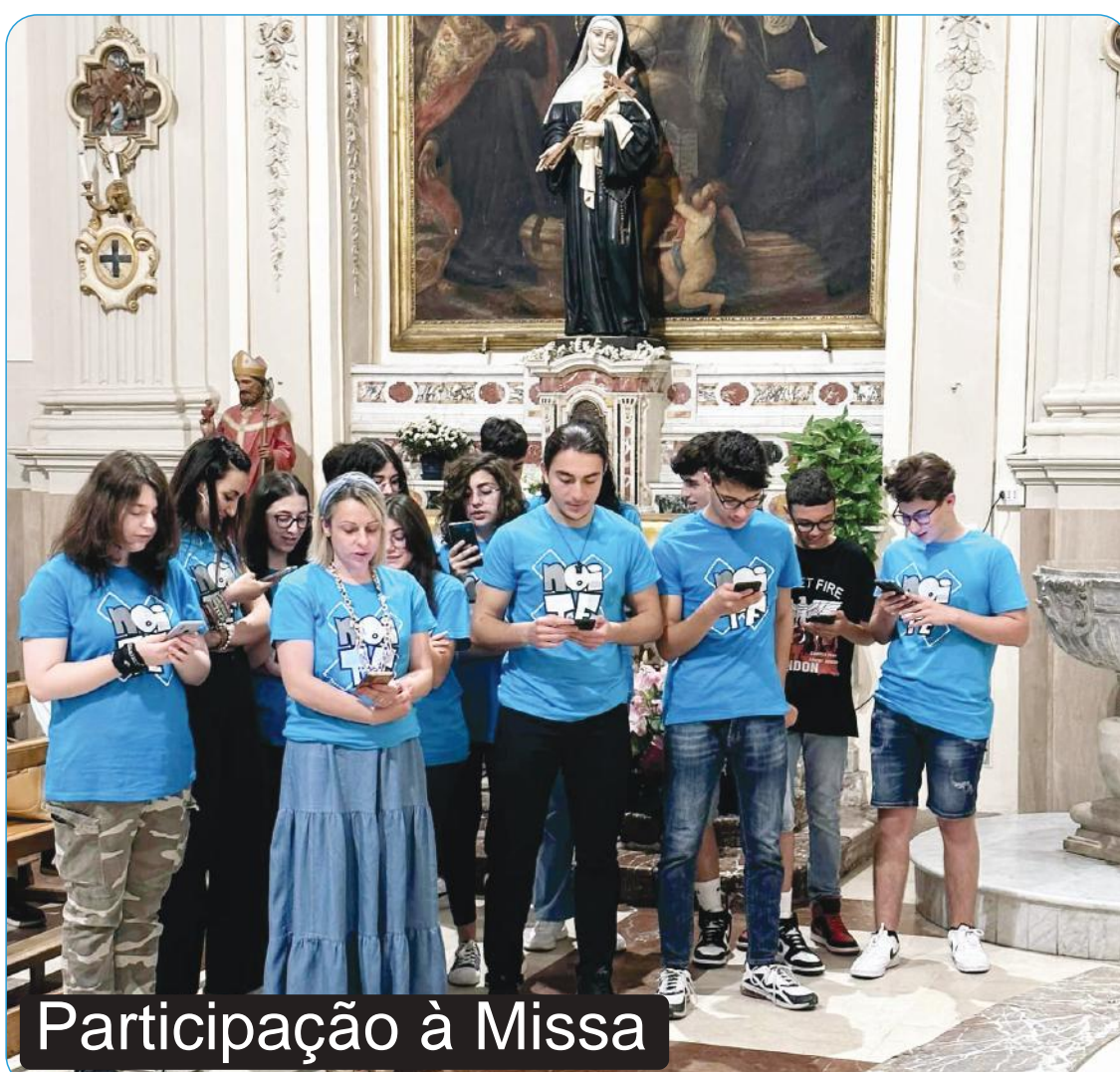
Participação à Missa