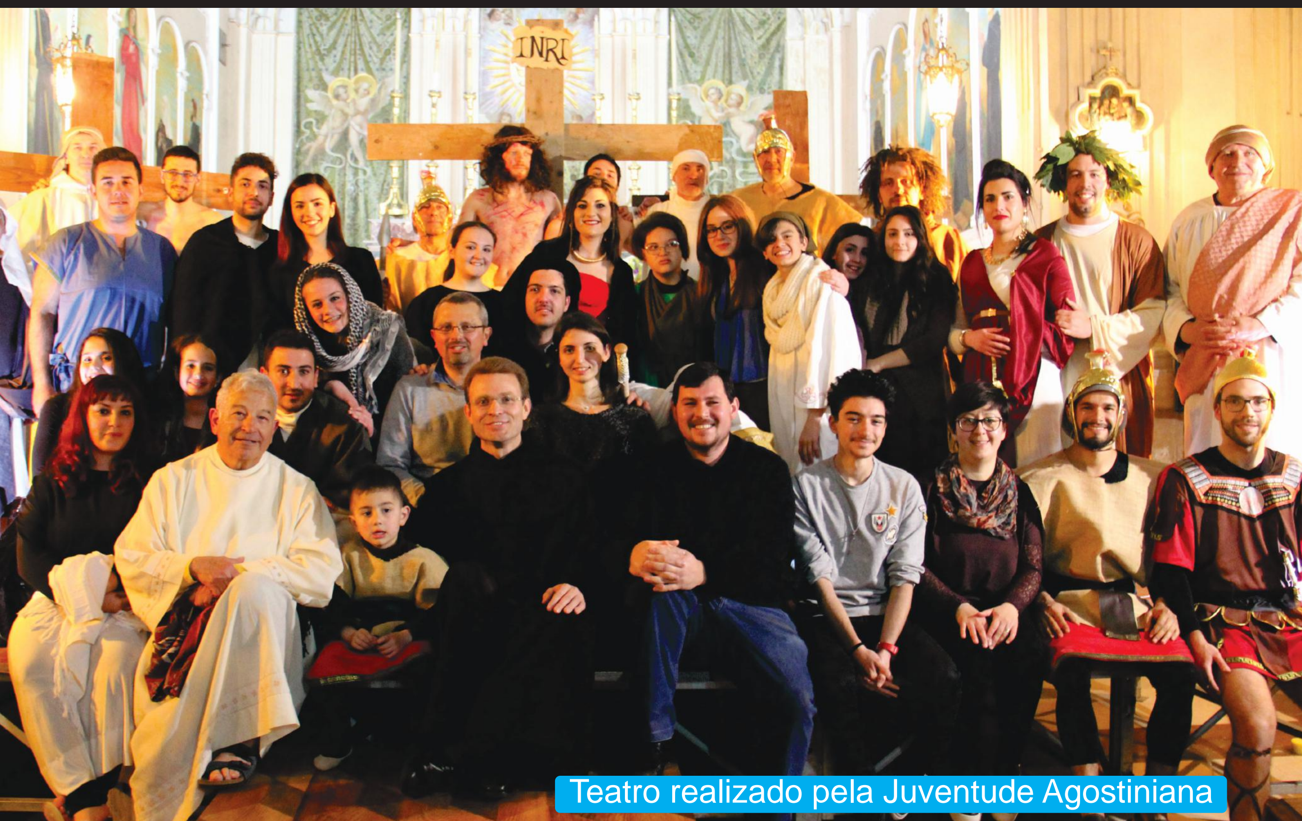
Teatro realizado pela Juventude Agostiniana

A juventude necessita de orientação, acolhimento e compreensão; geralmente os jovens representam uma parte da Igreja que se sente negligenciada, levando muitos deles a se afastarem. Até Santo Agostinho, quando jovem, como todos da sua idade, sentia em seu coração uma inquietação profunda que o impelia a buscar a verdade. A juventude tem sede de verdade e autenticidade.