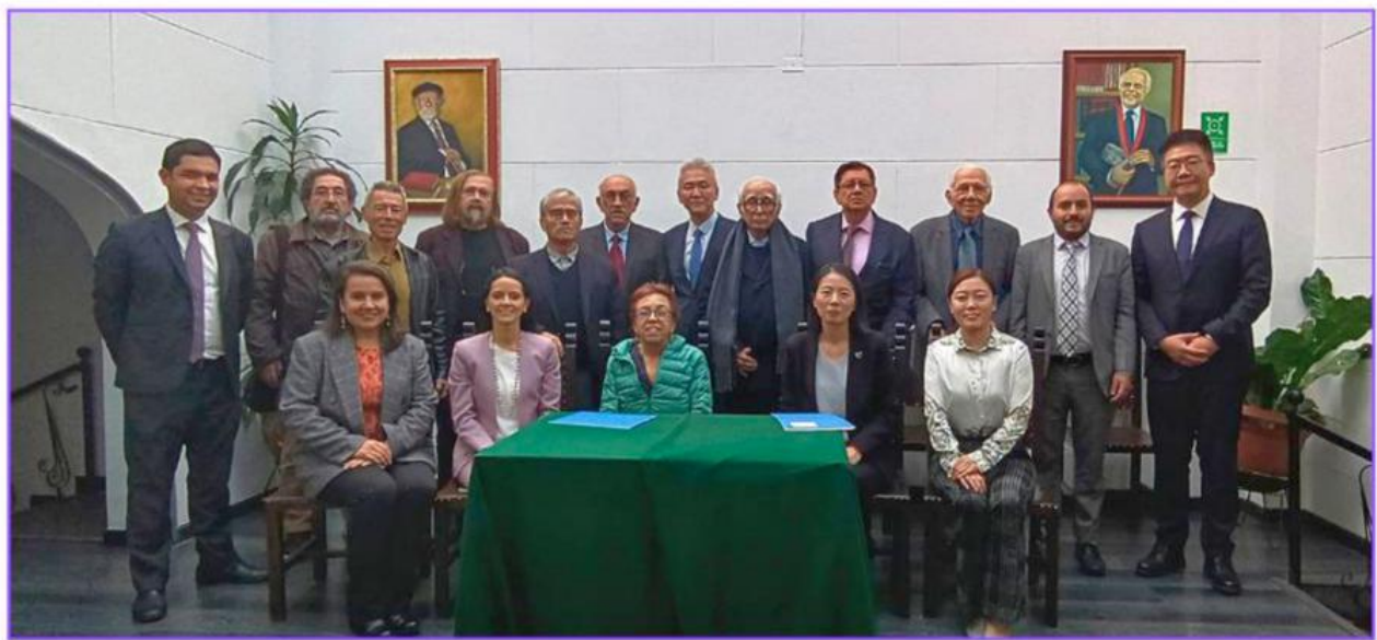
Día 1, jueves 30 de noviembre. Barrio La Soledad, Bogotá, Colombia.