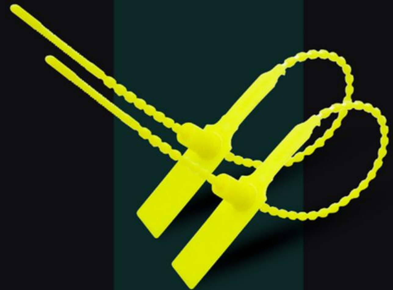
NIÊM PHONG ĐỐT TRÚC LỚN HIGH SECURITY PLASTIC CABLE SEAL ( NDTL )