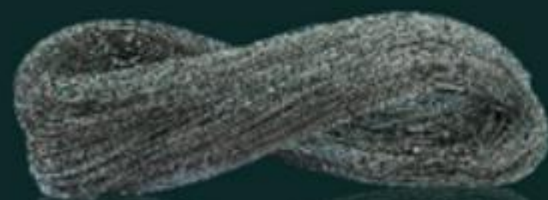
DÂY CHÌ LEAD LINE