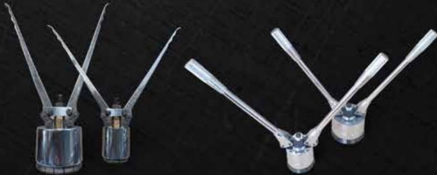
KÉM BẮM NẮP NIÊM PHONG METAL CAP CRIMPING TOOL ( KBN1 )