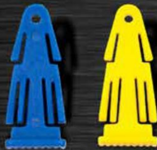
CHỐT KHÓA ĐAI CLAMP PLASTIC SEAL