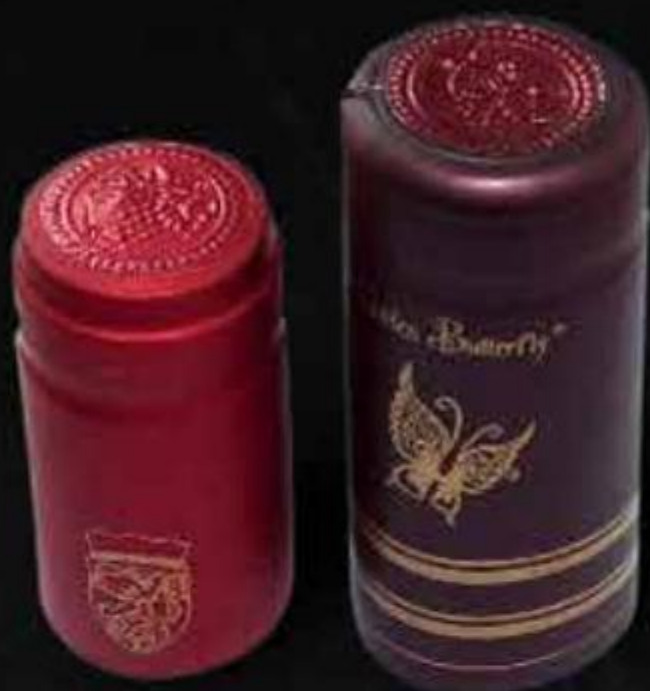
NẮP CHAI RƯỢU WINE BOTTLES CAP