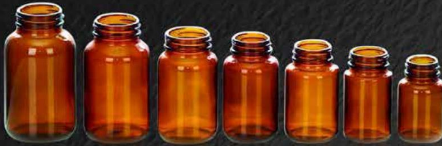
CHAI THUỐC BOTTLE OF TABLE