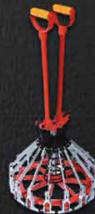
KÌM BẮM XÔ 18 LÍT BẰNG CƠ BUCKET 18 LITER CRIMPING TOOL BY MUSCLE