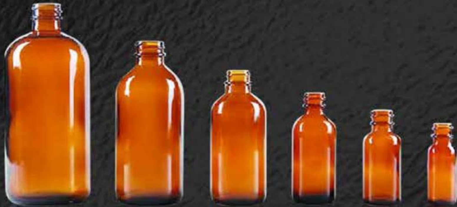
CHAI DƯỢC PHẨM PHARMACEUTICAL BOTTLES