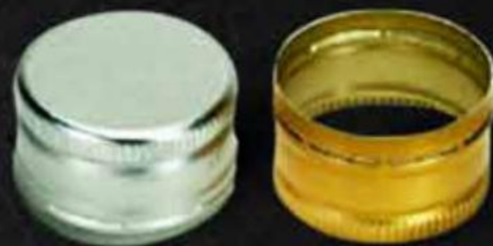
NẮP NHÔM CHO CHAI THỦY TINH ALUMINUM CAP FOR GLASS BOTTLE