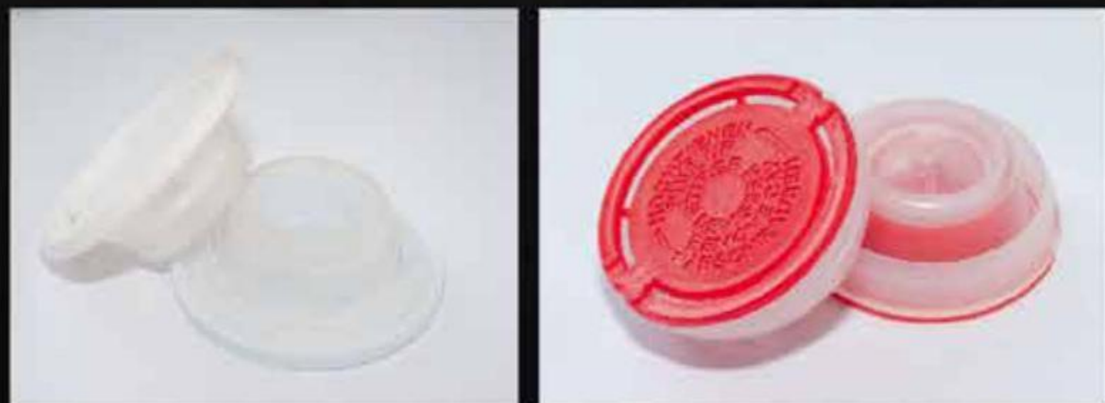
NẮP RÓT NHỰA PLASTIC SPOUT CAPS