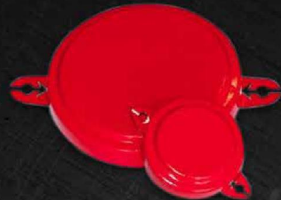
NẮP NIÊM PHONG THÉP (ĐỎ)

Do được làm bằng thép để lại dấu vết và ron nhựa được xịt trực tiếp nên nắp đóng bằng thép là công cụ hiệu quả và mang tính chất kinh tế nhất để bảo vệ hàng hóa bên trong.