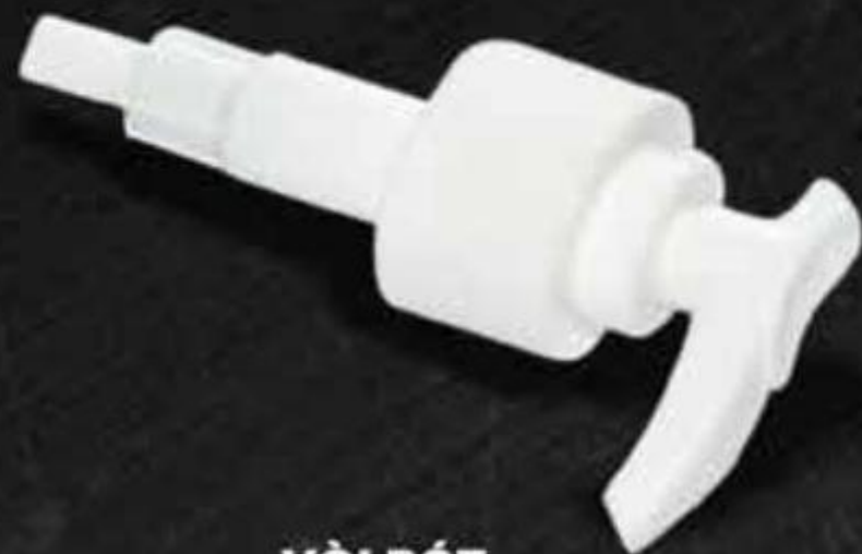
VÒI RÓT SPOUT CAP