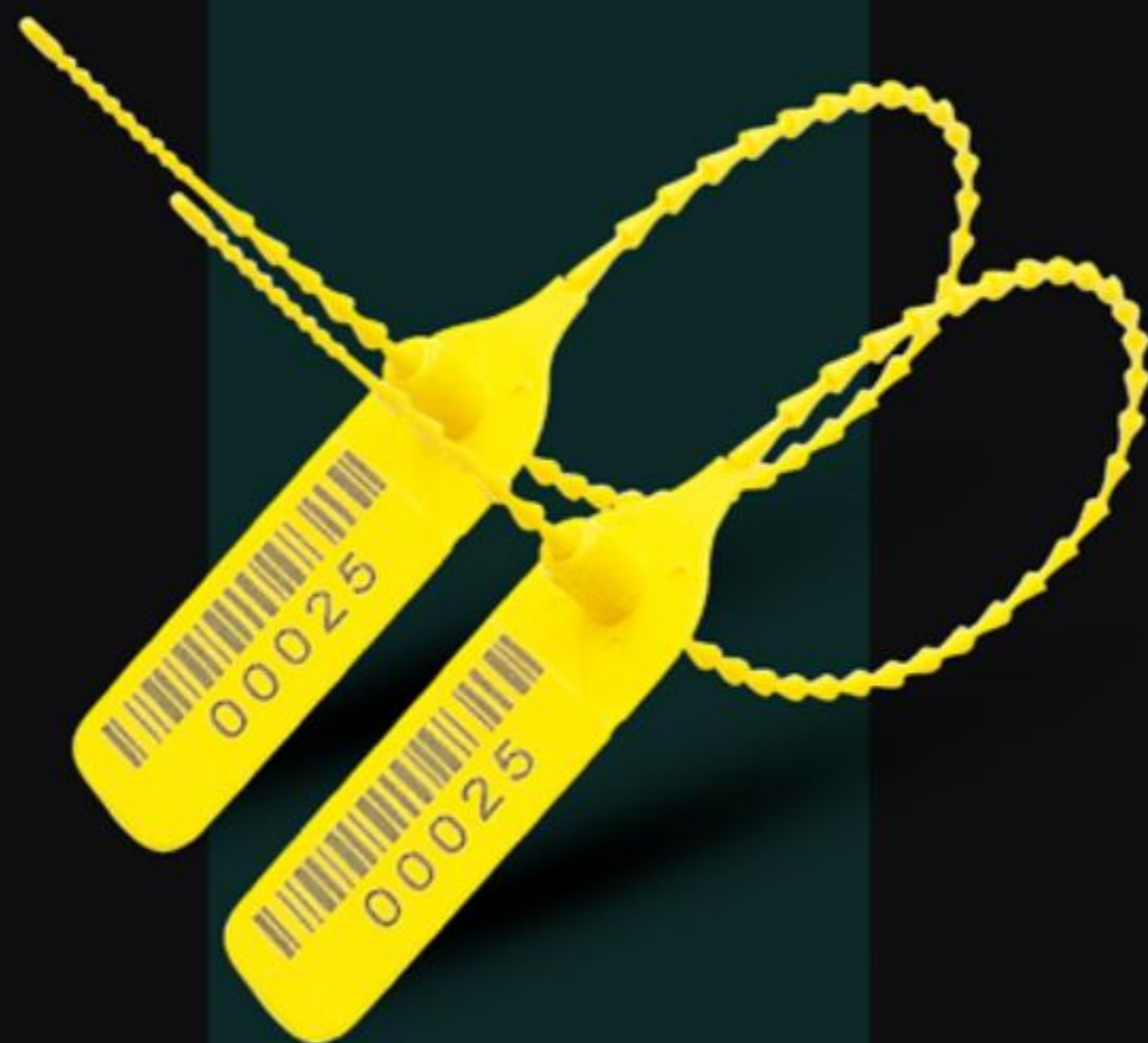
NIÊM PHONG ĐỐT TRÚC NHỎ HIGH SECURITY PLASTIC CABLE SEAL ( NDTN )