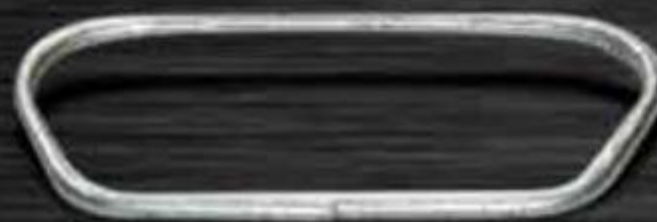
QUAI XÁCH THÙNG HẠT ĐIỀU HANDLE FOR CASHEW DRUM