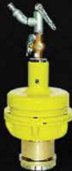
KÉM BẮM NẮP NIÊM PHONG BẰNG KHÍ NÉN AIR METAL CAP CRIMPING TOOL ( KBN2 )