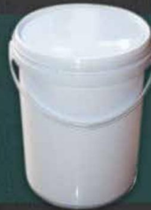
XÔ NHỰA PLASTIC BUCKET