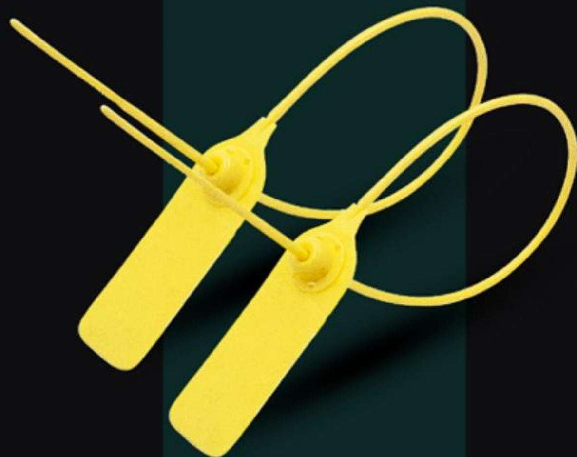
NIÊM PHONG TRÒN KHÓA KIM LOẠI HIGH SECURITY PLASTIC CABLE SEAL ( NTKKLO1 )