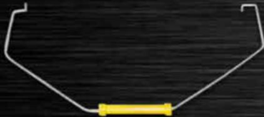
QUAI XÁCH THÙNG 18 LÍT BARRELS HANDLE