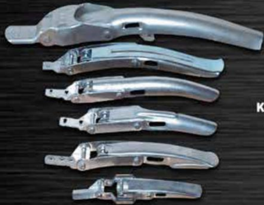
KẸP ĐAI THÙNG PHUY CLAMP FOR LOCKING RING