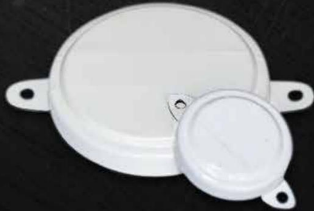
NẮP NIÊM PHONG THÉP (TRẮNG)