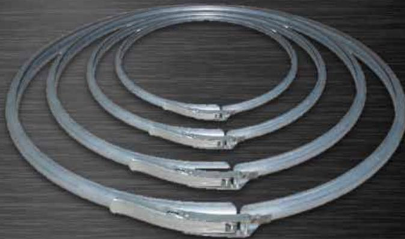
ĐAI KẸP THÙNG PHUY LOCKING CLAMP RING (DKP)