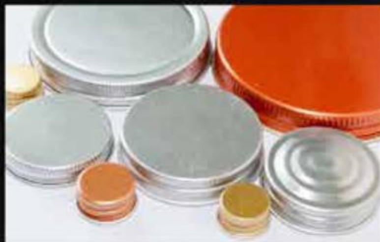
NẮP NHÔM CHO CHAI THỦY TINH ALUMINUM CAP FOR GLASS BOTTLE