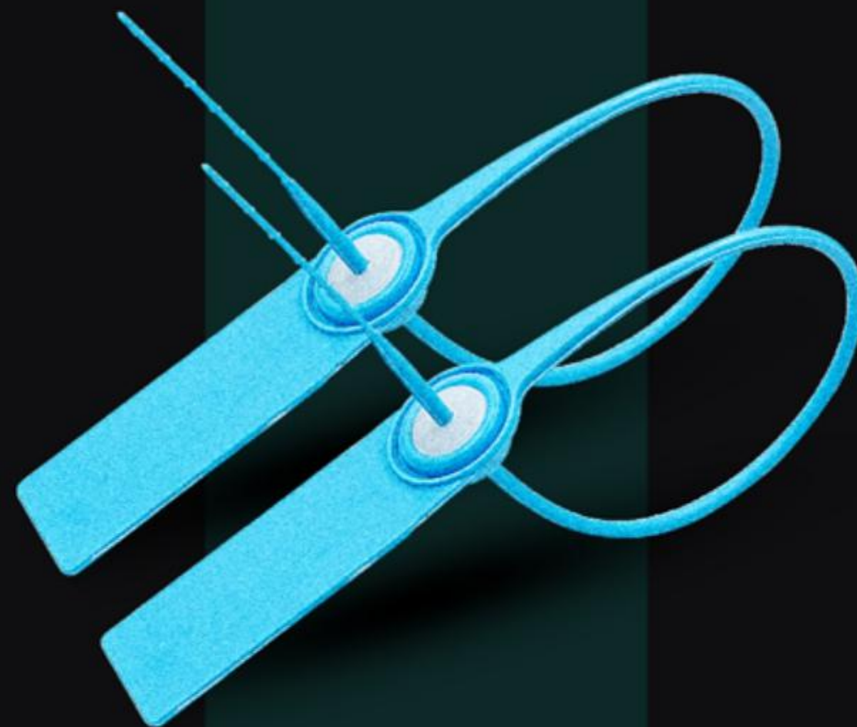
NIÊM PHONG TRÒN KHÓA KIM LOẠI HIGH SECURITY PLASTIC CABLE SEAL ( NTKKL02 )