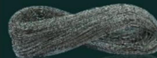
DÂY CHÌ LEAD LINE