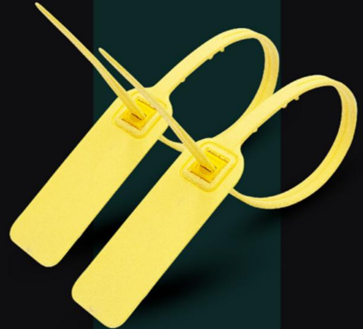
NIÊM PHONG DỆT KHÓA KIM LOẠI HIGH SECURITY PLASTIC CABLE SEAL ( NDKKL )