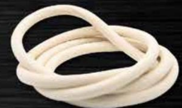
RON XỐP TRẮNG CHO THÙNG PHUY THÉP NẮP MỞ

RUBBER GASKET (HALF MOON FORM) FOR OPEN STEEL HEAD DRUM