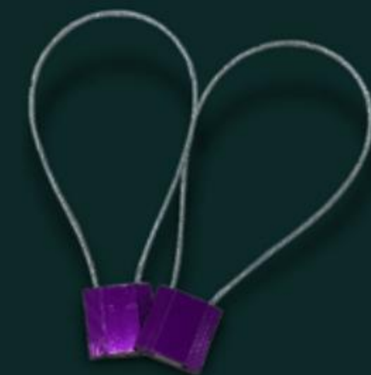
NIÊM PHONG DÂY CÁP CABLE SEAL ( CS )