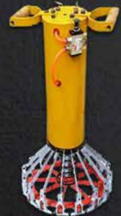
KÌM BẮM XÔ 18 LÍT BẰNG KHÍ NÉN BUCKET 18 LITER CRIMPING TOOL BY AIR PRESS