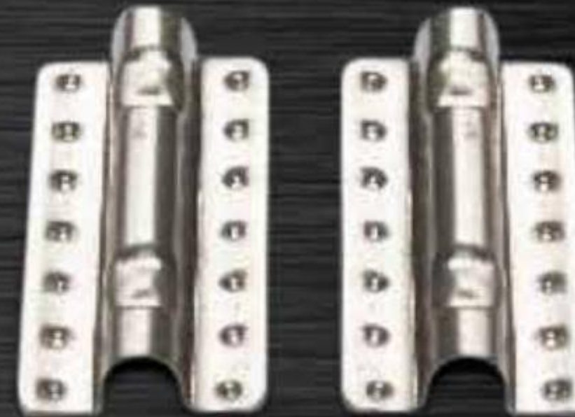
YẾM QUAI THÙNG PLASTRON DRUM

- Material: Handle: iron leaf lacer zinc 3,2mm and 3,8 mm Using to attach the handle in drum with quantity 16-18 liters.