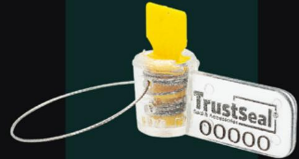
NIÊM PHONG KHÓA VẶN PLASTIC TWISTER SEAL ( NKV )