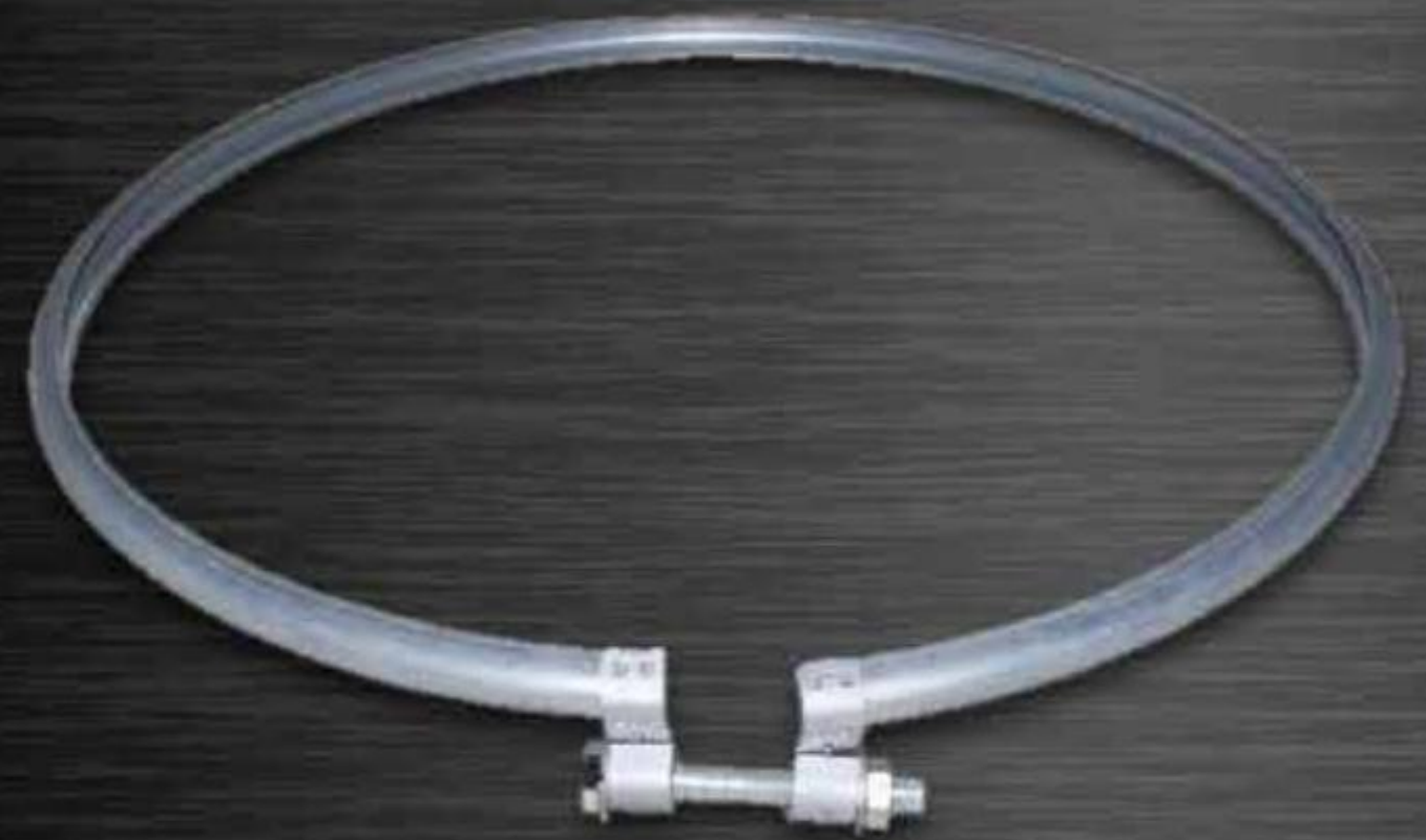
ĐAI ỐC THÙNG PHUY LOCKING LOCKING BOLT RING ( DOP )