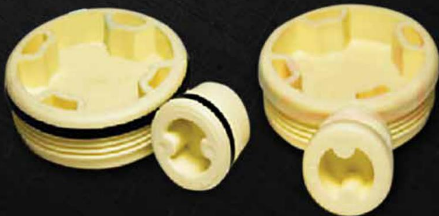
NẮP VẶN NHỰA THÙNG PHUY NẮP VẶN NHỰA THÙNG PHUY ( NVN )