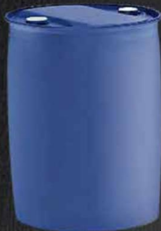
THÙNG PHUY NHỰA 220 LÍT NẮP KÍN TIGHT HEAD PLASTIC DRUM 220 LITER