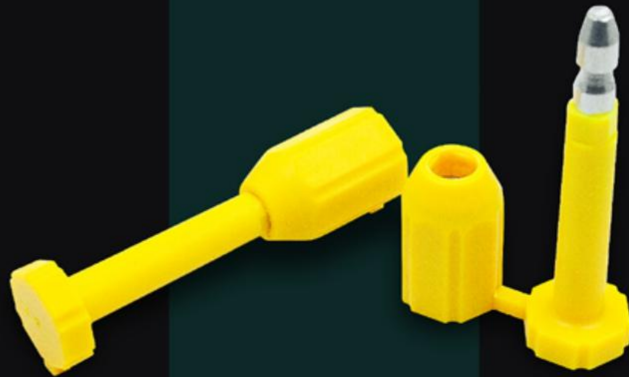
NIÊM PHONG CONTAINER BOLT SEAL (NBOLT)