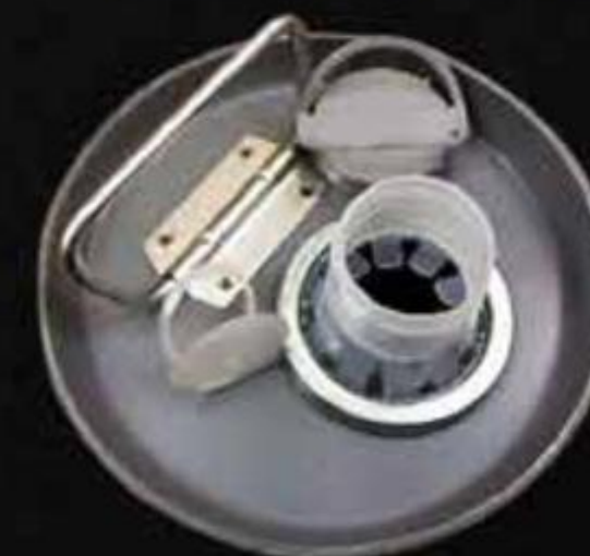
NẮP RÓT NHỰA VÀNH SẮT PLASTIC SPOUT CAPS WITH METAL RING