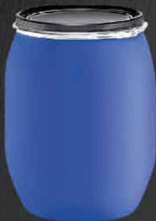
THÙNG PHUY NHỰA 220 LÍT NẮP MỞ OPEN HEAD PLASTIC DRUM 220 LITER