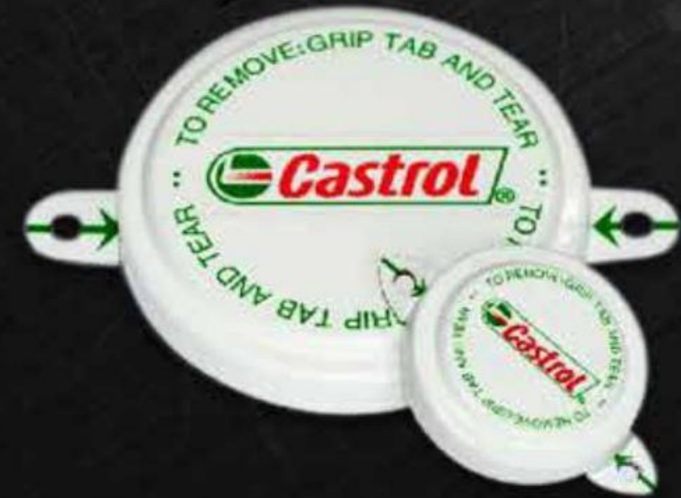
NẮP NIÊM PHONG THÉP (LOGO) METAL TAB SEAL (LOGO) ( NTL )