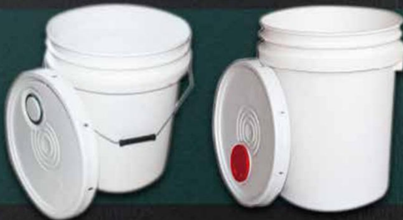
XÔ NHỰA 18 LÍT PLASTIC BUCKET 18 LITER