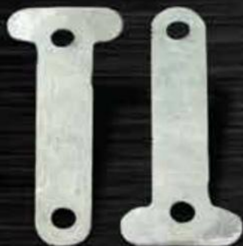
NIÊM ĐAI CHỮ T CLAMP T METAL SEAL