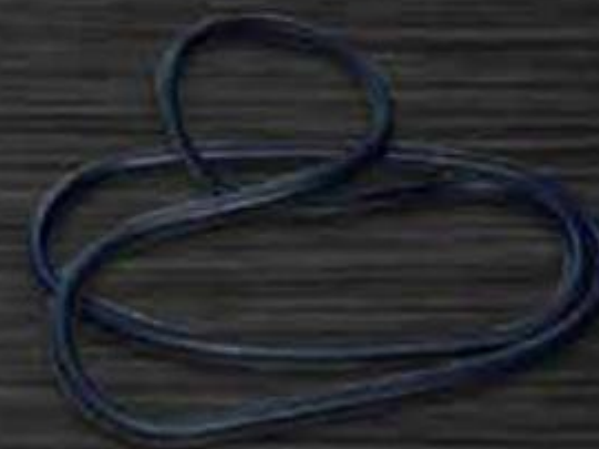
RON CAO SU HÌNH BÁN NGUYỆT CHO THÙNG PHUY THÉP NẮP MỞ

RUBBER GASKET (HALF MOON FORM) FOR OPEN STEEL HEAD DRUM