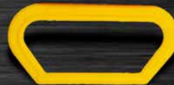
QUAI NẮM ỐNG NHỰA CHỮ NHẬT STRAPS HOLDING RECTANGULAR PIPES