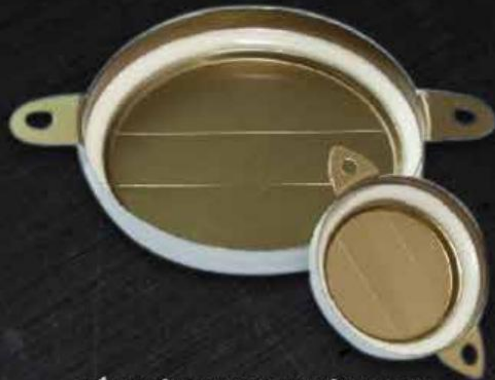
NẮP NIÊM PHONG THÉP (RON) METAL TAB SEAL (GASKET) ( NTL )

Do được làm bằng thép để lại dấu vết và ron nhựa được xịt trực tiếp nên nắp đóng bằng thép là công cụ hiệu quả và mang tính chất kinh tế nhất để bảo vệ hàng hóa bên trong.