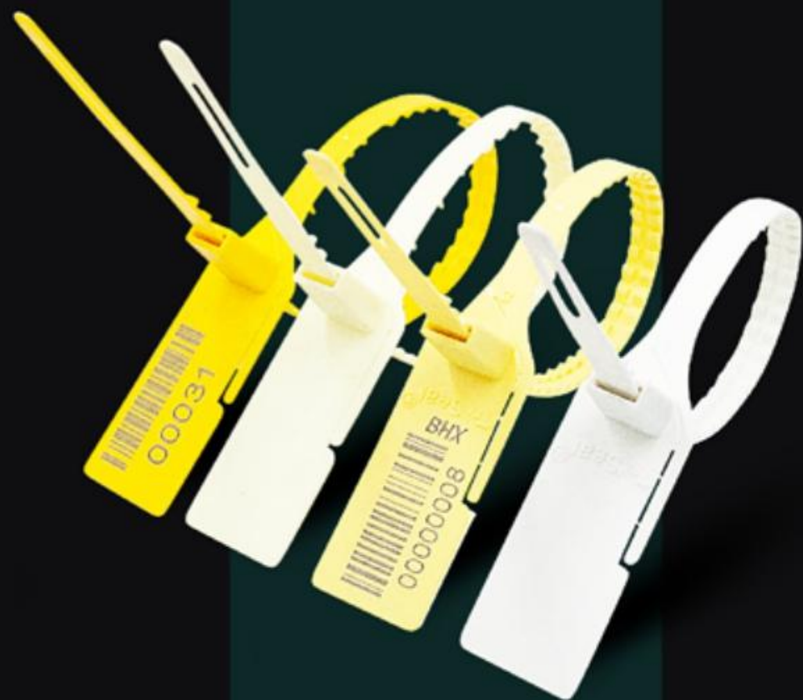
NIÊM PHONG DÂY RÚT DỆT HIGH SECURITY PLASTIC CABLE SEAL ( NDRD )