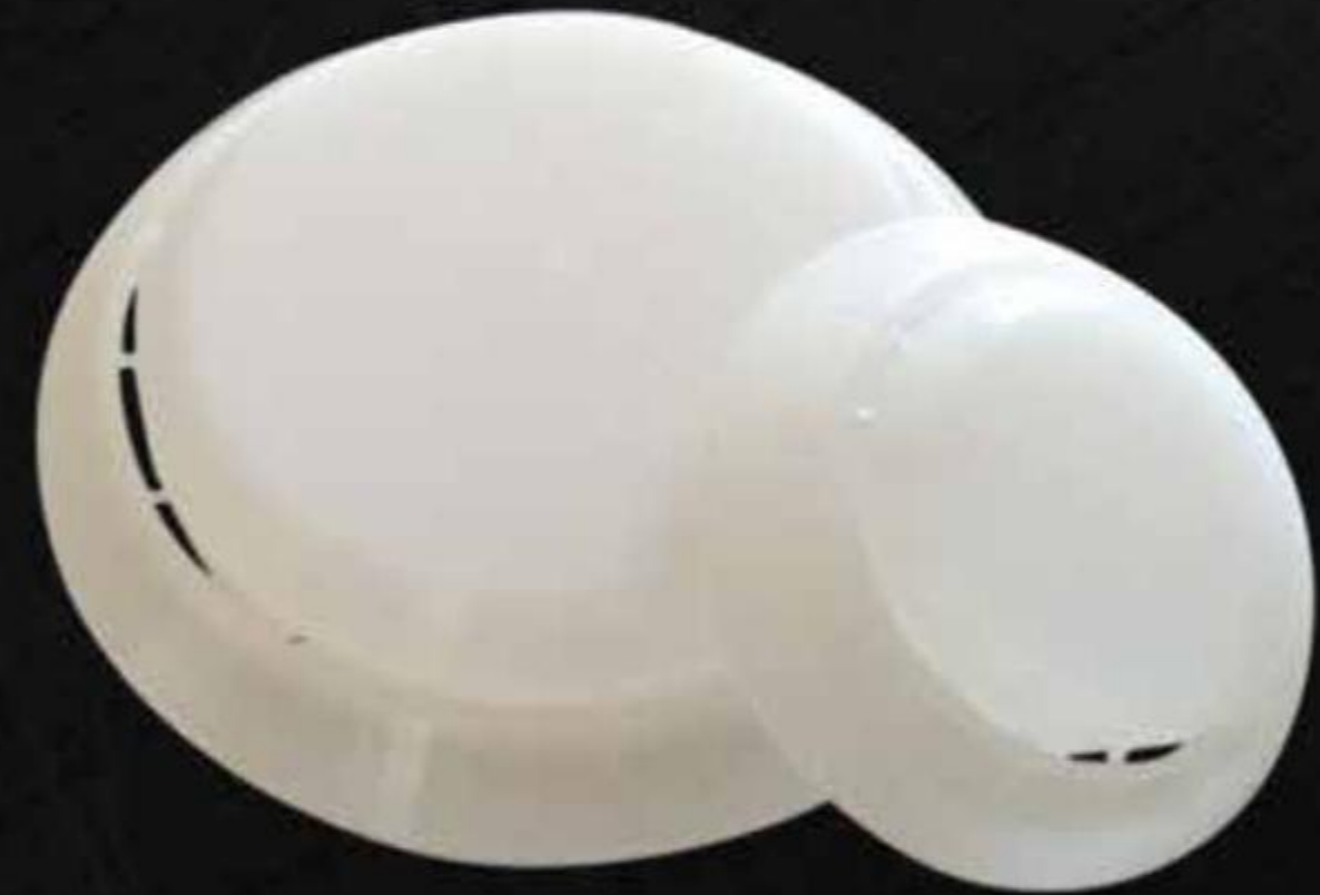
NẮP NIÊM PHONG NHỰA PLASTIC TAB SEAL ( NCP )