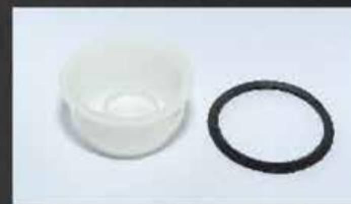
NÁP LÓT CAN NHỰA VÀ RON CAP INSERT FOR PLASTIC CAN AND GASKET