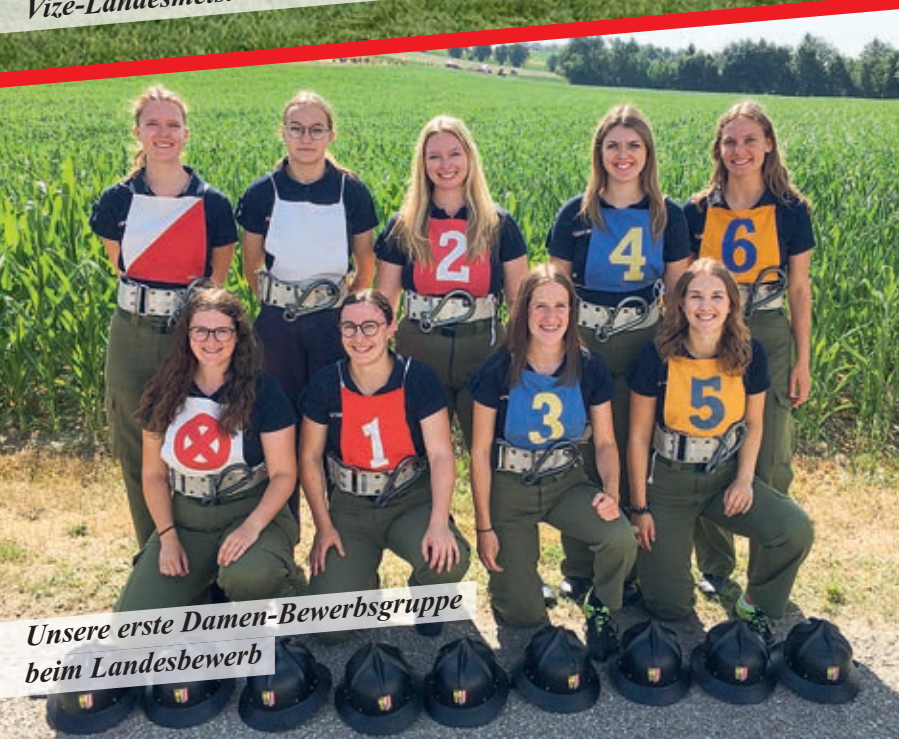
Unsere erste Damen-Bewerbsgruppe beim Landesbewerb