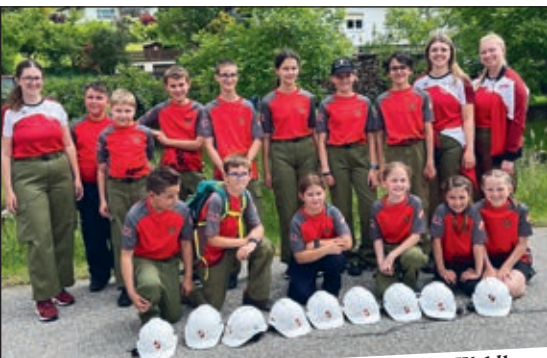
Abschnittsbewerb in Waldhausen