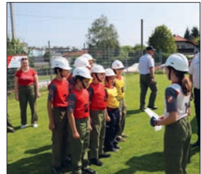
Trainingslager Gruppe 1