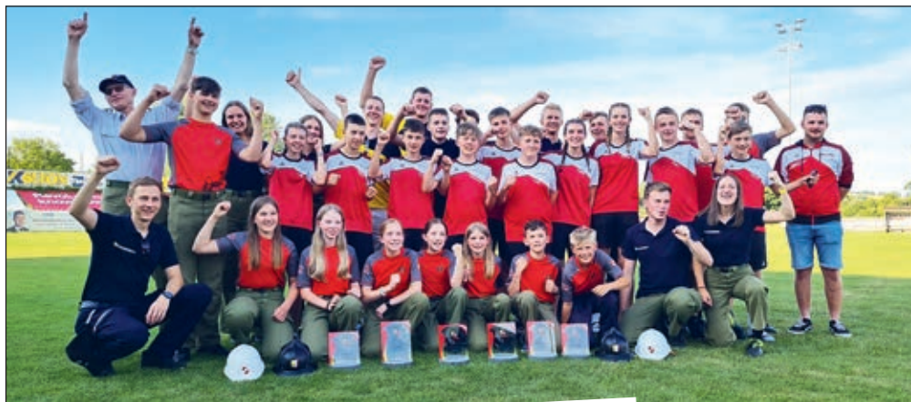
Bezirkswettbewerb in Perg