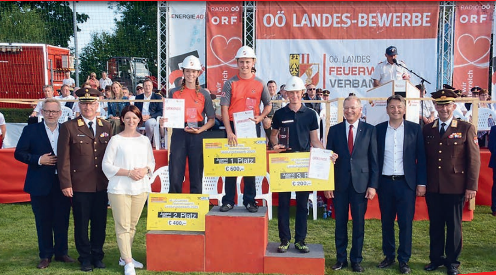
Vize-Landesmeistertitel in Aspach-Wildenau