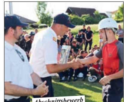
Abschnittsbewerb in Ried in der Riedmark