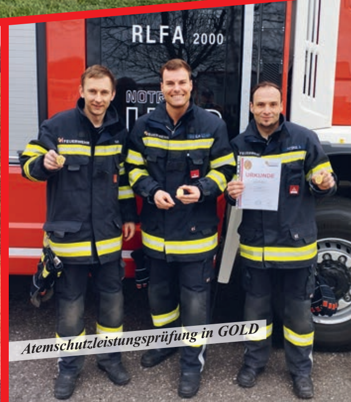
Atemschutzleistungsprüfung in GOLD