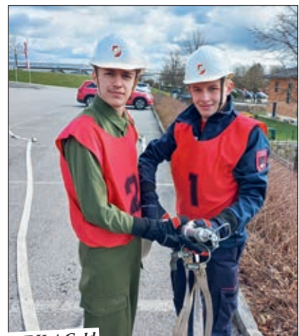
Erfolgreiches FJLA Gold