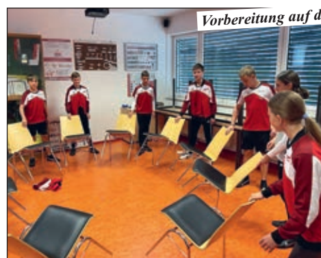
Vorbereitung auf den Bundesbewerb

bestmögliche Leistung abzurufen und, wenn alles gut läuft, sich für die Weltmeisterschaft zu qualifizieren. Das bedeutete, dass der 1. oder 2. Platz errungen werden musste. Nach einer 2-wöchigen Pause wurde mit dem Training für den Bundesbewerb gestartet. Ein herzlicher Dank gilt hier dem TSV St. Georgen an der Gusen, bei dem wir auf einer Stadionlaufbahn den Staffellauf trainieren durften.