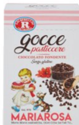
REBECCHI GOCCE DI CIOCCOLATO FONDENTE - 125 G