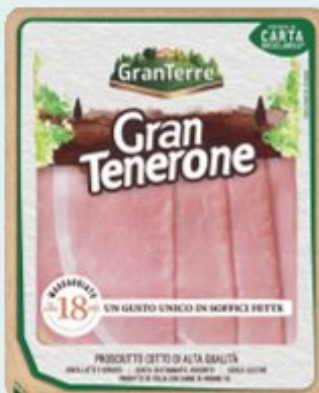
GRAN TERRE GRAN TENERONE PROSCIUTTO COTTO 110 G