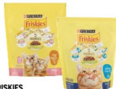
FRISKIES CROCCHETTE PER GATTO JUNIOR POLLO LATTE E VERDURE/ STERILIZED SALMONE E VERDURE 375 G