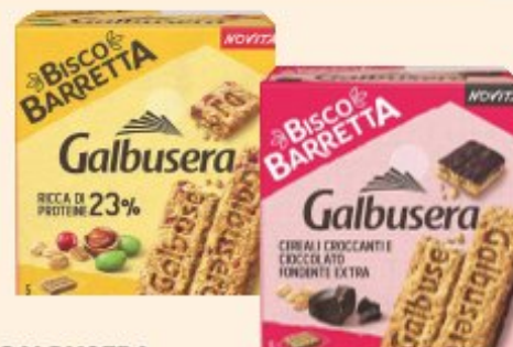
GALBUSERA BARRETTA PROTEICA VARI TIPI 230/180 G