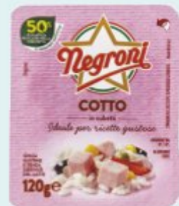
NEGRONI COTTO IN CUBETTI 120 G