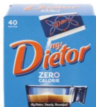
DIETOR DOLCIFICANTE 40 BUSTINE