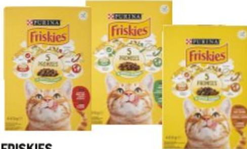
FRISKIES CROCCHETTE PER GATTO VARI GUSTI 400 G