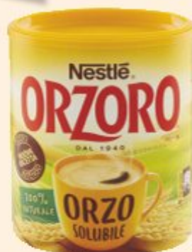
NESTLÉ ORZORO ORZO SOLUBILE 120 G