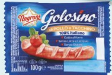
NEGRONI GOLOSINO WURSTEL DI POLLO E TACCHINO 100 G