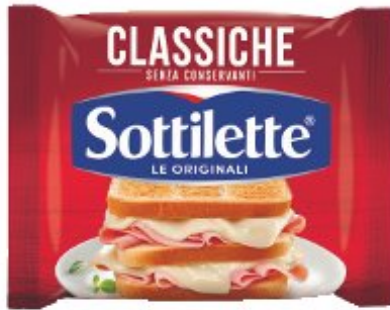
SOTTILETTE CLASSICHE 400 G