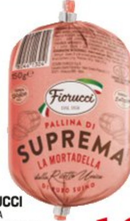
FIORUCCI PALLINA DI MORTADELLA SUPREMA 150 G