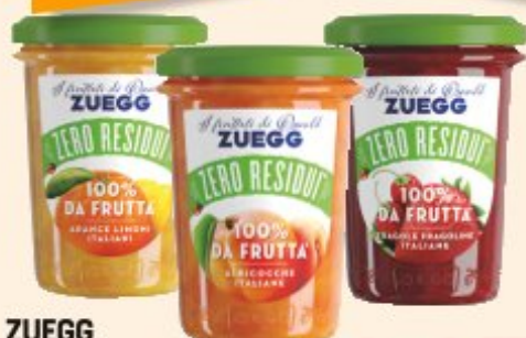
ZUEGG CONFETTURA ZERO RESIDUI 100% DA FRUTTA VARI GUSTI - 230 G