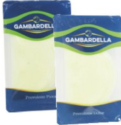
GAMBARDELLA PROVOLONE DOLCE/PICCANTE 80 G