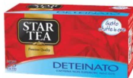
STAR TEA DETEINATO 25 FILTRI