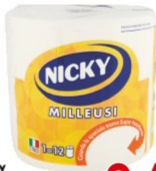
NICKY BOBINA MILLEUSI 600 STRAPPI