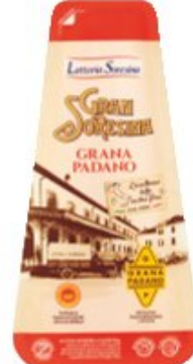
LATTERIA SORESINA GRANA PADANO 300 G