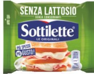
SOTTILETTE SENZA LATTOSIO 200 G