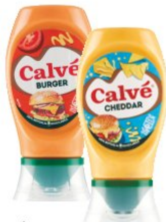
CALVÉ SALSE TOP DOWN VARI TIPI 250 ML