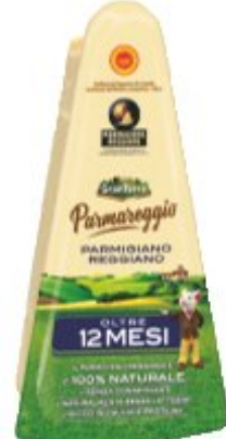
GRAN TERRE PARMAREGGIO PARMIGIANO REGGIANO 200 G