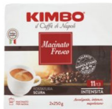
KIMBO CAFFÈ MACINATO FRESCO 250 G X 2