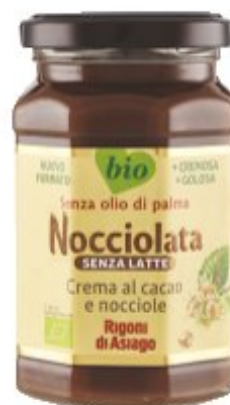
RIGONI DI ASIAGO NOCCIOLATA BIO SENZA LATTE 250 G