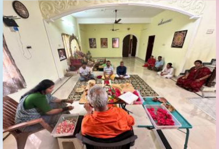
Nitya puja by Guruji in peetham