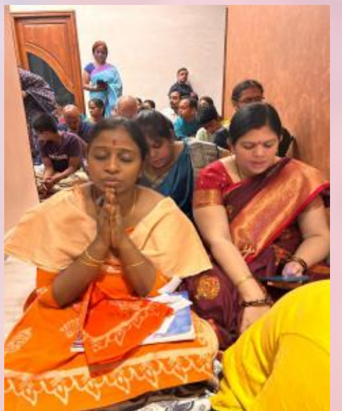
Hanumajjayanthi puja in Hyderabad by Guruji and Amma