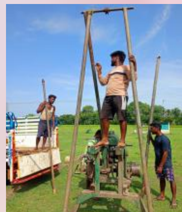
Soil testing being done in peetham land in Kancheepuram