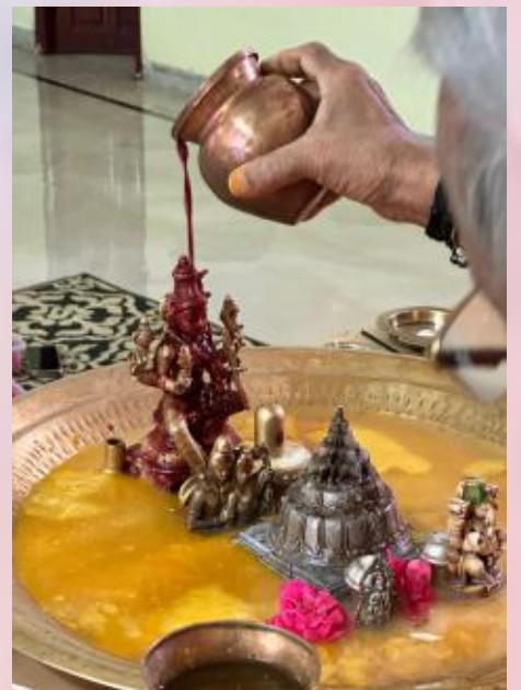
Nitya puja by Guruji in peetham