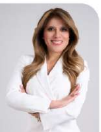
Paola Vivas Empresaria, Presentadora de TV

Porque cuando la voz se entrega desde el servicio y la verdad, su eco trasciende el momento, abriendo senderos para que otros también puedan avanzar con fuerza y dignidad.