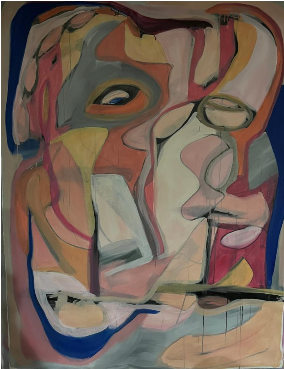
"Looking Out For You"

144,78 x 111,76 cm (57 x 44 in) - acrylic on canvas