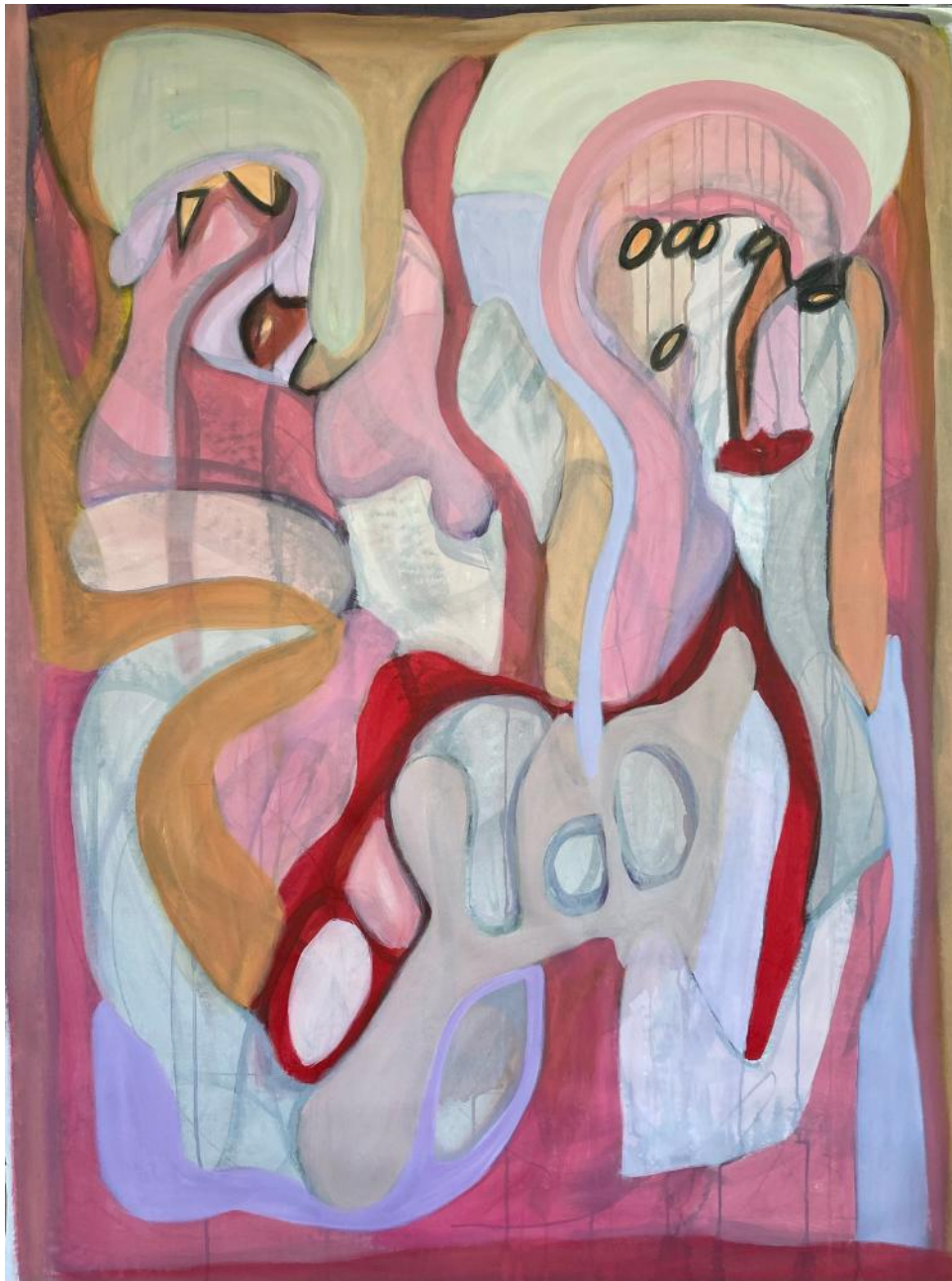
"Looking For Attention"

144,78 x 111,76 cm (57 x 44 in) - acrylic on canvas