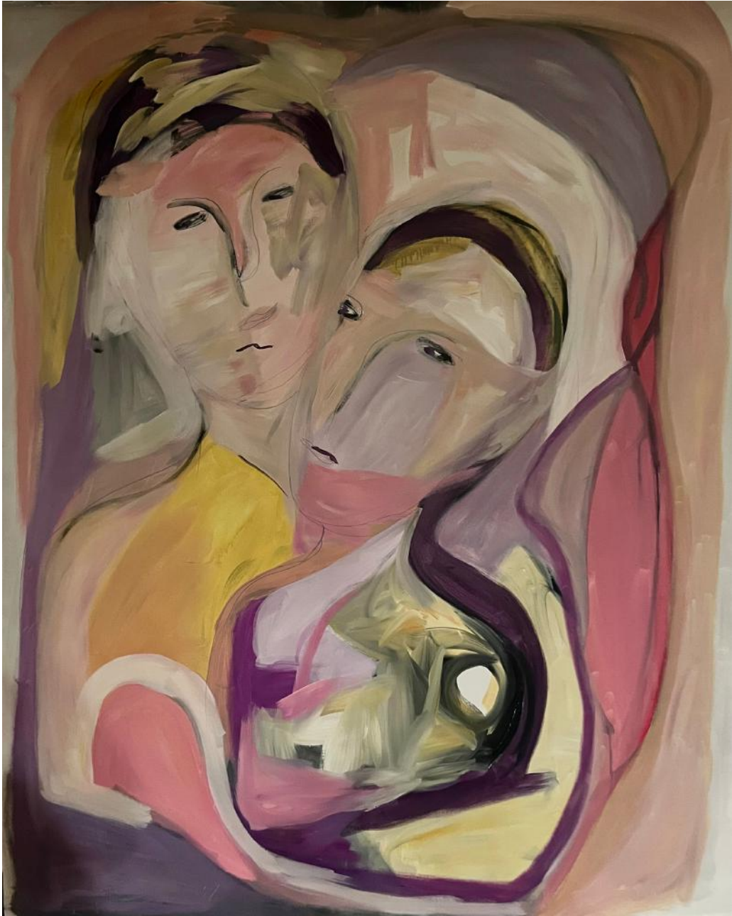
"Two Become One"

144,78 x 111,76 cm (57 x 44 in) - acrylic on canvas - 2022