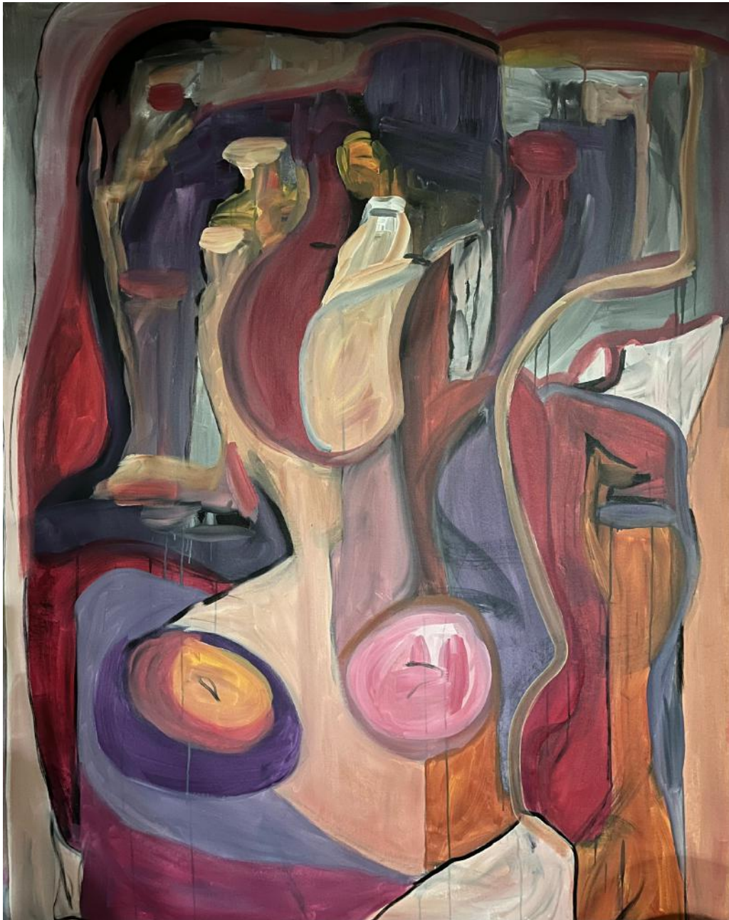
"A Face in The Crowd"

144,78 x 111,76 cm (57 x 44 in) - acrylic on canvas - 2022