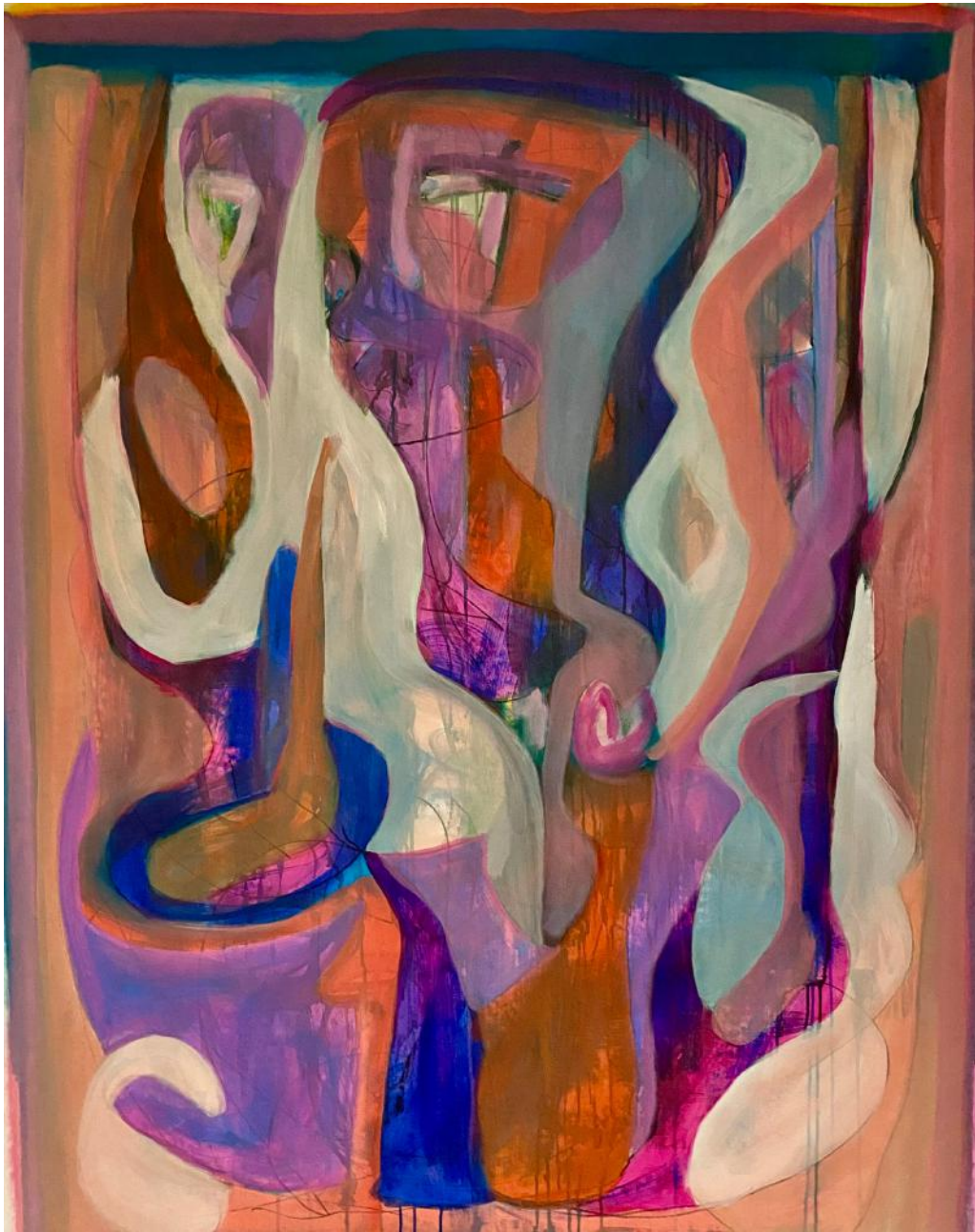
"Putting Our Heads Together"

144,78 x 111,76 cm (57 x 44 in) - acrylic on canvas