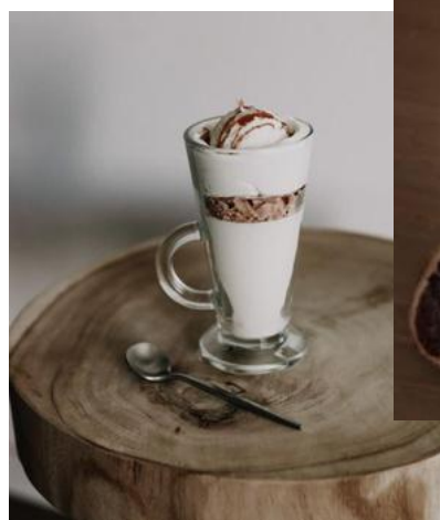
Caramel beurre salé 19€ l'unité

Senteur Pain d'épices, Brioche, Chocolat ou Caramel 9,90€ l'unité