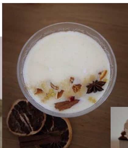
Cannelle 19€ l'unité