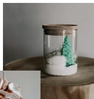
Sapin 22€ l'unité