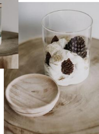
Pomme-Cannelle 22€ l'unité