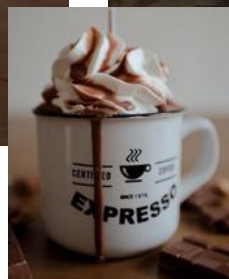
Caramel 19,80€ l'unité