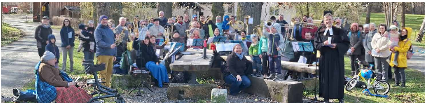
Gemeinsam feiern, so wie hier beim Gottesdienst am Ostermontag 2026 am Buchstein