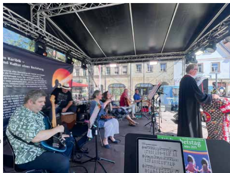
Blick auf die Bühne