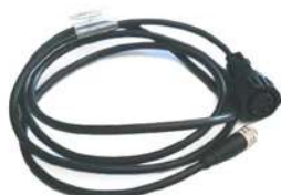
Cavo diagnostico idraulica trazione/sollevamento connettore lato Macchina 7 poli connettore lato CANBOX 4 poli