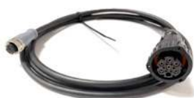
Cavo adattatore da utilizzare con Peak (Cod. GR G000140) STILL/LINDE/OM Cavo diagnostico idraulica e trazione lato macchina 7pin