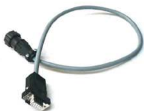
Cavo adattatore da utilizzare con Peak (Cod. GR G000140) STILL/LINDE/OM