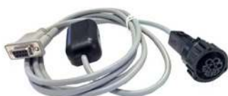
Cavo adattatore interfaccia per diagnosi motore LINDE e STILL sui motore diesel