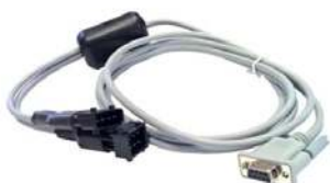
Cavo interfaccia diagnostica da utilizzare con Truck Doctor