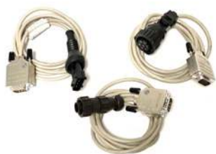
Cavi Interfaccia Linde (in dotazione)