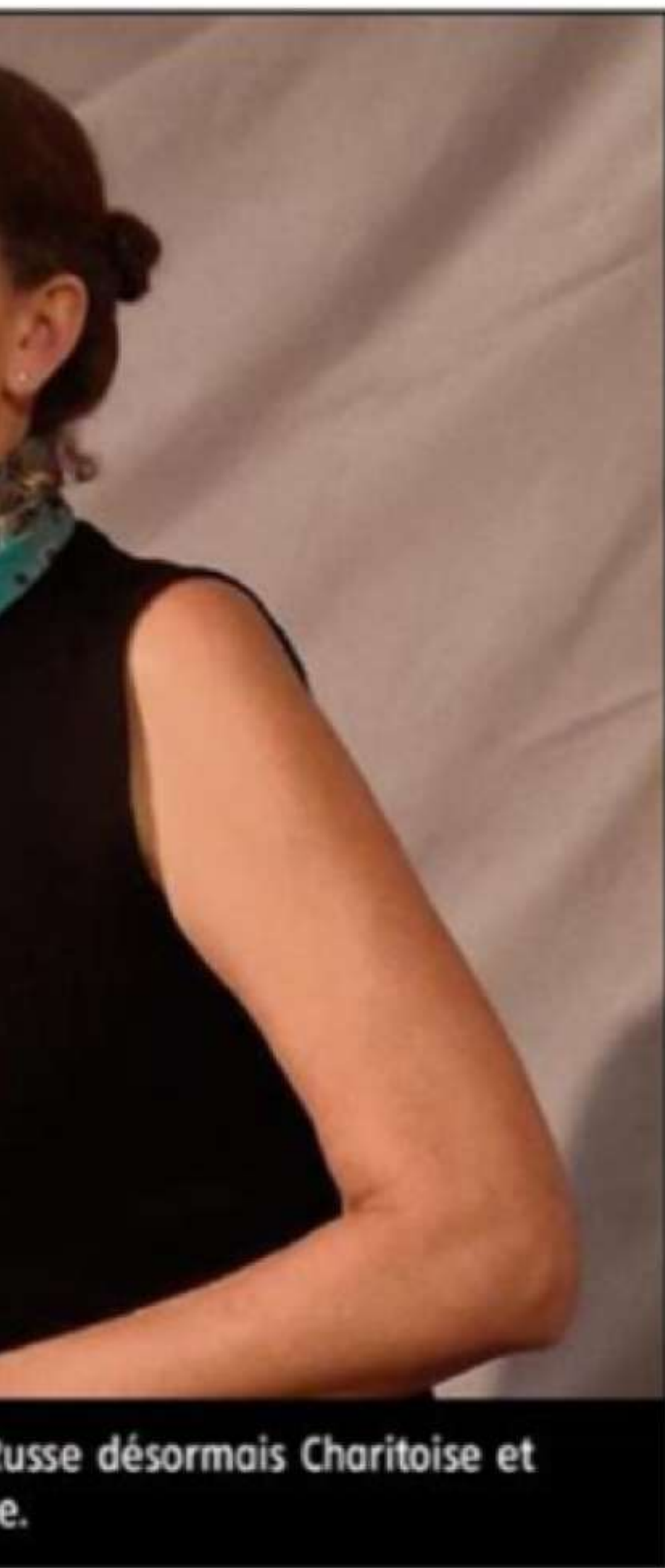
Russe désormais Charitoise et e.

la jeunesse qu'elle évoque avec humour, presque avec nostalgie, évocation de ses grands-parents pris dans la tourmente révolutionnaire. Inévitablement la Pérestroïka, puis arrivée en France à Paris où elle sera mannequin. « Je vendais le charme slave aux Français », lance-t-elle avec humour et son délicieux accent russe.