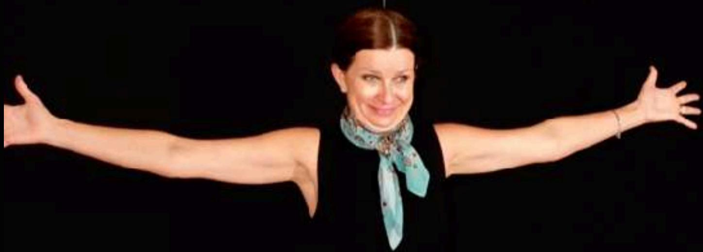
Une russe Bourguignone