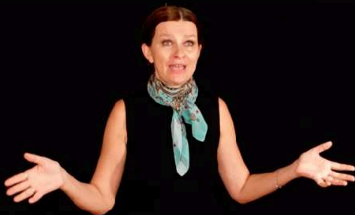
Le mariage forcé