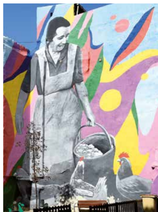
Mural a Sant Martí de Maldà.