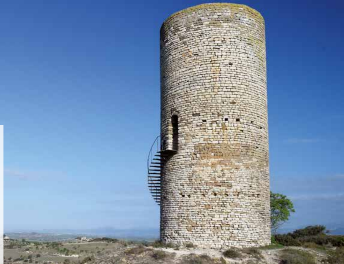
La torre d'Almenara, del segle XII, per a la defensa i vigilància del territori.