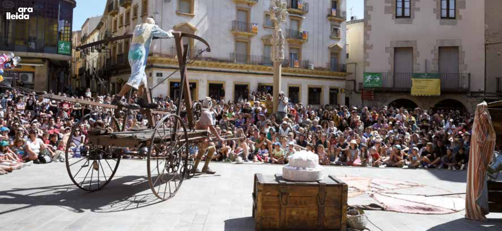
Una icona: Fira Tàrrrega, mercat internacional de les arts escèniques, que cada any al setembre omple d'espectacles els carrers de la ciutat.

del castell. Tornarem al punt de partida pel carrer Agoders, on hi ha un conjunt de cases del segle XVII, el Consell Comarcal de l'Urgell i l'Oficina de Turisme. Uns carrers i places que cada setembre acullen Fira Tàrrrega, el mercat internacional de les arts escèniques, que omple la ciutat de companyies i de públic d'arreu del món.