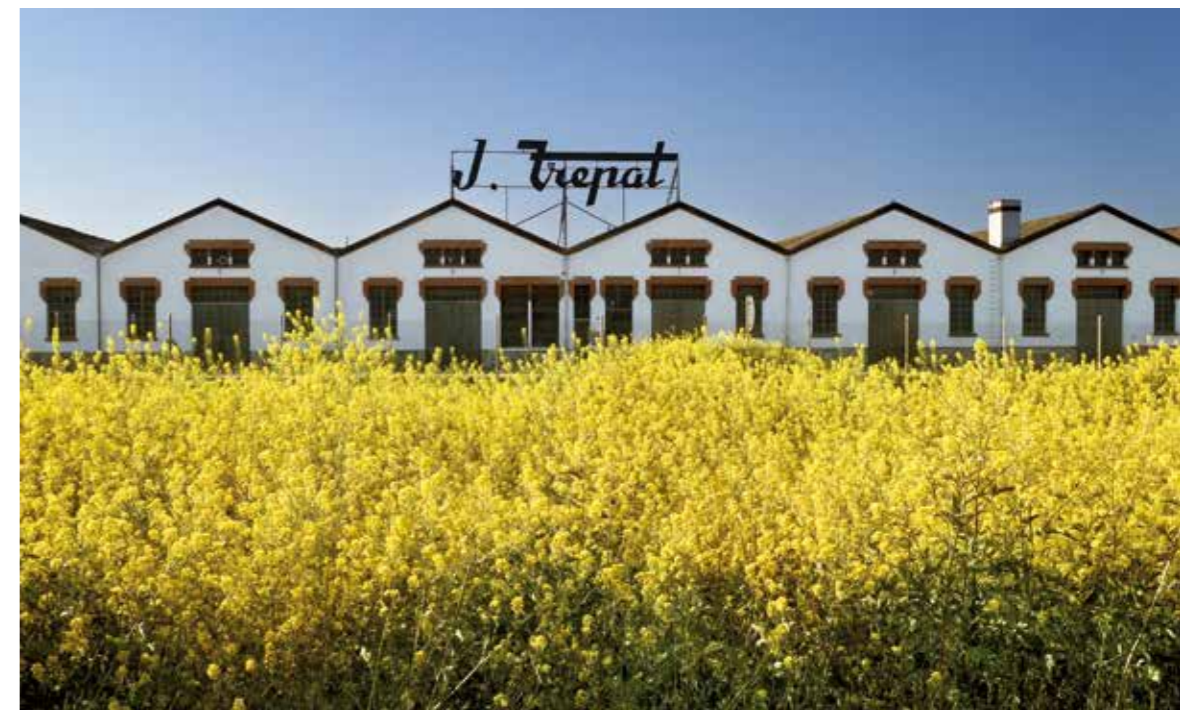
Al Museu de la Mecanització Agrària Cal Trepal es pot observar com fabricaven abans les màquines per treballar al camp.

de la comarca, des dels seus antecedents fins a la romanització del territori. Tragèdia al Call-Tàrraga 1348 permet conèixer la història i el pas dels jueus per la ciutat, i també el context urbà i ideològic de la Tàrraga dels segles XIII i XIV amb un conjunt de peces gòtiques i romàniques. De forma permanent s'exposa l'obra dels germans artistes Antoni i Ramon Alsina.