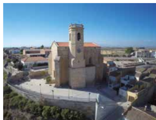
L'església de Preixana, d'estil gòtic tardà, domina el poble.

al voltant del 1525 amb marbre blanc de Carrara. Originàriament era a l'església del convent de Sant Bartomeu, però al segle XIX el van dur aquí per protegir-lo.