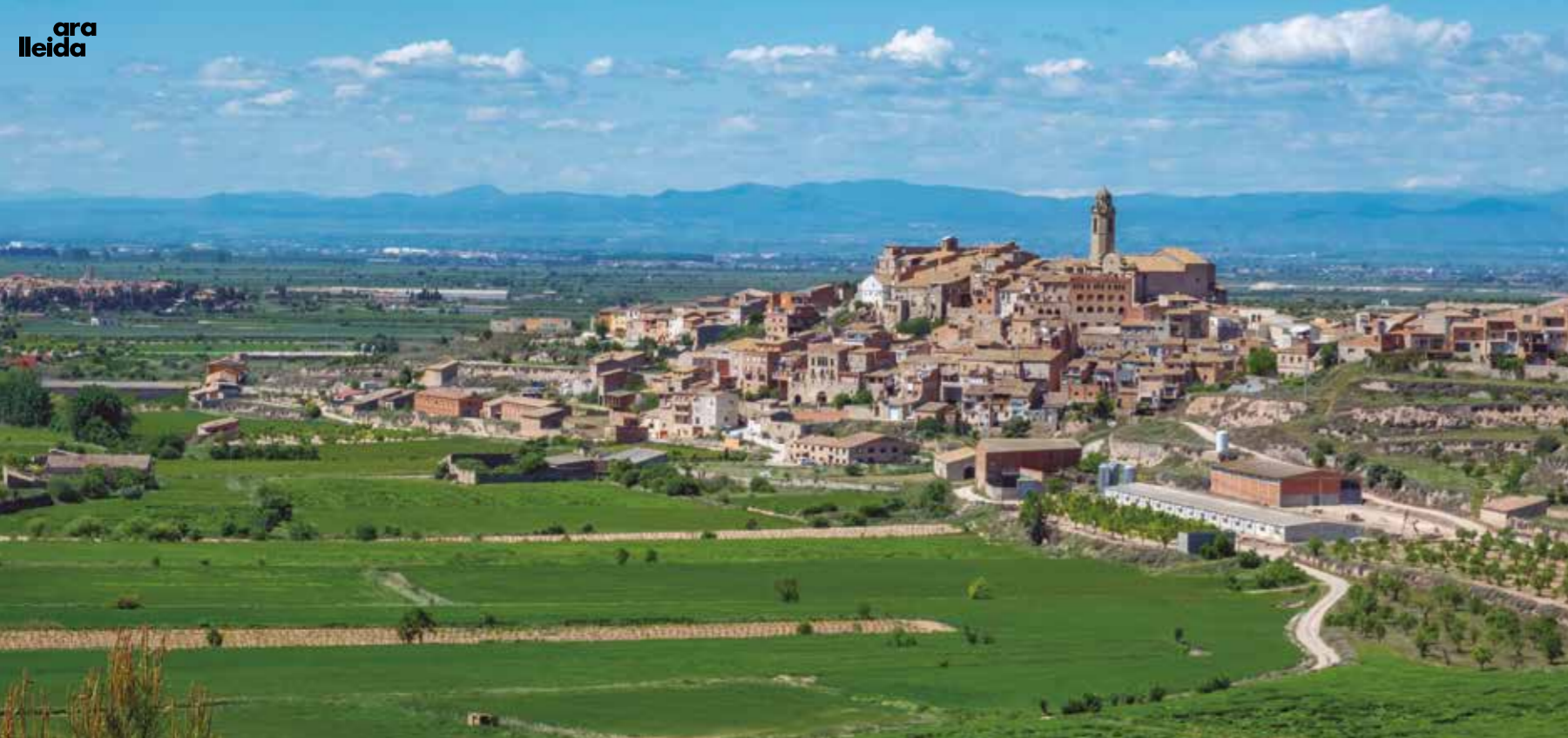
Maldà es troba situat a la riba esquerra del riu Corb, entre el verd intens dels sembrats d'ordi i blat i el blau infinit d'un cel màgic.

assentament ilerget fortificat que data del segle III aC. I al seu peu, les restes d'una vil·la romana, dels segles I al III dC. Les troballes s'exposen al Museu d'Arqueologia-Col·lecció Ramon Boleda, al castell de Verdú.