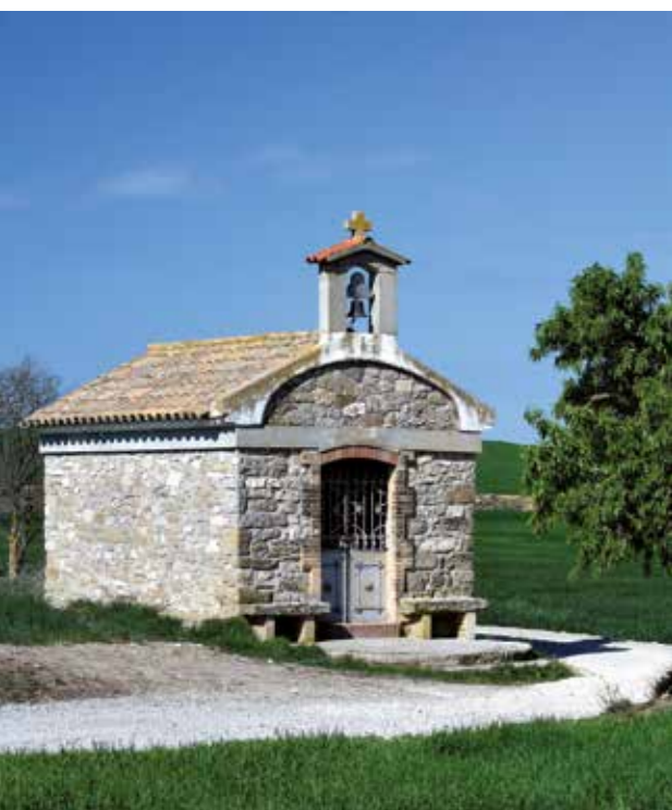
Ermita barroca de la Mare de Déu dels Arcs, a Claravalls.

Al turó del Molí del Vent hi ha la Figuerosa. Si fem un passeig pels seus carrers, d'aire medieval, trobarem bonics racons amb bancs per reposar a l'ombra d'un portal, fets amb trencadís, o l'església. És aquí on comença una ruta circular que passa per Riudovelles i conreus de secà. Veurem basses, marges de pedra seca i la flora i fauna de la zona. En un moment del camí deixem la via que porta a Conill, un poble deshabitat, singular i interessant. Acabarem a Santa Maria de Montmagastrell, amb els seus carrers i places acollidores i l'església barroca.