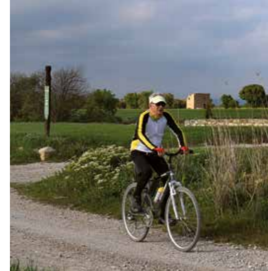
A l'Urgell hi ha nombroses rutes per fer a peu o en bicicleta.

El visitant també troba bon menjar als restaurants i fondes de la comarca. Restauradors i restauradores fan art de la seva feina. Alguns amb propostes tradicionals com els peus de porc o els cargols, i altres amb plats innovadors fets amb productes