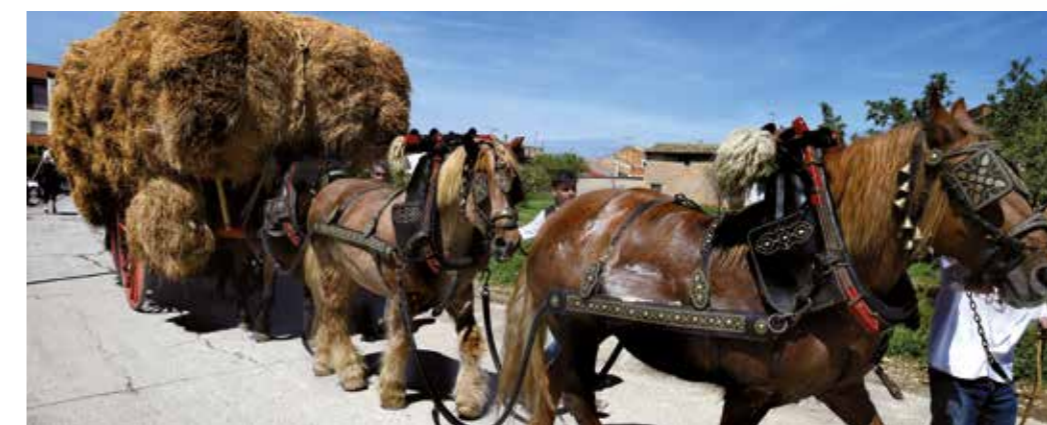
La festa dels Tres Tombs d'Anglesola atreu cada any centenars de visitants.

Posarem punt final a aquesta ruta a Vilagrassa, també a tocar de l'Ondara. L'estructura del poble té el seu origen en una vila closa. Descobrirem la capella del Roser, d'estil gòtic tardà, i una creu de terme. Però l'edifici que dona més personalitat a la població és l'església de Santa Maria, d'origen romànic. El campanar presenta una certa inclinació que ens recordarà la Torre de Pisa.