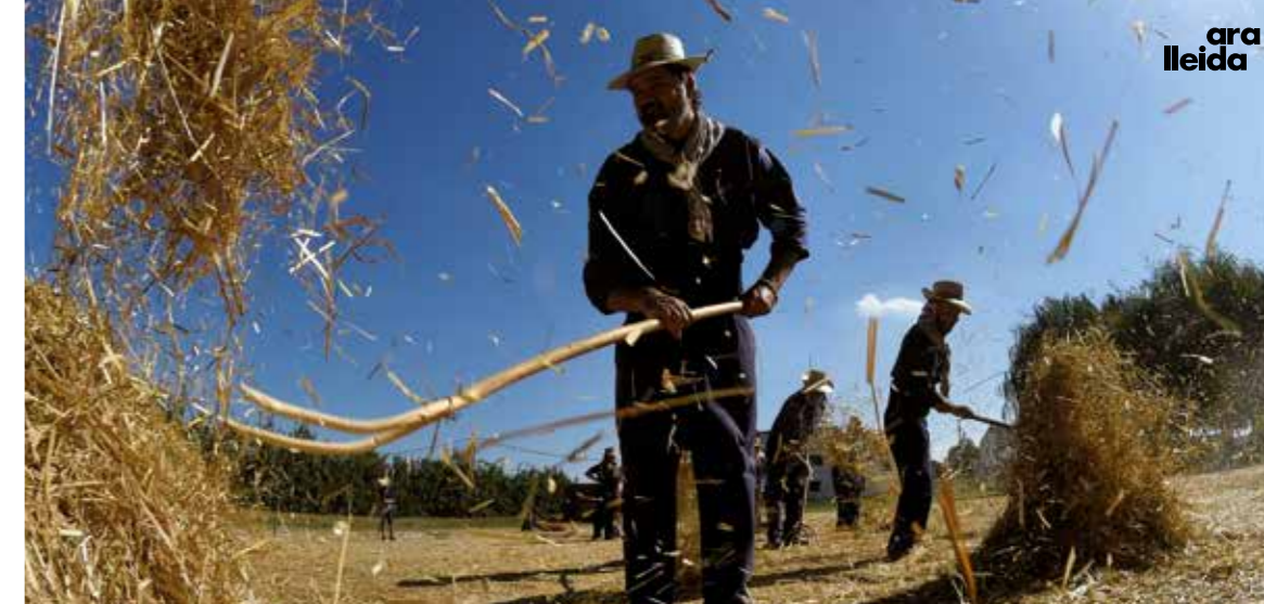
Fa més de 40 anys que la Fuliola celebra la Festa del Segar i el Batre, un homenatge a les antigues tasques del camp.

Un passeig pels carrers de Boldú ens descobrirà cases pairals de fa uns segles: Cal Batalla, Cal Cabaler, Cal Boada o Ca la Simona; la seva església d'origen romànic, i una creu de terme del XVII. La seva Festa Major del Roser, al maig, acull la tradicional plantada del xop. Un ritu que té com a protagonista un arbre que es talla i es porta al poble. Ja de nit lliguen cordes al xop, les estiren i l'alcen des de terra, i el deixen plantat a la plaça. Una festa lligada a la primavera, un ritual ancestral per assegurar la prosperitat.