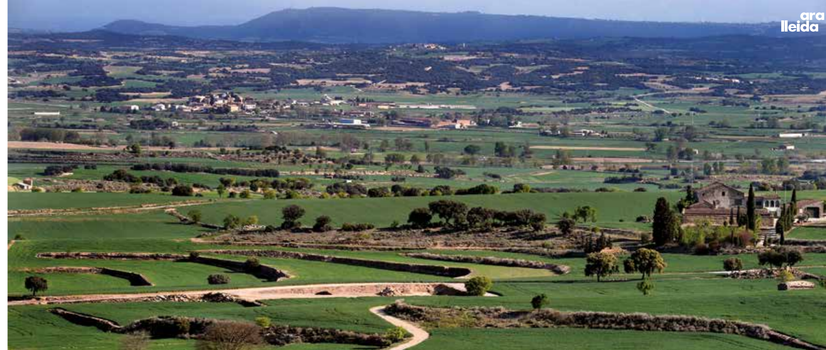
Vista de les planes de l'Urgell des de la torre d'Almenara, on la primavera tenyeix de verd els camps de cereal.