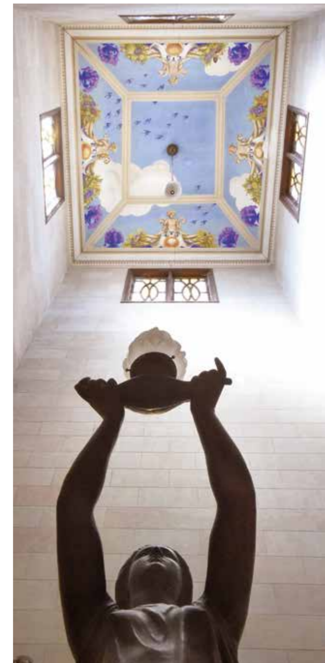
Espectacular el detall de la Cambra de Comerç de Tàrraga.

Només sortir del museu podem anar a la plaça porticada on hi ha l'església de Sant Antoni, a tocar del Sant Hospital i als peus de les ruïnes