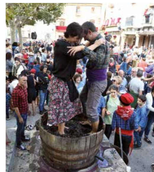
Piada del raïm a la Festa de la Verema de Verdú.

de temporada i de proximitat. Plats elaborats amb l'oli de la DOP Les Garrigues, que el visitant pot acompanyar amb els vins de la DO Costers del Segre, cervesa artesana o sidra. I per acabar, unes postres dolces a base de fruita, xocolata a la pedra, torró o fruits secs de la zona.