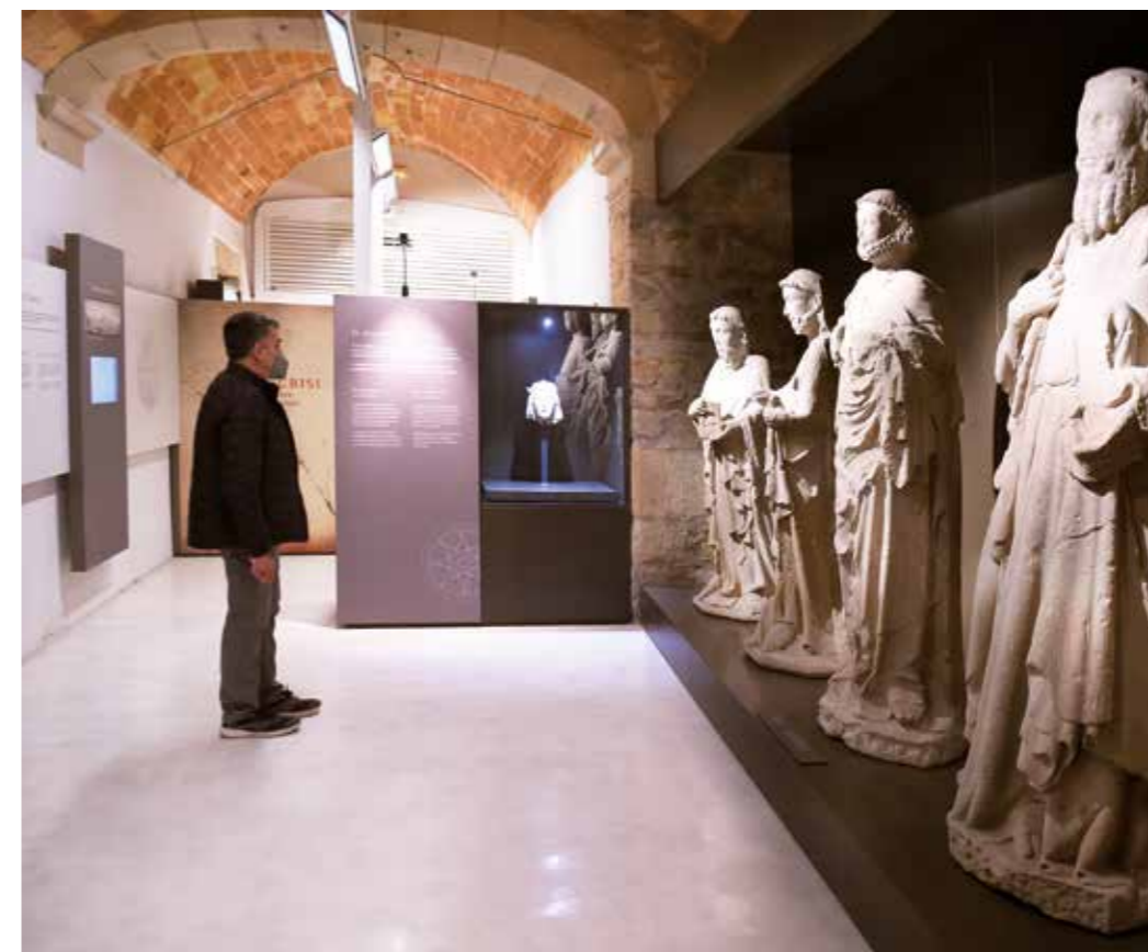
Museu Comarcal de l'Urgell, situat a Cal Perelló de Tàrraga, una casa pairal del s. XVIII.

Al carrer Major trobarem la casa pairal Cal Perelló, del segle XVIII. Acull el Museu Comarcal de l'Urgell. Les seves sales nobles ens traslladaran del segle XVII al XIX. Conserva pintures, ornaments i mobiliari luxós d'època que mostren com vivia una família benestant. La sala d'arqueologia situa el visitant al món ibèric