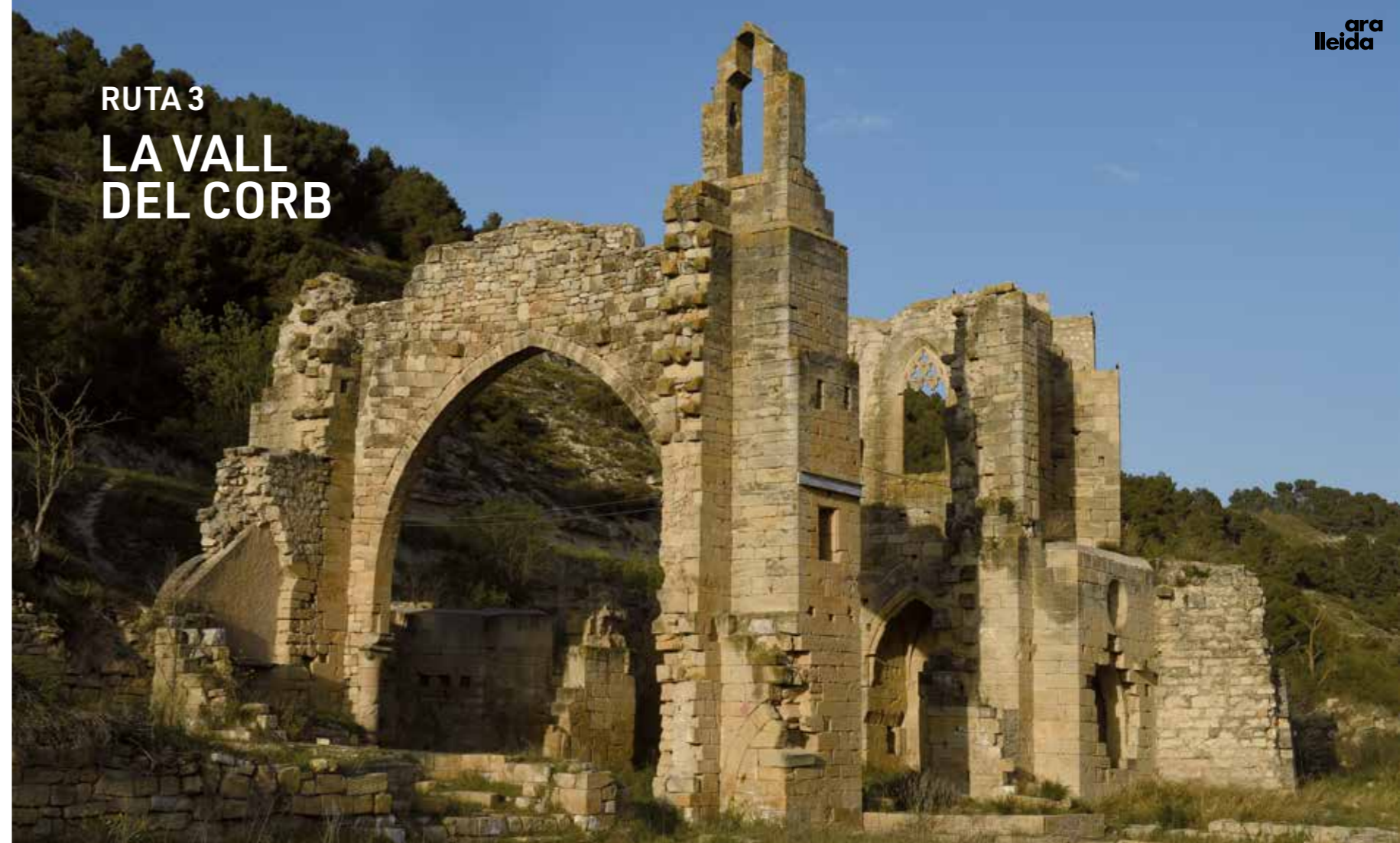
Ruïnes del convent cistercenc de Vallsanta, molt a prop de Guimerà. A sota, un terrissaire de Verdú elaborant els famosos "sillons" negres.

De la vall del Corb l'escriptor Josep Vallverdú, amb arrels a Sant Martí de Maldà, en parlava així: "Aquesta vall la banya un riu petit i juganer, el Corb, i la ventila un vent que ve de lluny, la marinada. (...) La història l'expliquen les parets de pedra seca, torres, cabanes, vells molins, esglésies i castells".