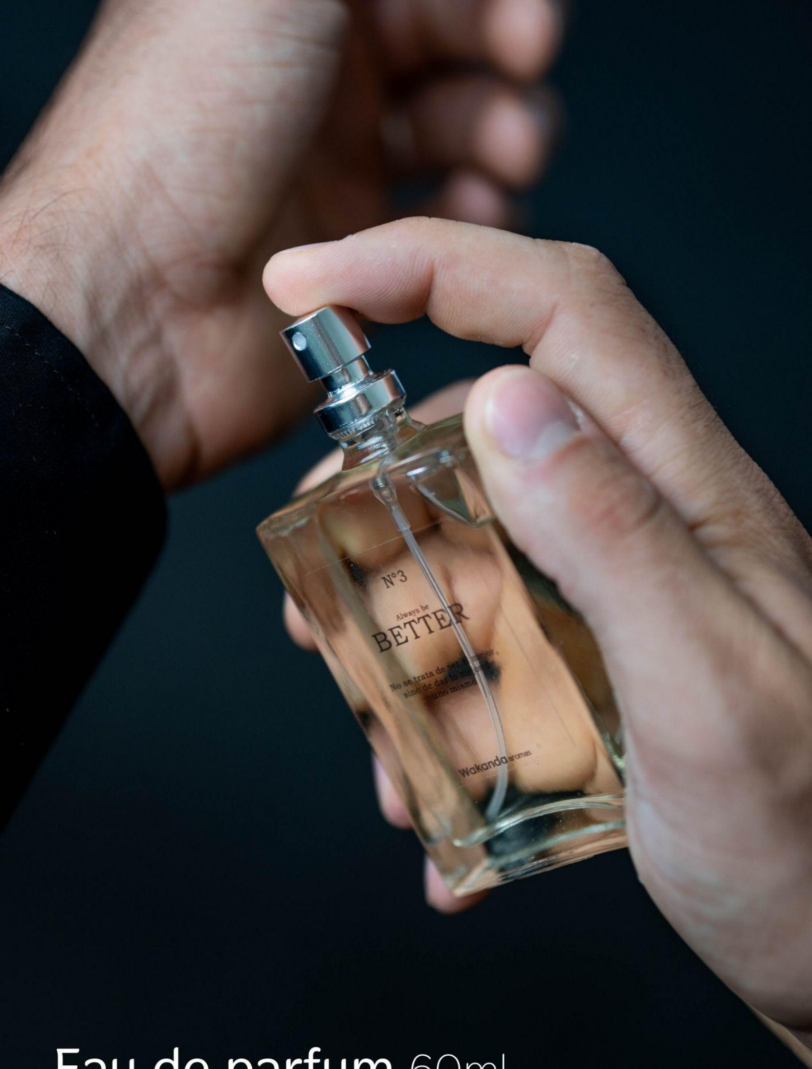
Eau de parfum 60ml.