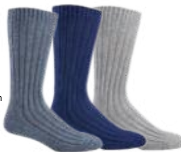
D10 Combinaison bleu / gris