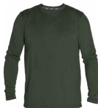
440 alpin Vert