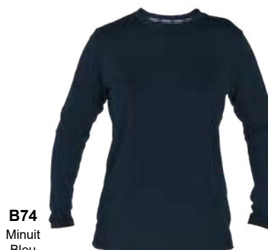
B74 Minuit Bleu