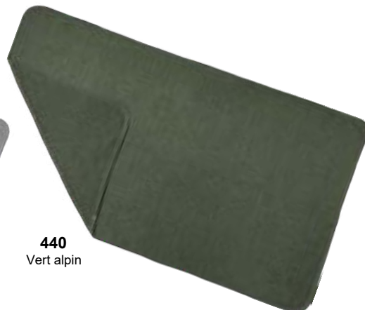
440 Vert alpin