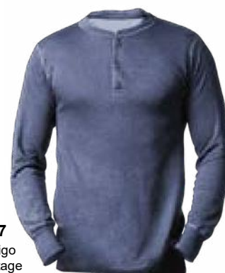
377 Indigo vintage