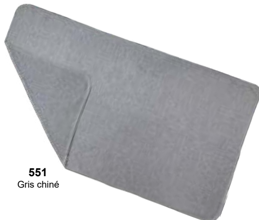
551 Gris chiné