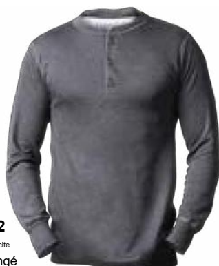
572 Anthracite mêlé