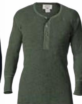
440 Vert alpin