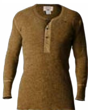
D04 Rayonde miel