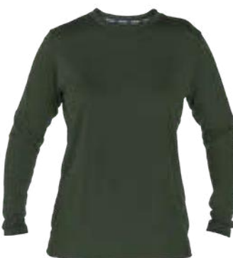
440 alpin Vert