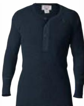
B74 Bleu nuit