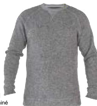
551 Gris chiné