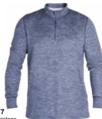
377 Indigo vintage