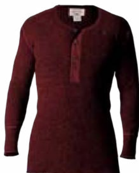
D25 Bois de rose

ST1328U COULEURS, D25, D04, D49 – DISPONIBLE 15 SEPTEMBRE 2026 :