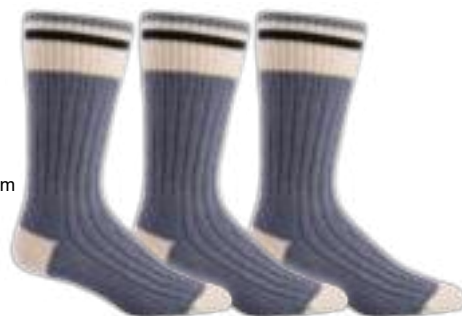
850 Brume denim