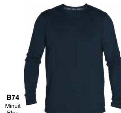
B74 Minuit Bleu