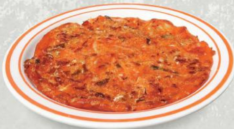
45. 바삭김치전 $6 Crispy kimchi pancake