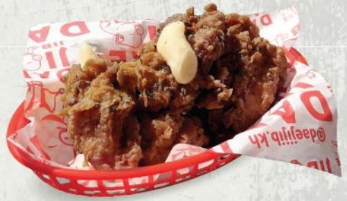
43. 허니간장치킨 $8 Honey soy chicken