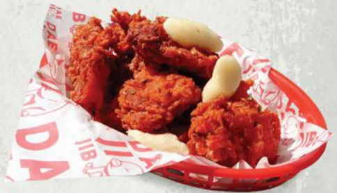
42. 불닭매콤치킨 $8 Buldak spicy chicken

일반 치킨 별도 요청 Request Normal chicken available