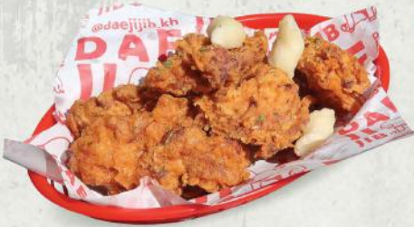
40. 김치치킨 $7 Kimchi chicken