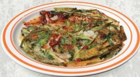
44. 해물 파전 $7.5 Seafood green pancake