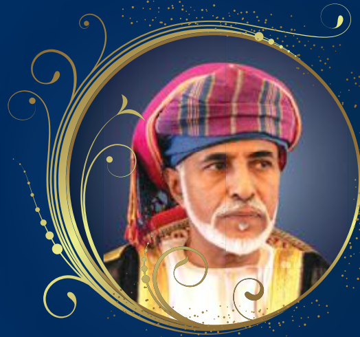
صاحب الجلالة السلطان