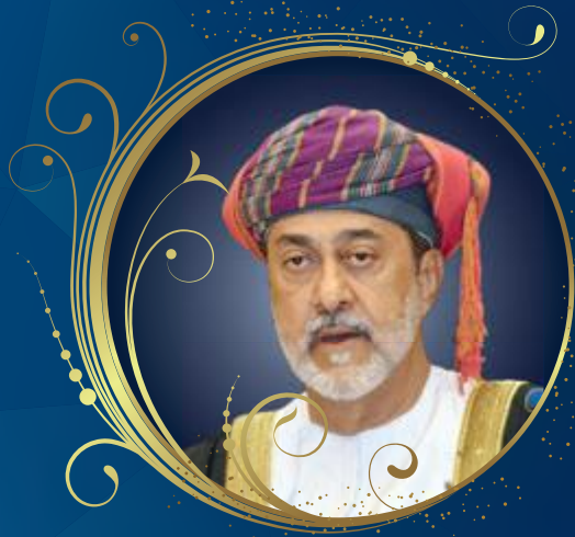
حضرة صاحب الجلالة السلطان