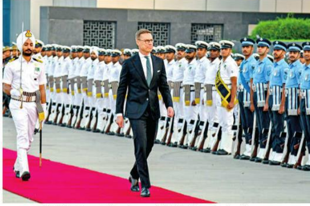
தில்லியில் உள்ள பரஸ் விமலாபலம் தளத்தில் வீச்சுள்ள குளிப்பெடுப்பு மரியாதையை ஏற்றுக்கொண்ட பின்லாந்து அதிபர் அலெக்ஸாண்டர் ஸ்டீப்.

தில்லியில் சுந்தர் மாதம் நடைபெற்ற சர்வதேச செயற்கை நுண்ணிறவு (எஃப்.தாக்க உச்சி மாநாட்டில் பங்கேற்றிருந்த அலெக்ஸாண்டர், சில வாரங்களுக்குள் மீண்டும் இந்தியப் பயணம் மேற்கொண்டுள்ளார். அவருடன் அந்தாட்டு அமைச்சர்கள், உயரதிகாரிகள் மற்றும் தொழில் உதவிகள் உரையையும் அனுமதிக்கின்றனர்.