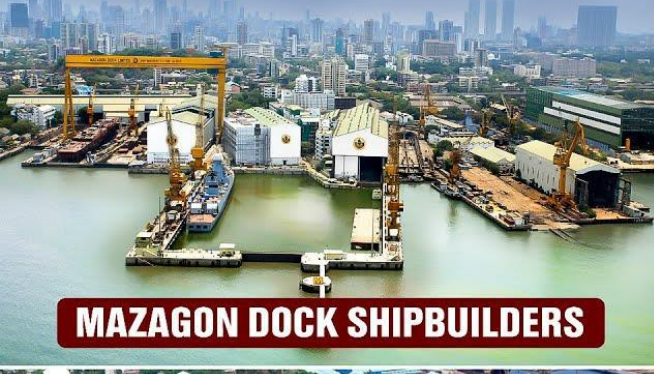
MAZAGON DOCK SHIPBUILDERS