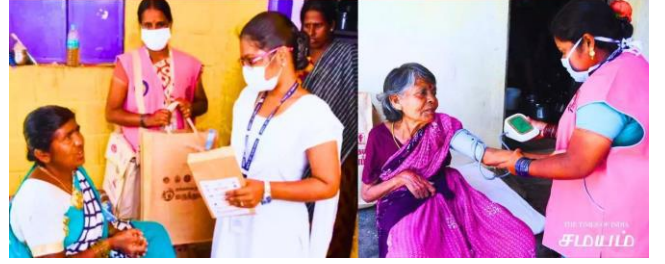
Makkalai Thedi Maruthuvam scheme was launched on August 5, 2021 in Samanapalli.

வீடு தேடி வரும் மருத்துவம் மக்களை தேடி மருத்துவம் திட்டம்