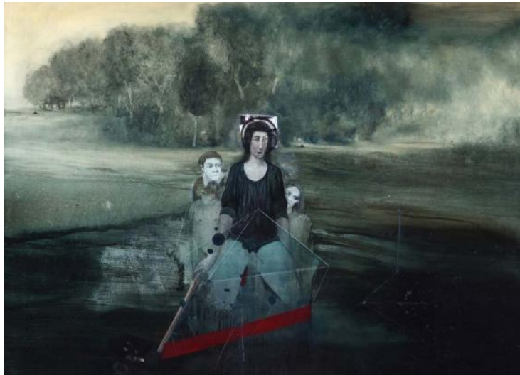
İstanbul Resim ve Heykel Müzesi Koleksiyonu

Fransa'da sitüasyonistlerle, varoluşçularla, Markistlerle ve sürrealist yazarlarla hep bir bağı olmuştur. Hayatının son döneminde genç sanatçılara olan ilgisi ve desteği çok değerliydi."