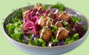
6060651 STABBURET VEGETAR FALAFEL 8 G