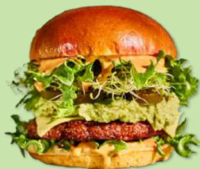
5501846 STABBURET VEGETAR BURGER 150 G