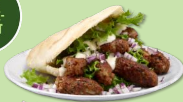
6350433 STABBURET VEGETAR FARSE FORMBAR 3 KG