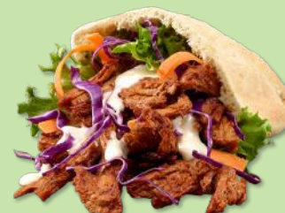
6350458 STABBURET VEGETAR PULLED 3 KG