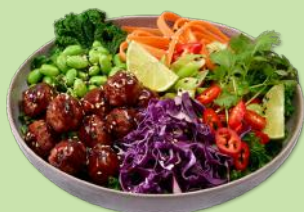
5658729 STABBURET VEGETAR BOLLER 12 G