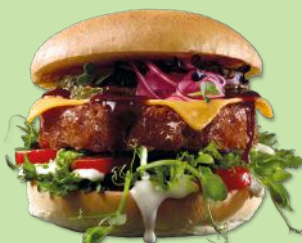
5624846 STABBURET VEGETAR STEKT BURGER 112 G