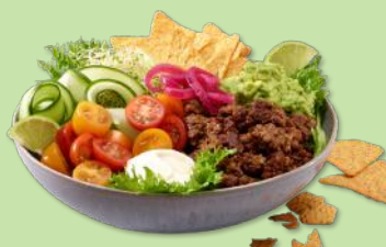
6350383 STABBURET VEGETAR FARSE 3 KG