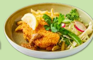
6060347 STABBURET VEGETAR SCHNITZEL 80 G