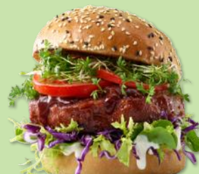
5742549 STABBURET VEGETAR FAVA BURGER 150 G