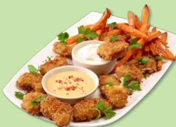
5658737 STABBURET VEGETAR NUGGETS 23 G