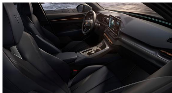
↑ SEDILI SPORTIVI A GUSCIO CUPRA BUCKET IN TESSILE «DEEP OCEAN» «SEAQUAL®»