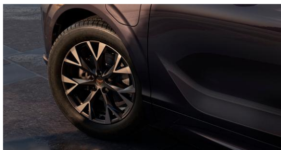
↑ CERCHIONI IN LEGA 8J X 18", «ATOMIC» MACHINED IN SPORT BLACK MATT (235/55 R18)