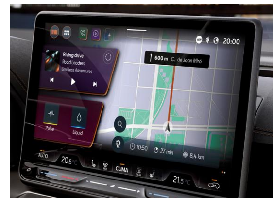
↑ SISTEMA DI NAVIGAZIONE DA 12.9" CON CURSORE RETROILLUMINATO