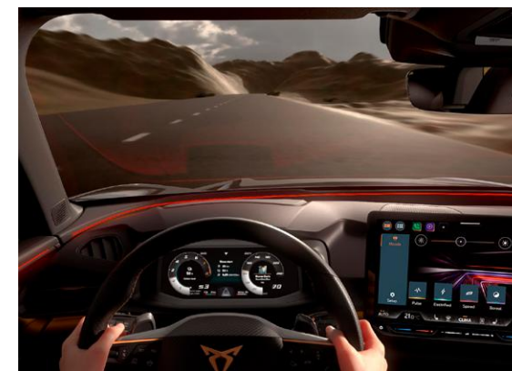
↑ ILLUMINAZIONE AMBIENTE A LED SMART WRAPAROUND, INCL. VISUALIZZAZIONE DELLE FUNZIONI