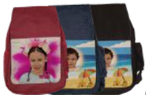
קופון לילד + חתונה