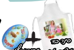
אפרון עם תמונת הילד