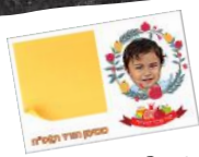
תמונת ילד עם פתקיות למנו - ילד