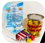
סל קונדיטוריה לילד + חתונה