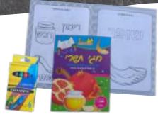
חומרי לימוד + חבילת ציורים