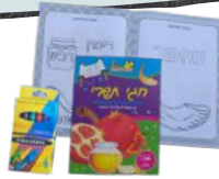
חוברת צביעה + חבילת צביעה