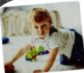
תמונת פולטא צילא A4