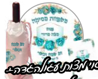
קופון לילד + חתונה