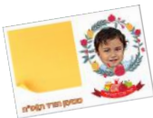
אלבום עם התקוות והחלומות