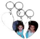
קופון אמריקאני 3 חצי אהרובס