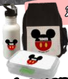
תקן בקרבוקן וקופסאות ארוז