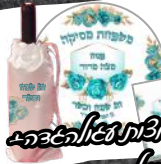
כיסוי מצבת צלילה צה"ש כיסוי לקבוקון יין