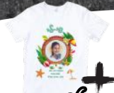
חולצה הרצוב אישי