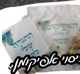
כיסוי אפיקולין הצבה בקבוקון הצה"ש