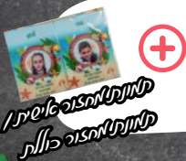
תמונות מחגוגי השנה, תמונות מחגוגי כולל