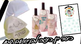
קופון לילד + חתונה