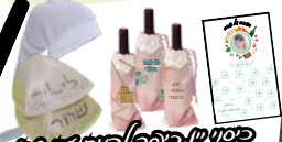
עיסה עם תמונת הילד