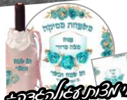
כיסוי אפיקומן, חלבון בקרבוקן