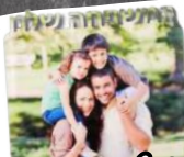
תמונה של הילדים 15*20