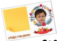
אלבום תצלומים לילד + חתונה