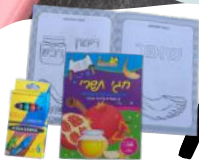
חבילת ציורים + חבילת ציורים