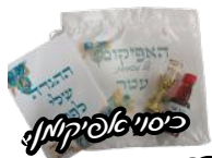
עיסה עם תמונת הילד