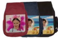
סוף השנה עם תמונת הילד