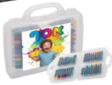
סוף השנה עם תמונת הילד