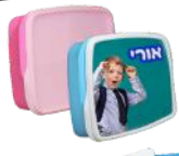
קופון לילד + חתונה