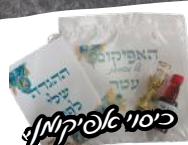
כיסוי אפיקומן, חלבון בקרבוקן, חלבון