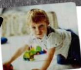
תמונה של הילד 15*20