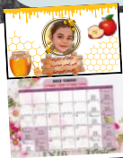
קלרובון AS הרצוב אישי ספירה