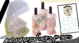
כיסוי אפיקומן, חלבון בקרבוקן, חלבון