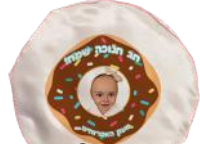
צ'קייט לילד לילד + חתונה