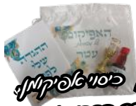
קופון לילד + חתונה