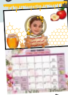
קלנדר As הציבורי עם סבילה