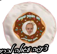
חולצה עם תמונת הילד