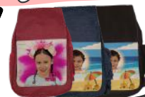
תיק תיק אן הרצוב אישי