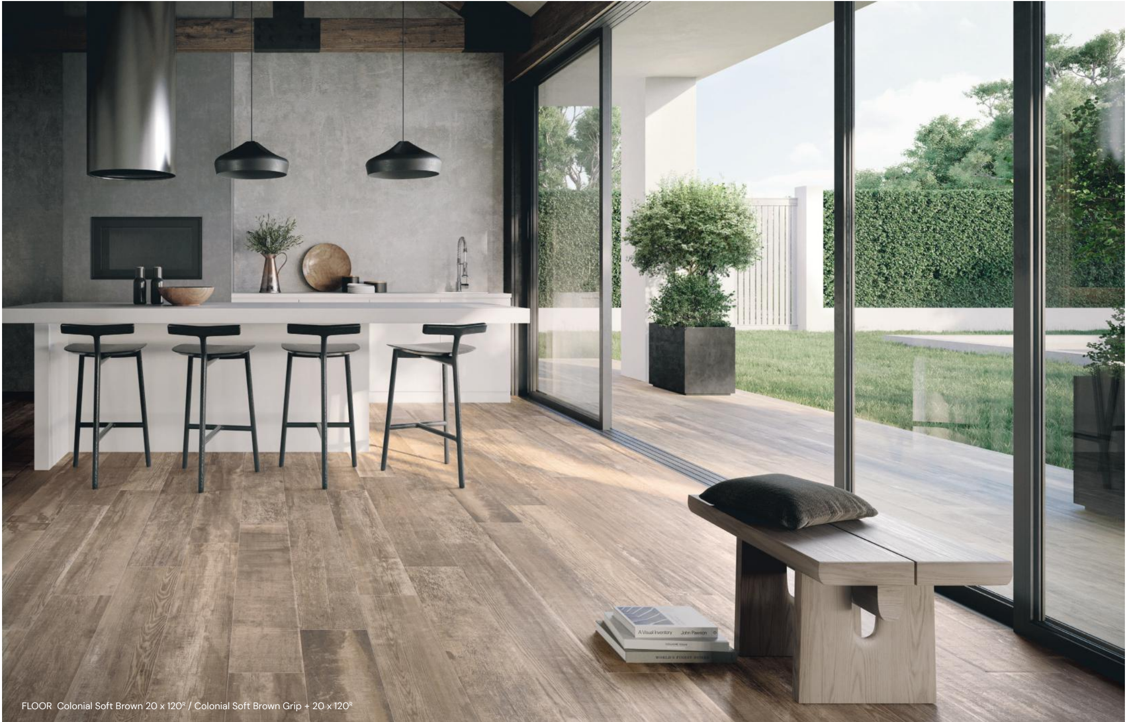
FLOOR Colonial Soft Brown 20 x 120 cm / Colonial Soft Brown Grip + 20 x 120 cm