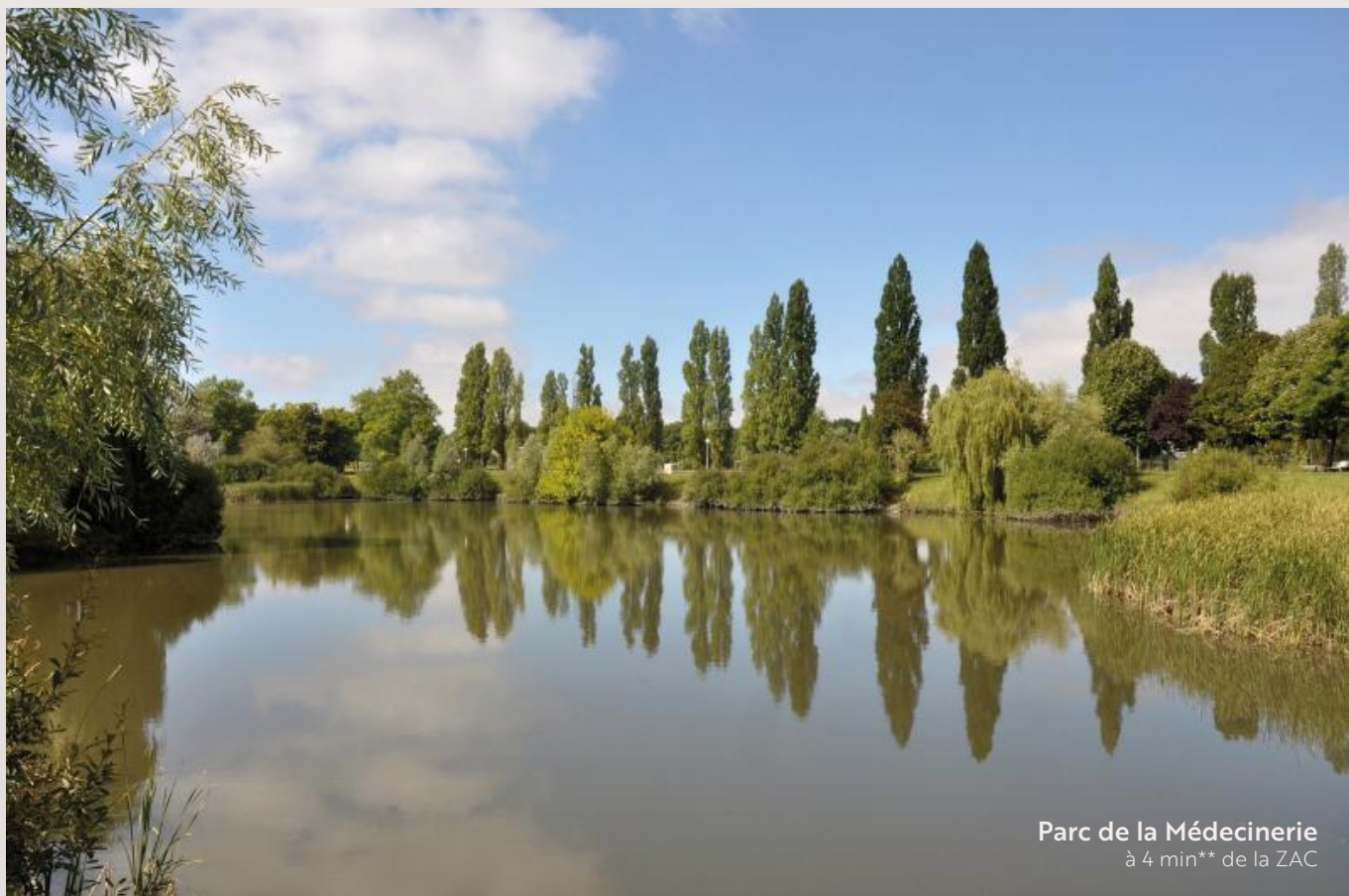
Parc de la Médecinerie à 4 min** de la ZAC

Aujourd'hui une dernière réalisation s'offre à vous au cœur de ce quartier. Une résidence de logements et de bureaux appelée Prisme.