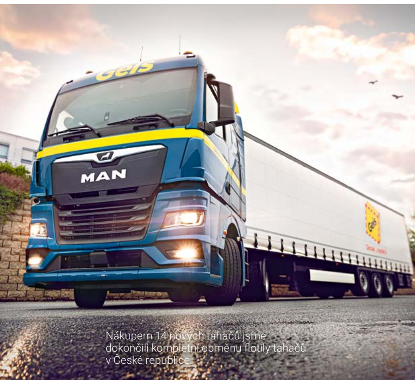
Nákupem 14 nových tahačů jsme dokončili kompletní obměnu flotily tahačů v České republice.

Také letos pokračujeme v modernizaci. Investovali jsme do bezmála 30 nových návěsů. Tyto moderní přípojné vozy také kontinuálně obměňujeme, aby splňovaly nejnovější standardy.