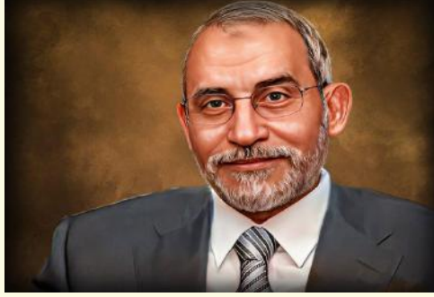
فضيلة المرشد العام الدكتور محمد بديع