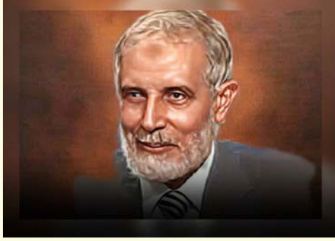
الدكتور محمود عزت نائب فضيلة المرشد العام