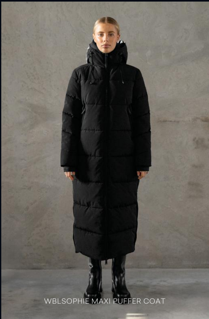
WBL SOPHIE MAXI PUFFER COAT