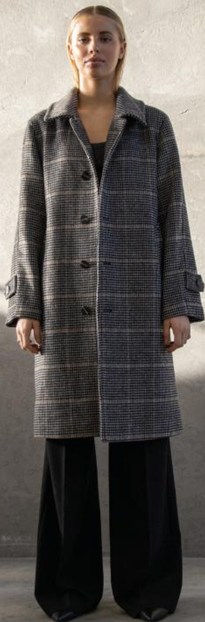
WBLJULIETTE TAILORED WOOL COAT