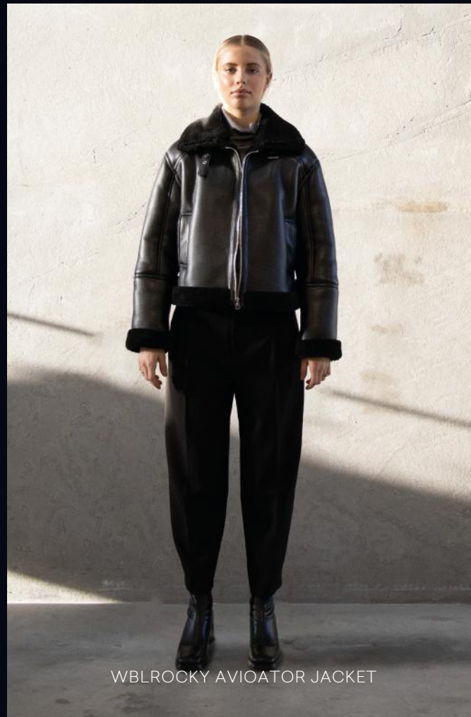
WBLROCKY AVIATOR JACKET