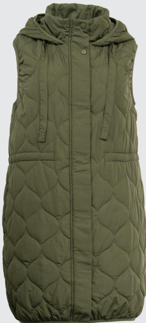
GRAPE LEAF GREEN