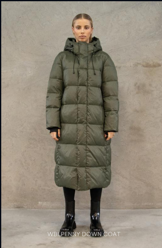
WBLPENNY DOWN COAT