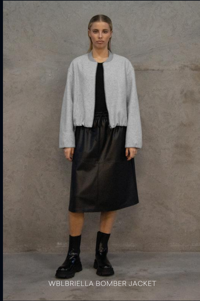
WBLBRIELLA BOMBER JACKET