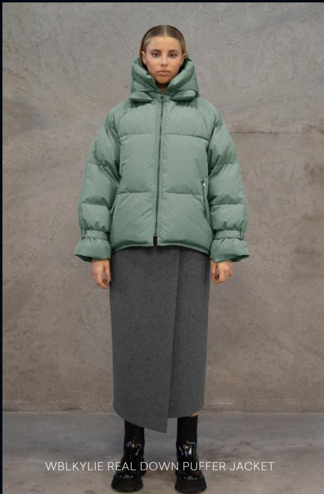
WBLKYLIE REAL DOWN PUFFER JACKET