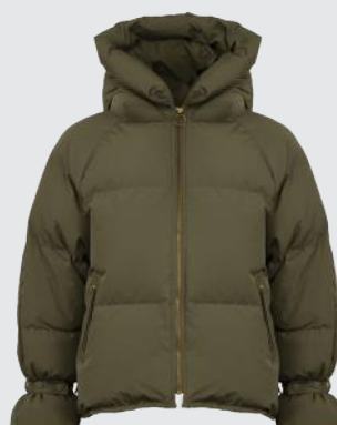
GRAPE LEAF GREEN