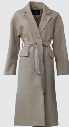
MOON ROCK BROWN