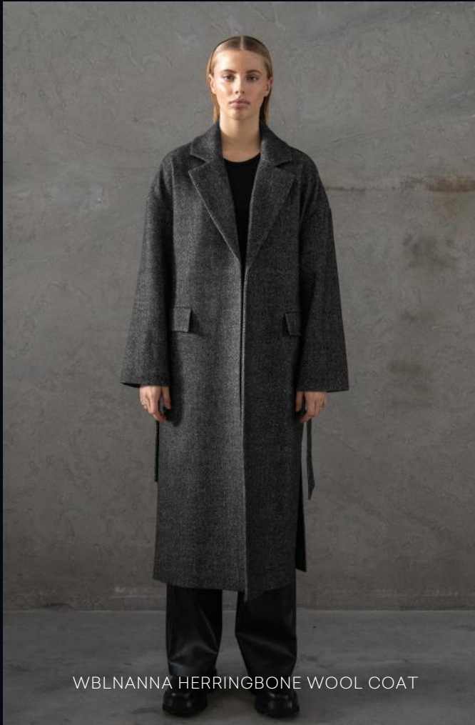
WBLNANNA HERRINGBONE WOOL COAT