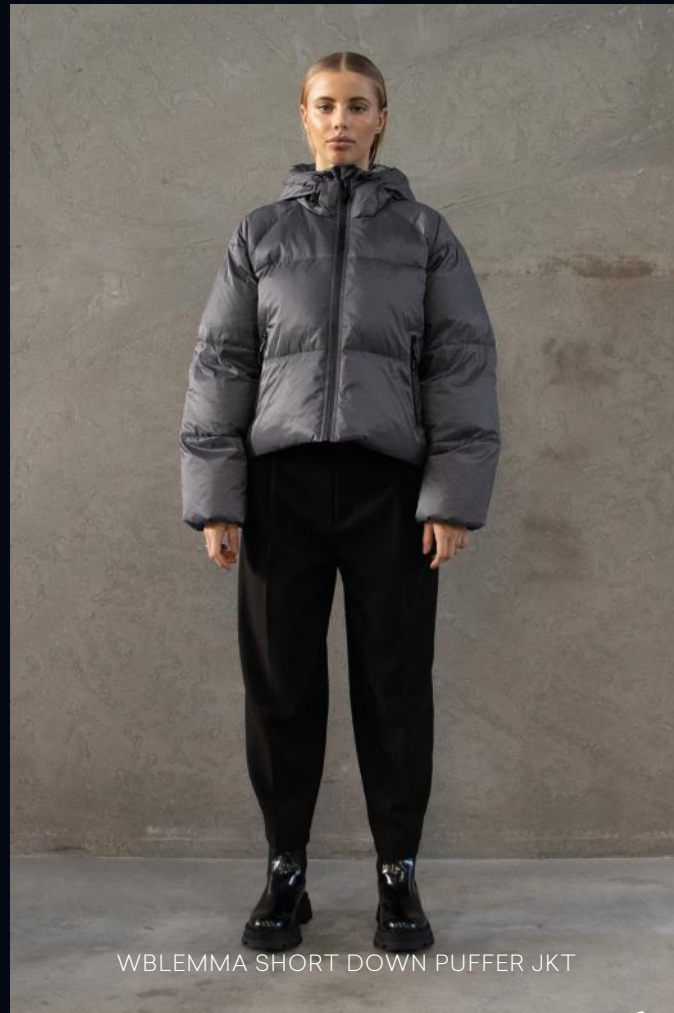
WBLEMMA SHORT DOWN PUFFER JKT