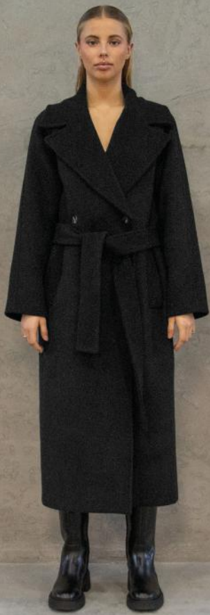
WBLBROOKLYN WOOL COAT