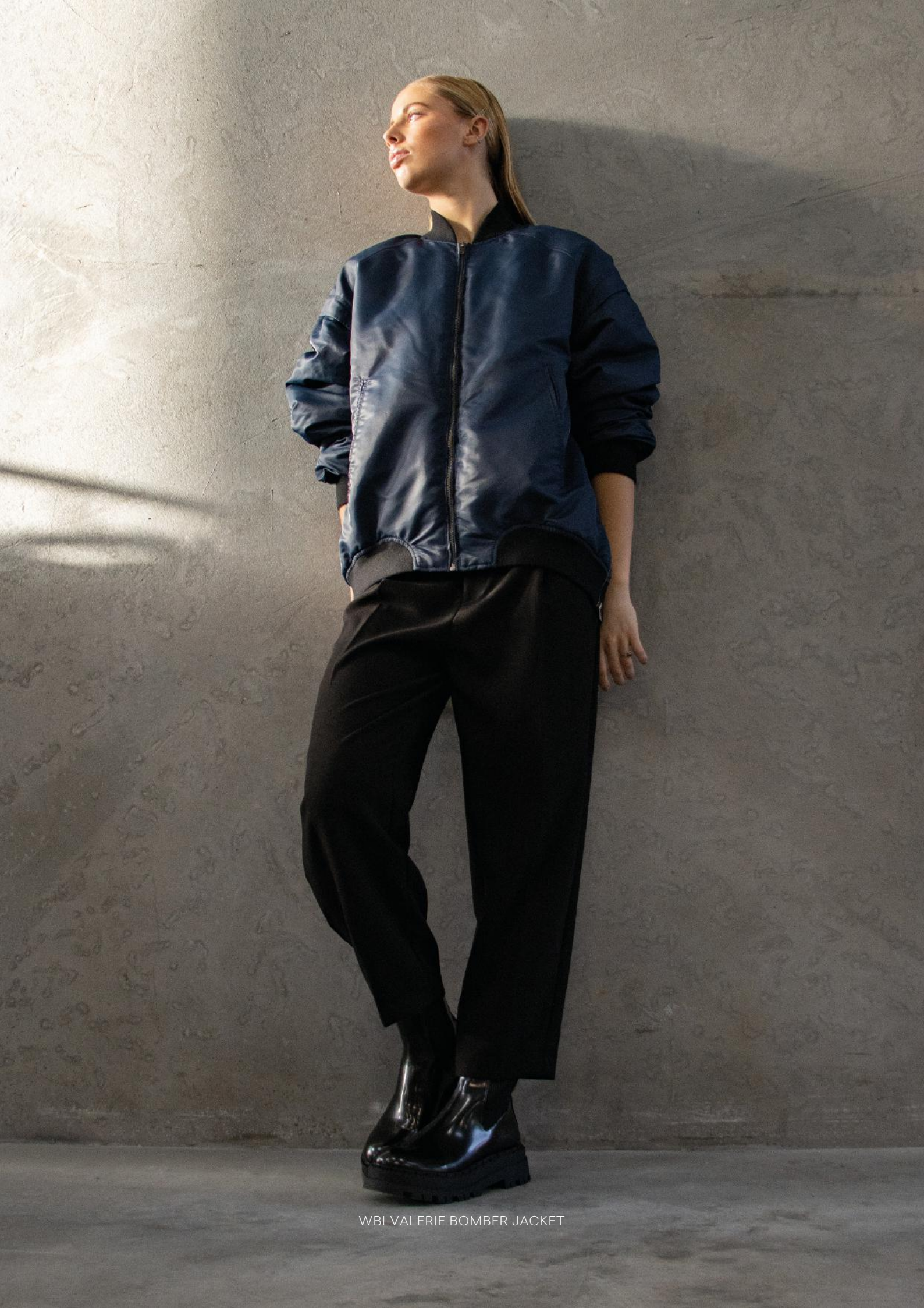
WBLVALERIE BOMBER JACKET