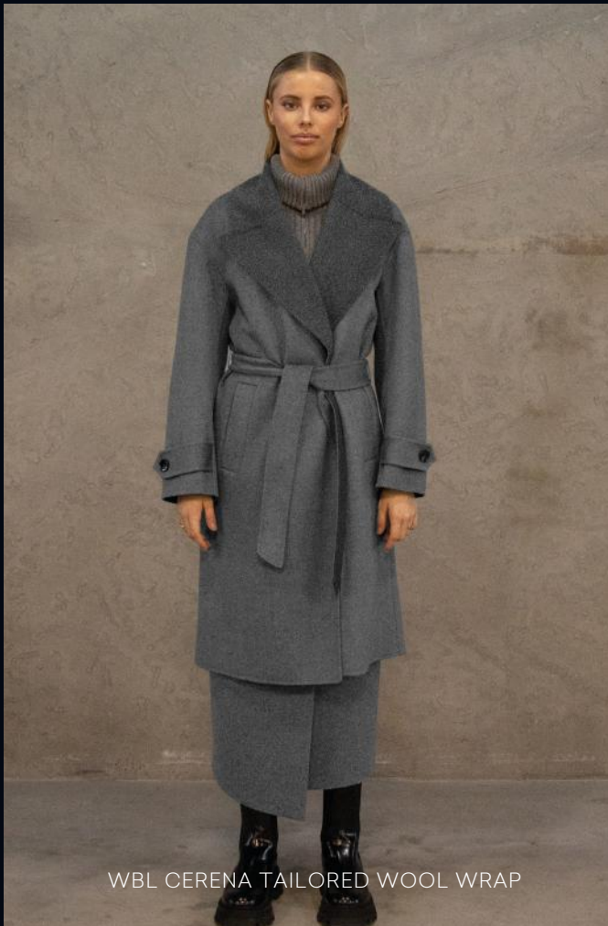
WBL CERENA TAILORED WOOL WRAP