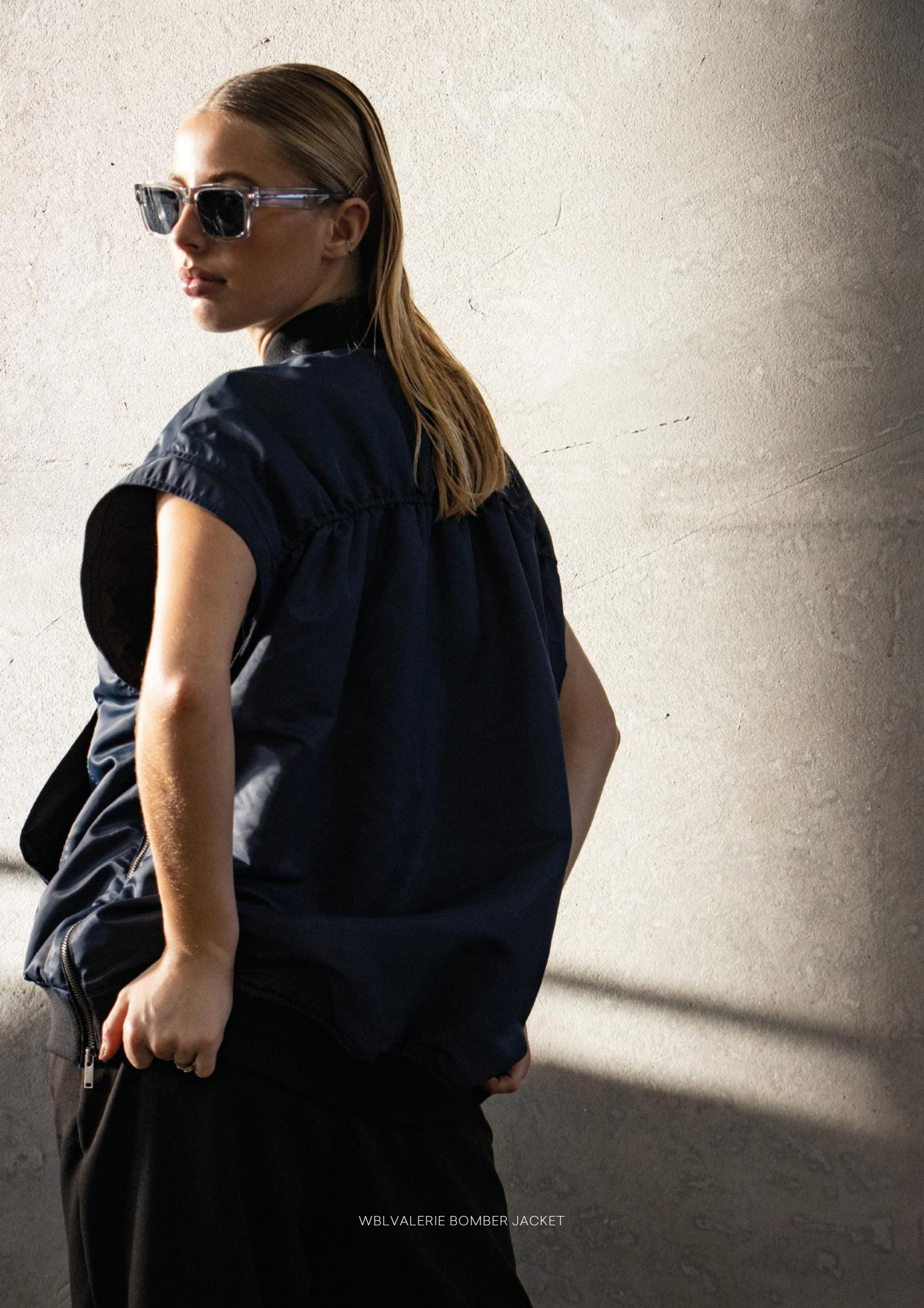
WBLVALERIE BOMBER JACKET