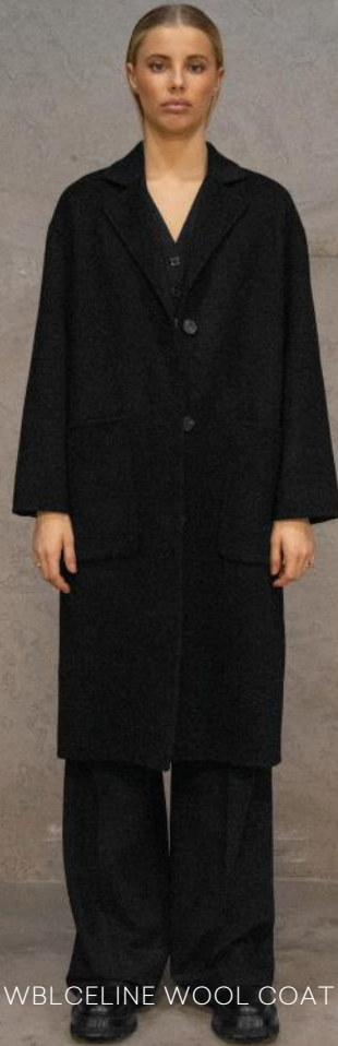
WBLCELINE WOOL COAT