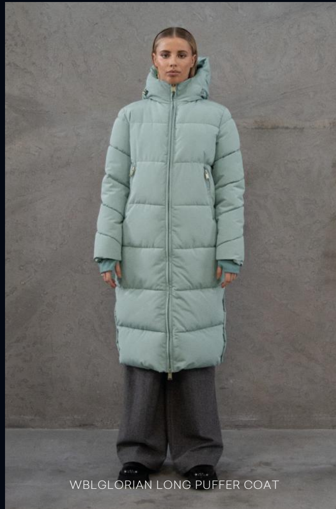
WBLGLORIAN LONG PUFFER COAT