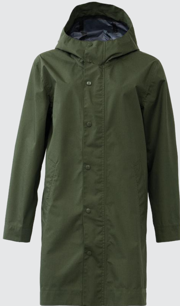
GRAPE LEAF GREEN