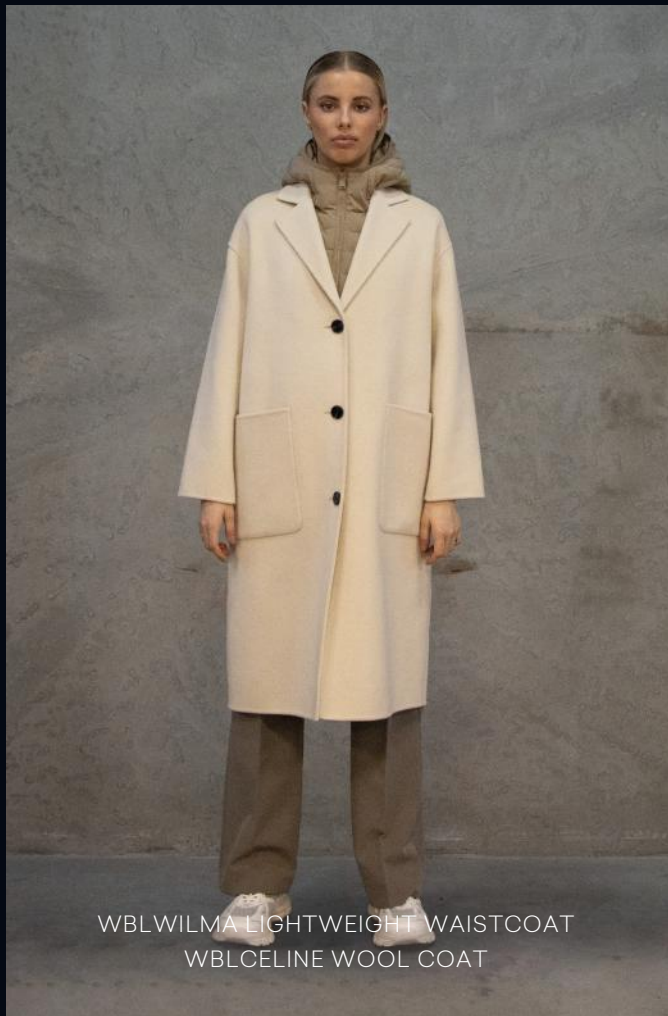
WBLWILMA LIGHTWEIGHT WAISTCOAT WBLCELINE WOOL COAT