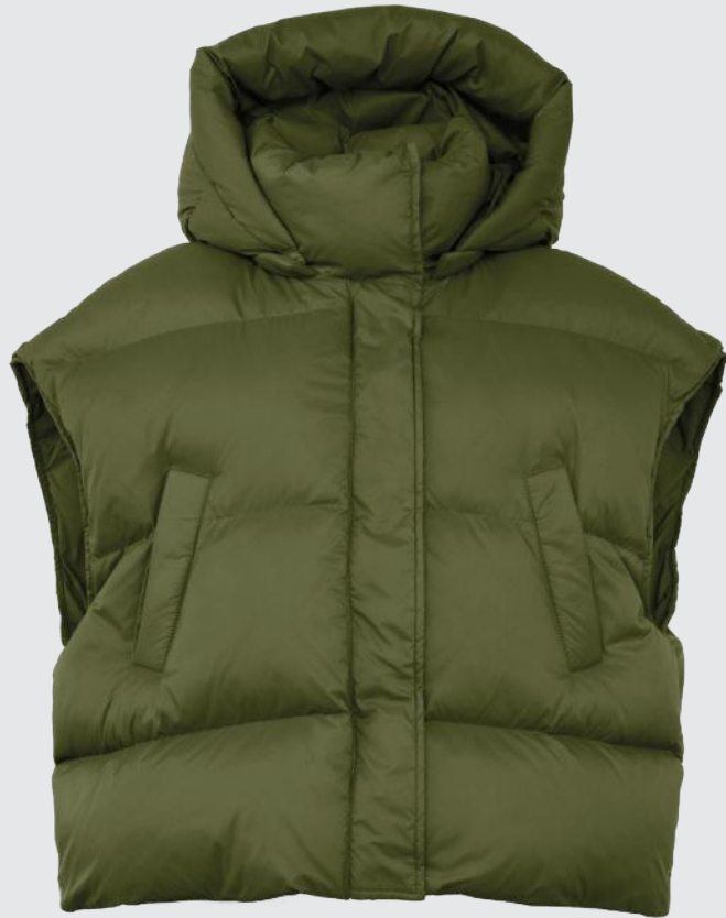
GRAPE LEAF GREEN