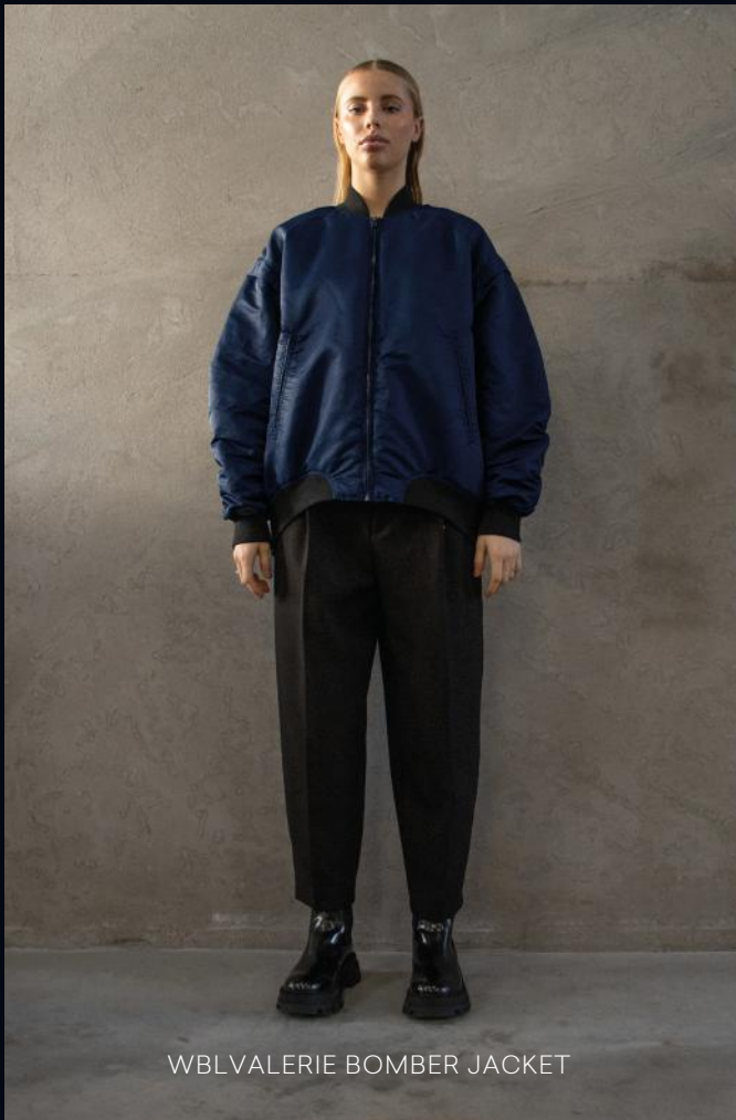
WBL VALERIE BOMBER JACKET