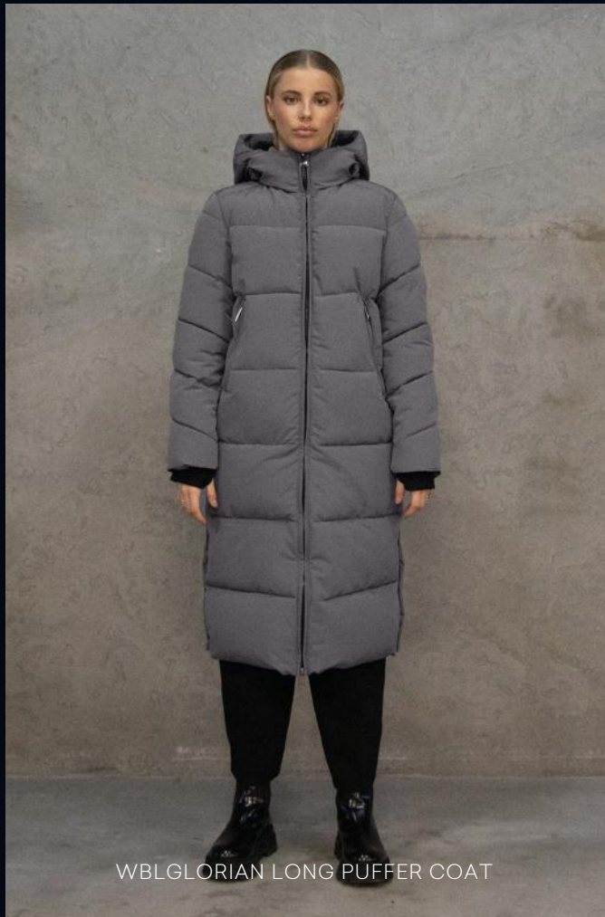
WBLGLORIAN LONG PUFFER COAT