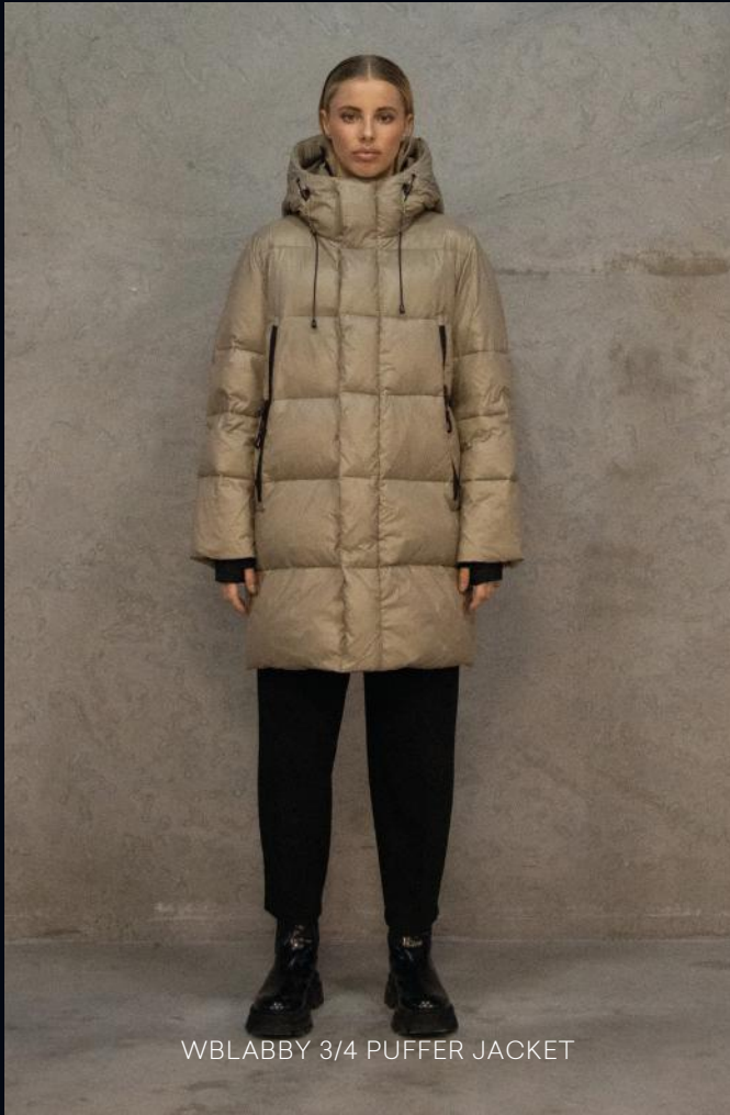
WBLABBY 3/4 PUFFER JACKET