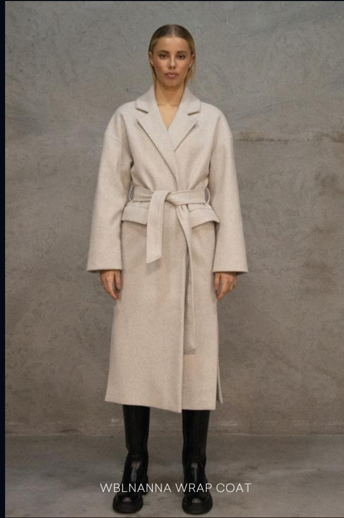
WBLNANNA WRAP COAT