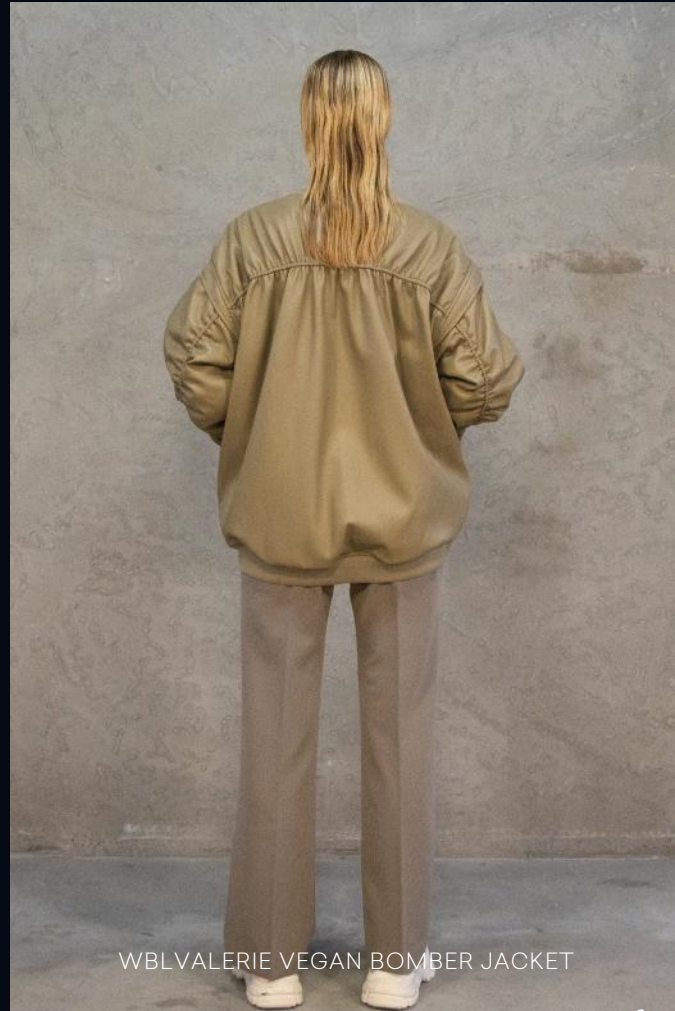
WBLVALERIE VEGAN BOMBER JACKET