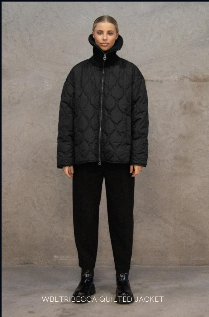
WBL TRIBECCA QUILTED JACKET