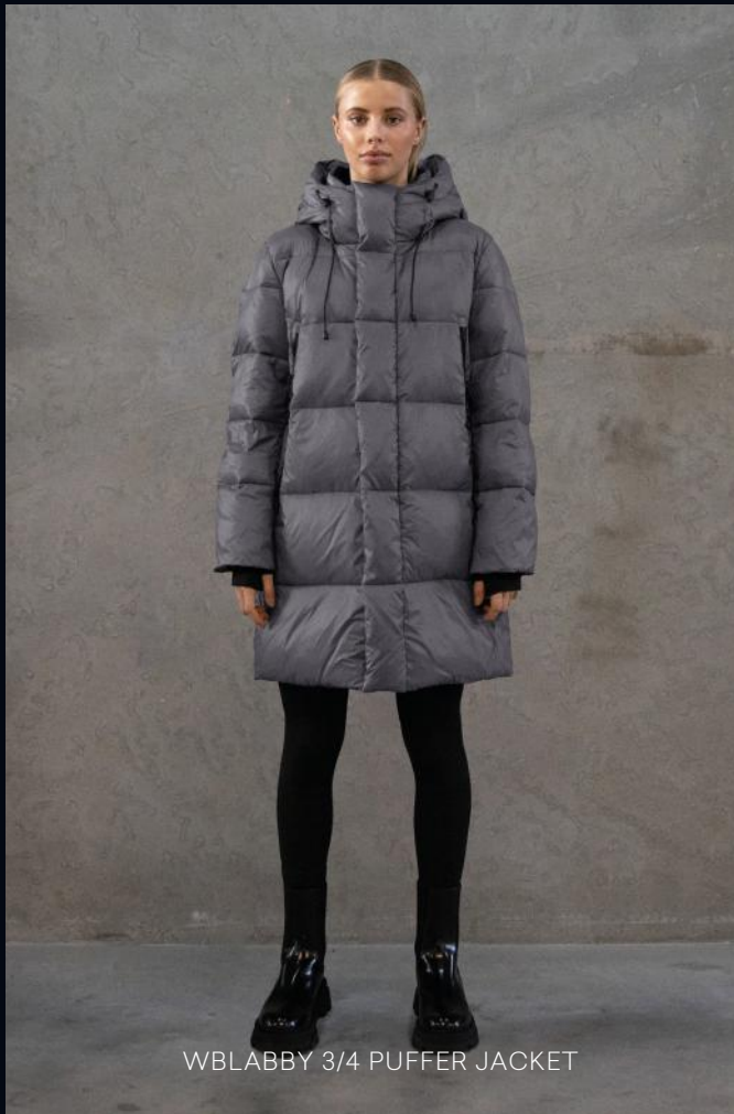
WBLABBY 3/4 PUFFER JACKET