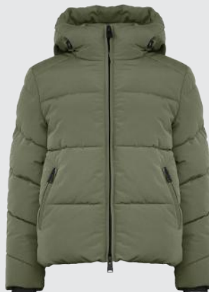
GRAPE LEAF GREEN