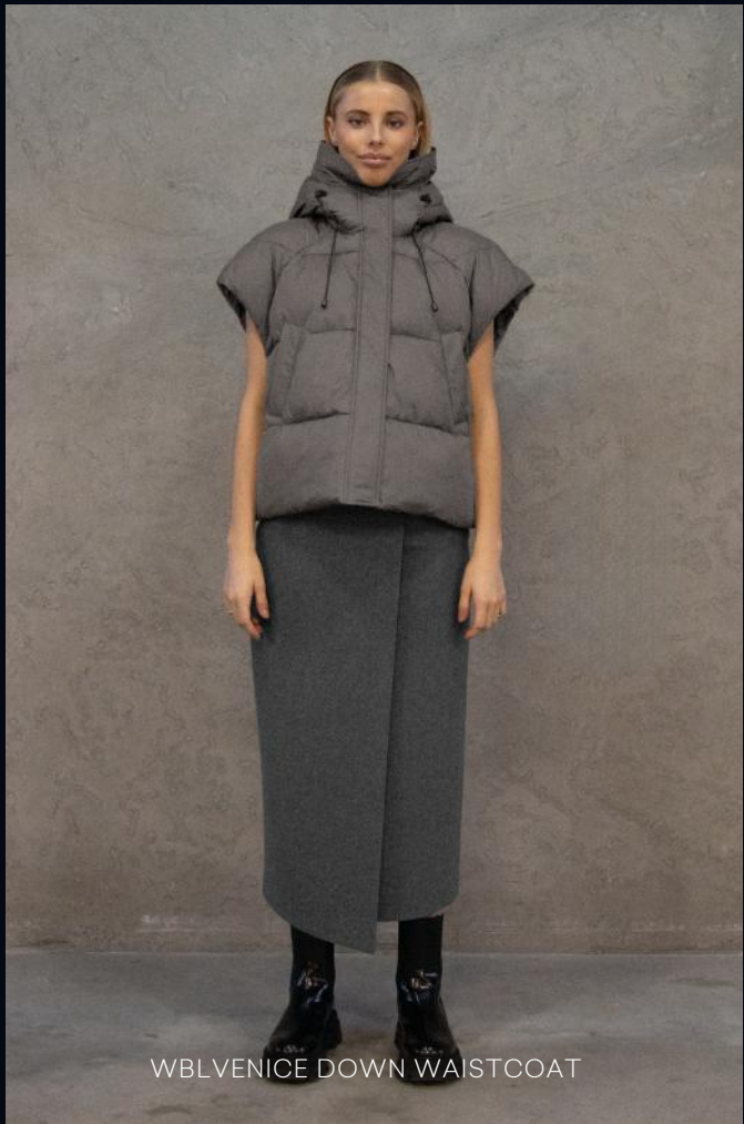
WBL VENICE DOWN WAISTCOAT