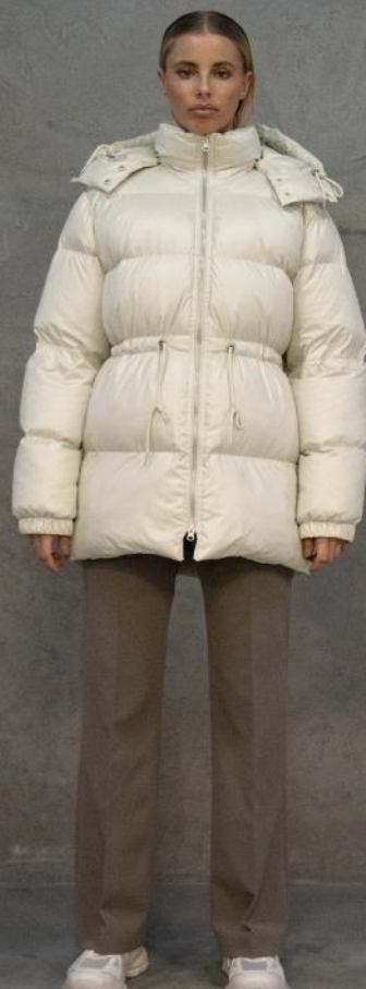
WBLMIA DOWN PUFFER JACKET