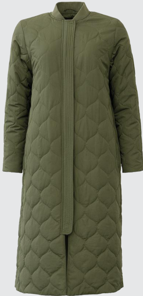
GRAPE LEAF GREEN