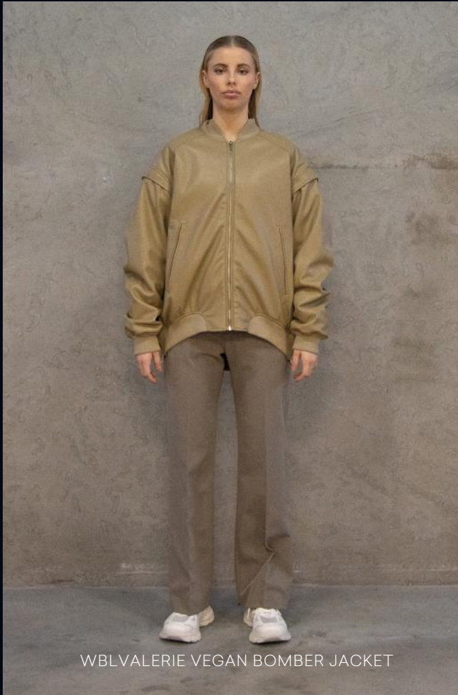
WBLVALERIE VEGAN BOMBER JACKET