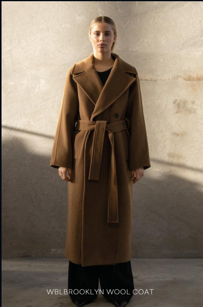
WBLBROOKLYN WOOL COAT