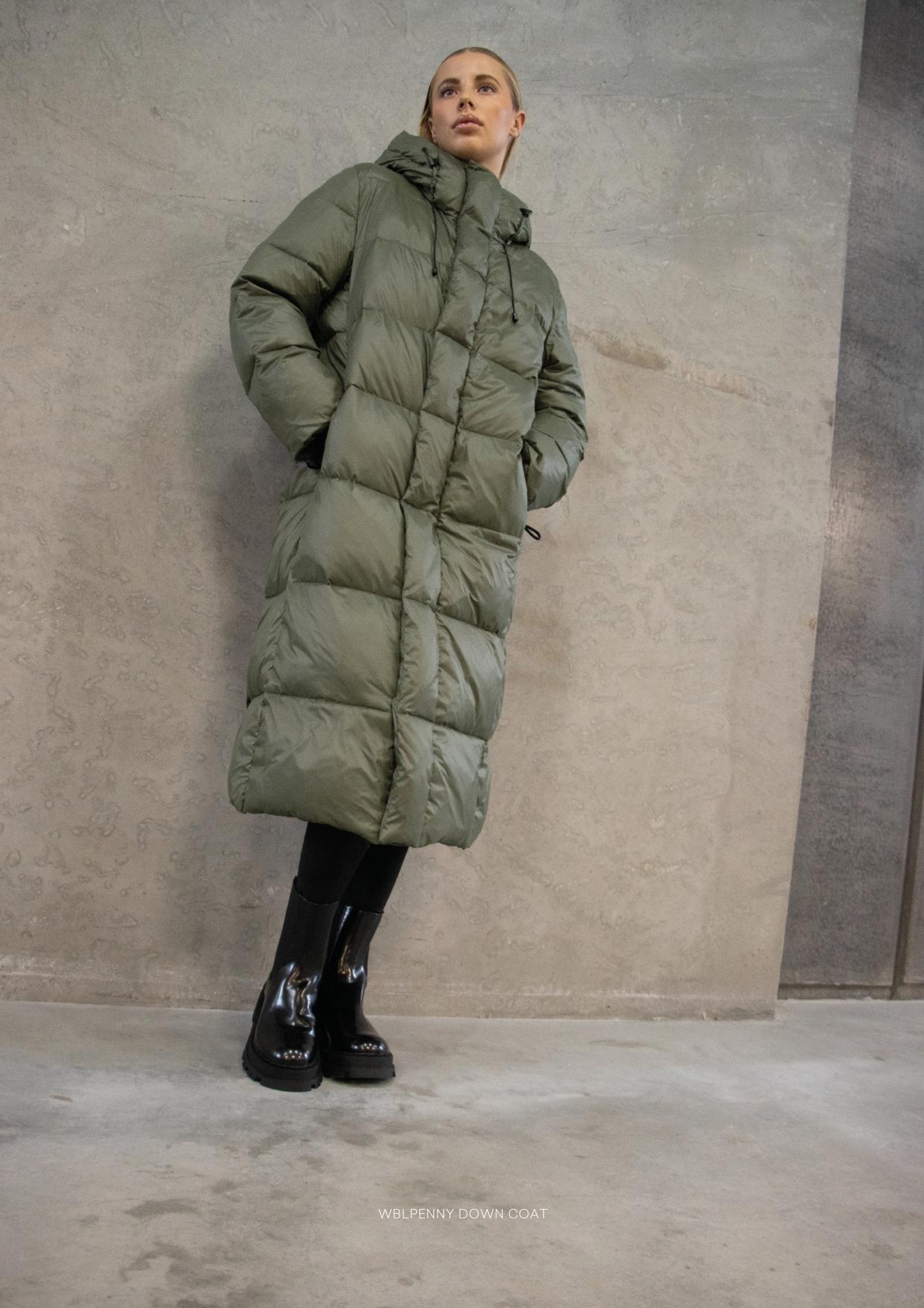
WBLPENNY DOWN COAT