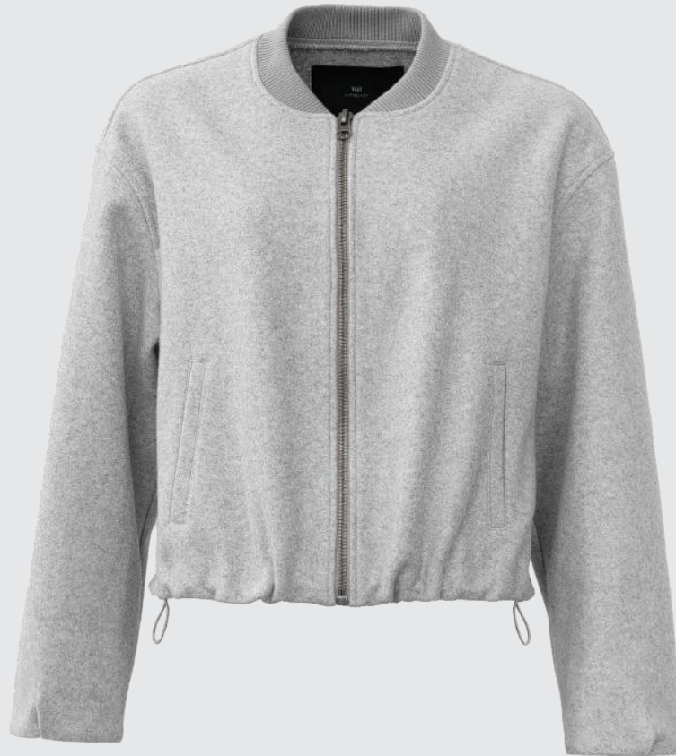
LIGHT GREY MELANGE