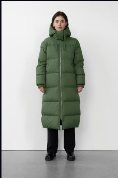
WBLALICE PUFFER COAT €149,99