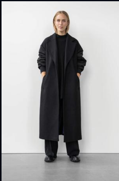
WBLARCADIA WOOL COAT €149,99