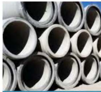
TUYAU VIBRE ARME AL 1000:1M