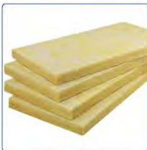
LAINES DE VERRE GLASSROCK