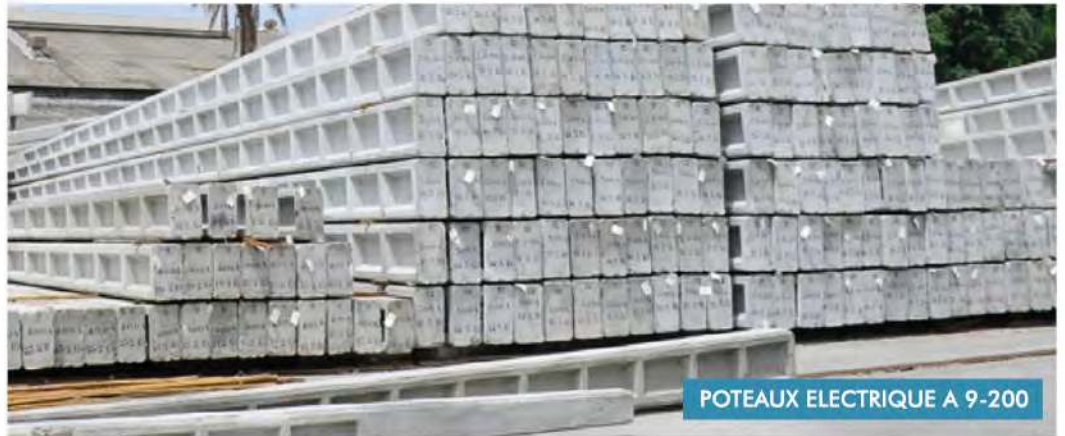
POTEAUX ELECTRIQUE A 9-200