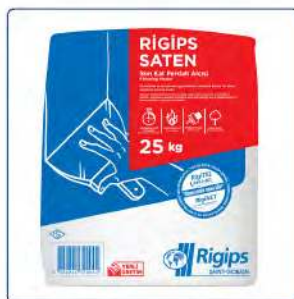
ENDUIT DE FINITION SATIN

📍 Marcory Zone 4C, Rue du Docteur Blanchard Villa n° 40 Parcelle 59 07 87 76 06 01 07 67 508 730 📍 Abatta 07 99 141 095