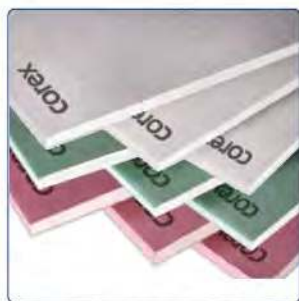
PLAQUE DE PLÂTRE DALSAN COREX