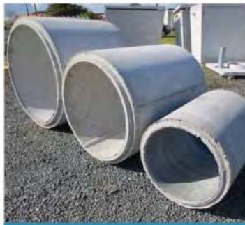
TUYAU VIBRE ARME AL 800:1M