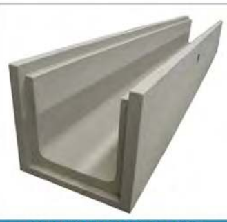
CANIVEAUX 40x40x200 CANIVEAUX 50x50x200