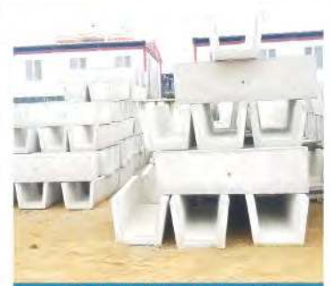
CANIVEAUX 60x60x200 CANIVEAUX 80x80x200