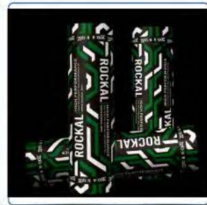
MEMBRANE D'ÉTANCHÉITÉ ROCKAL