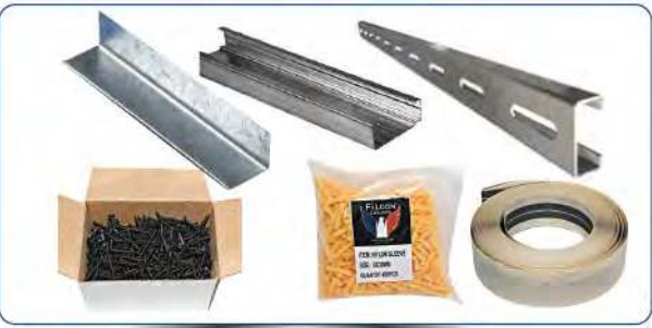
RAILS - CORNIÈRES - FOURRUES JOINTS ADHESIVES - CHEVILLES - VIS...