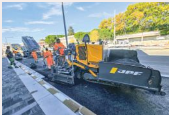
2X F1250CS PLUS 1X CC1100C VI