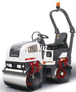
DYNAPAC CC900 PLUS Tandemwalze 1.6 t Arbeitsbreite 900 mm