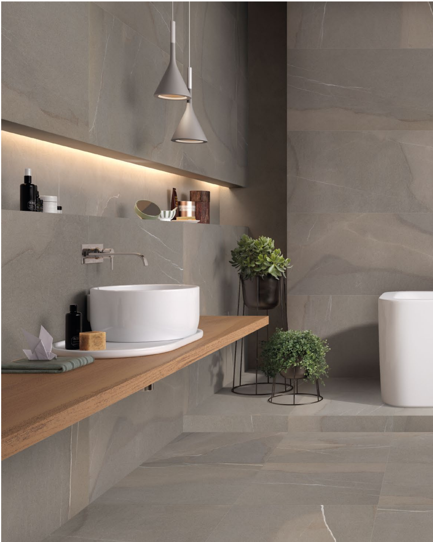
Spazzolata Nat. Rett. 60x120 - 23 5 / 8 "x47 1 / 4 " Spazzolata Nat. Rett. 60x60 - 23 5 / 8 "x23 5 / 8 "