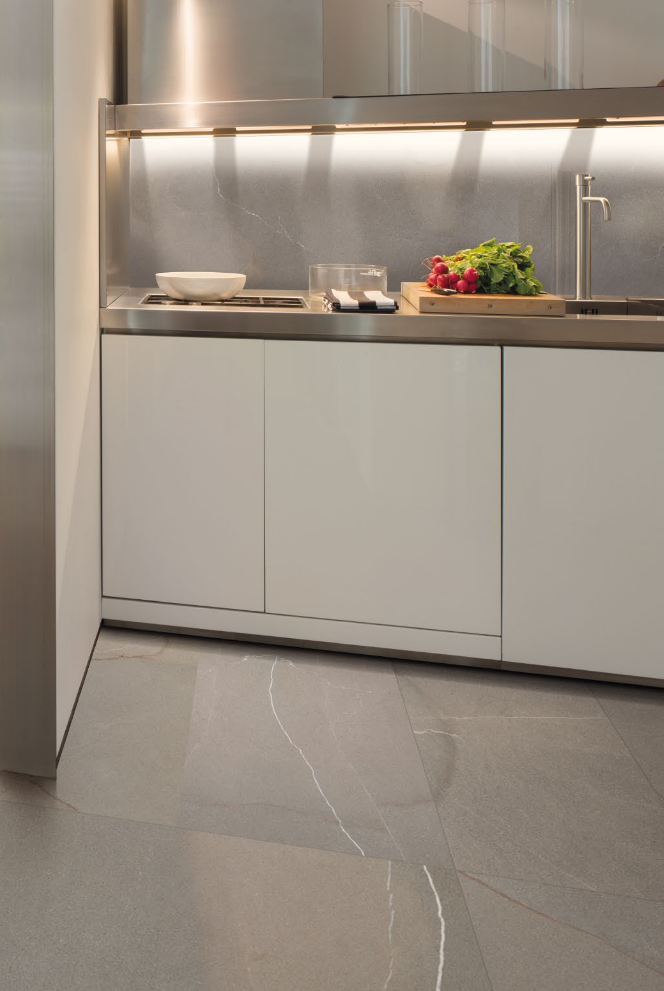
Spazzolata Nat. Rett. 60x120 - 23 5/8 x 47 1/4 "