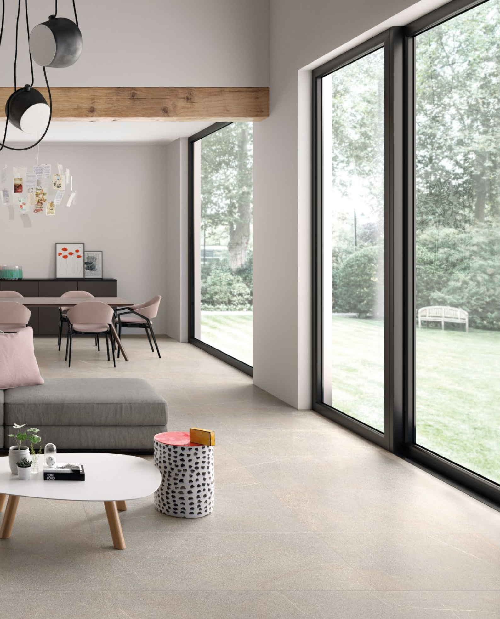
Fiammata Nat. Rett. 60x120 - 23 5/8 "x47 1/4 "