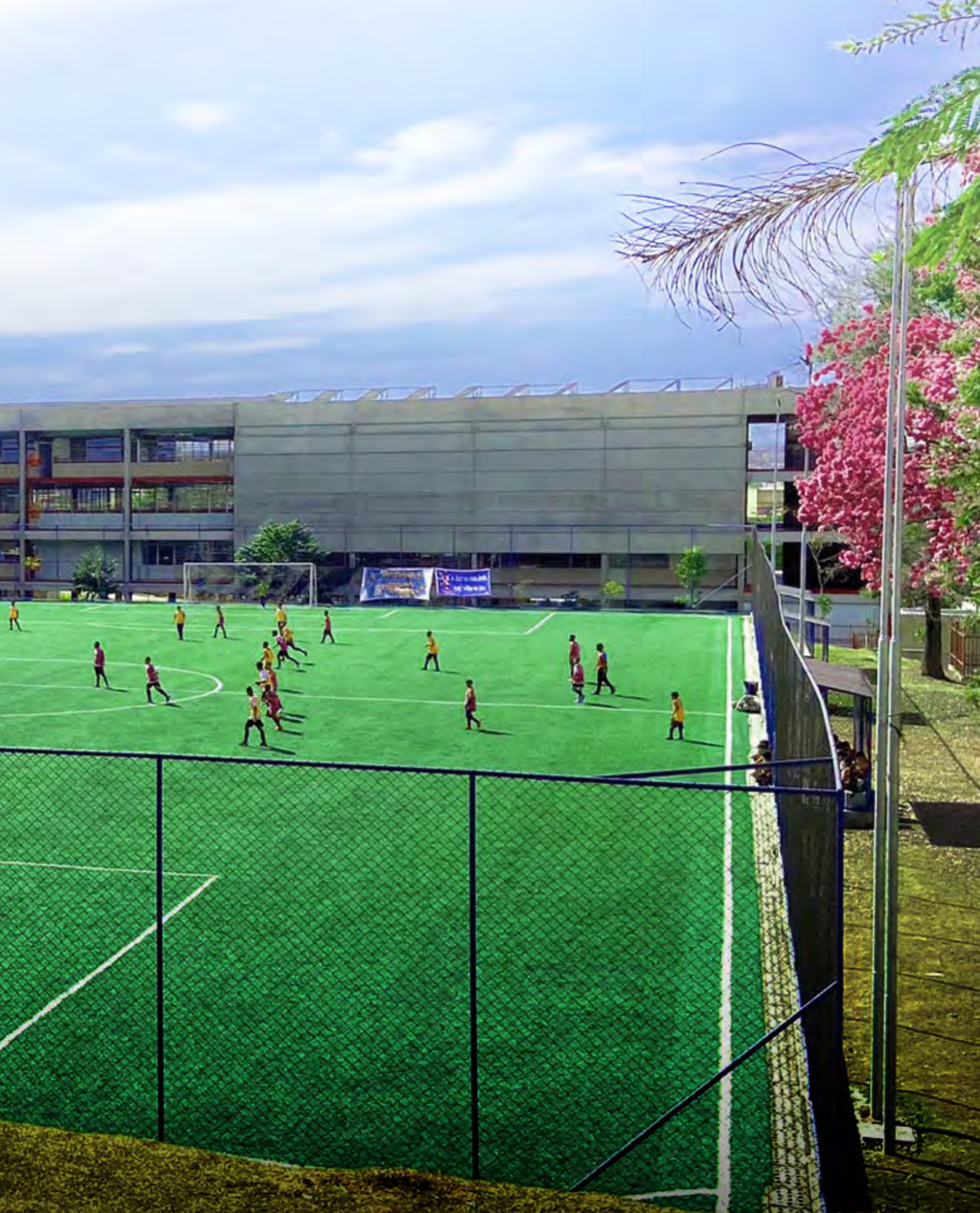
Campo de futebol do CEU São Pedro / José Bonifácio - Dragão do Mar