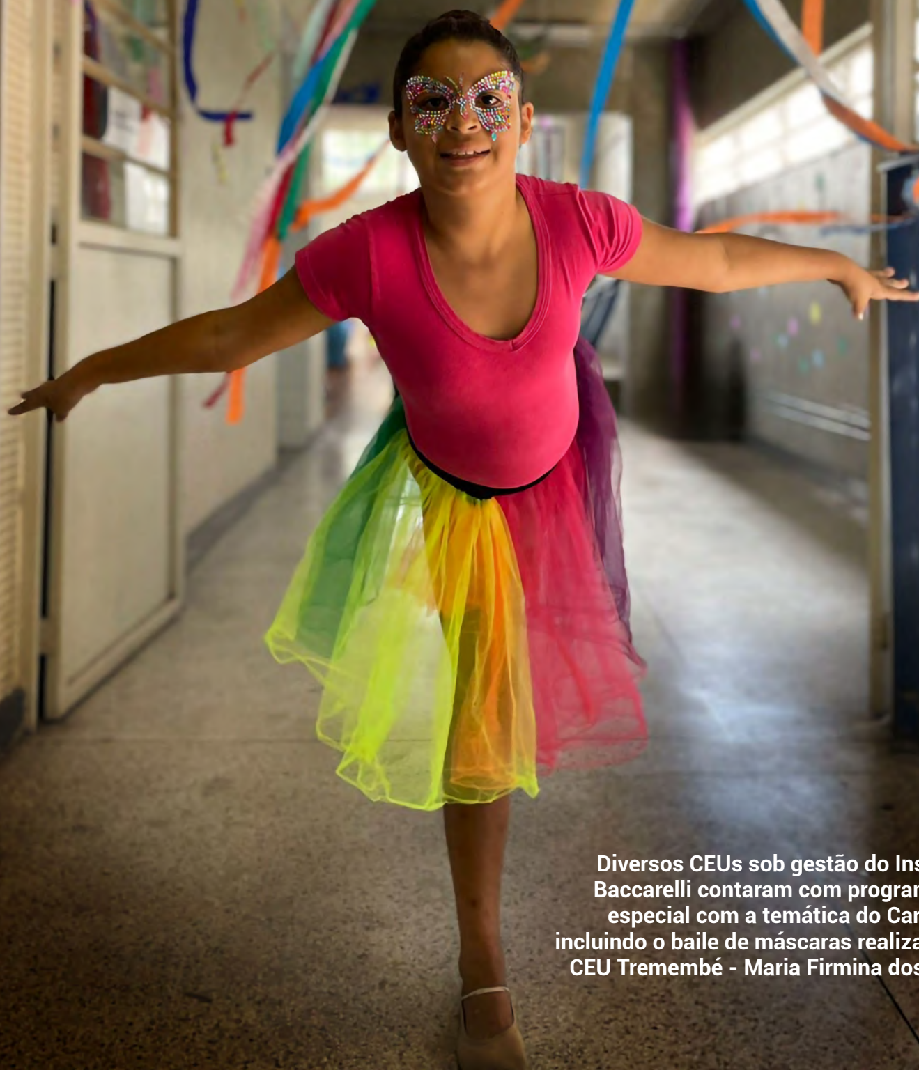
Imagem do Mês

Diversos CEUs sob gestão do Instituto Baccarelli contaram com programação especial com a temática do Carnaval, incluindo o baile de máscaras realizado no CEU Tremembé - Maria Firmina dos Reis.