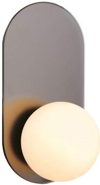
CHROME ARCH Approx : 6 " X 12 " S-1 LA40