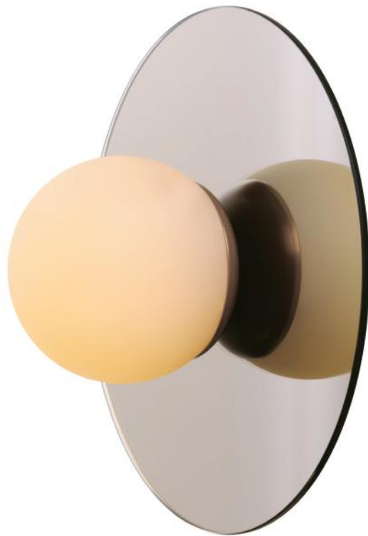
CHROME KREMA Approx : 11 " X 12 " 1205 LA40-L