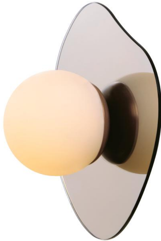
CHROME NOPAL Approx : 11 " X 12 " 1205 LA40