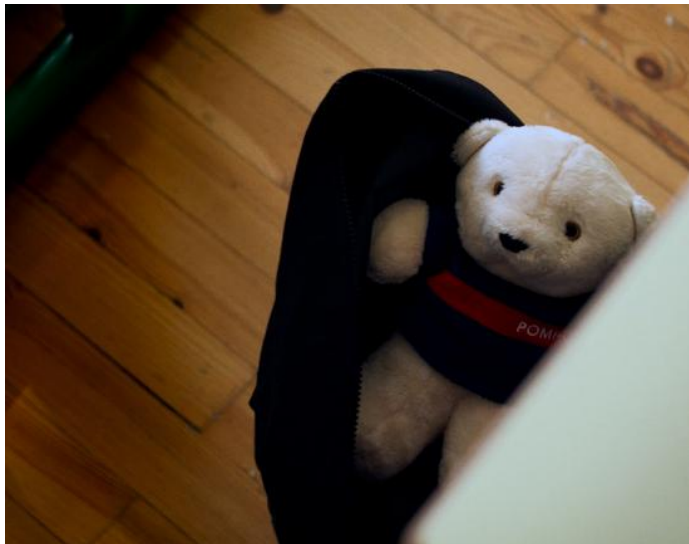
Reportage Catherine Degans.

Il s'agit de répondre aux questions : comment y remédier ? Comment y répondre ? » Annabelle l'assure : son travail n'a jamais pour vocation de soulever et souligner les aspects négatifs sans offrir de solutions. « L'idée est de trouver des solutions. Que pouvons-nous changer ? » Elle ne souhaite pas que la peur prenne le dessus lors de la diffusion de son film au sein des casernes et auprès du grand public. « Ce film pose la réalité de manière très factuelle, très nette, sans artifices. Et pourtant, mon film n'est absolument pas racoleur ! »