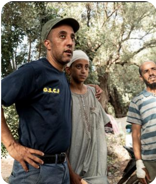
Reportage Catherine DEGANS