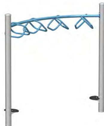
Échelle horizontale courbe à poignée J2