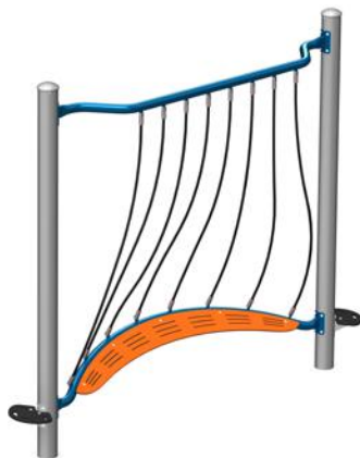
Le pont cordage J2

Quelques produits qui complètent bien Volte.