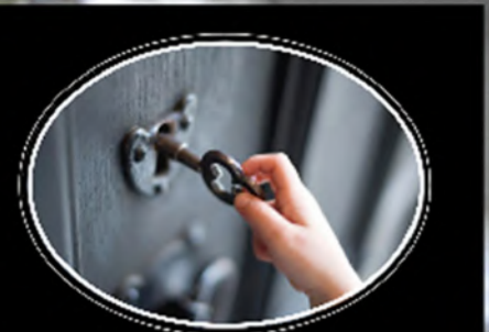
Ministères de la Prière, Conférence des Maritimes

Mais... Peut-on lui faire confiance pour le faire... pour moi ?