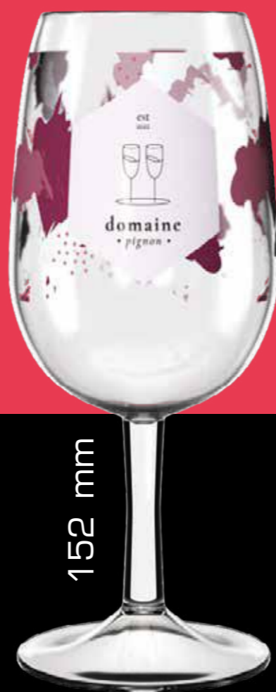
SYRAH WINE GLASS