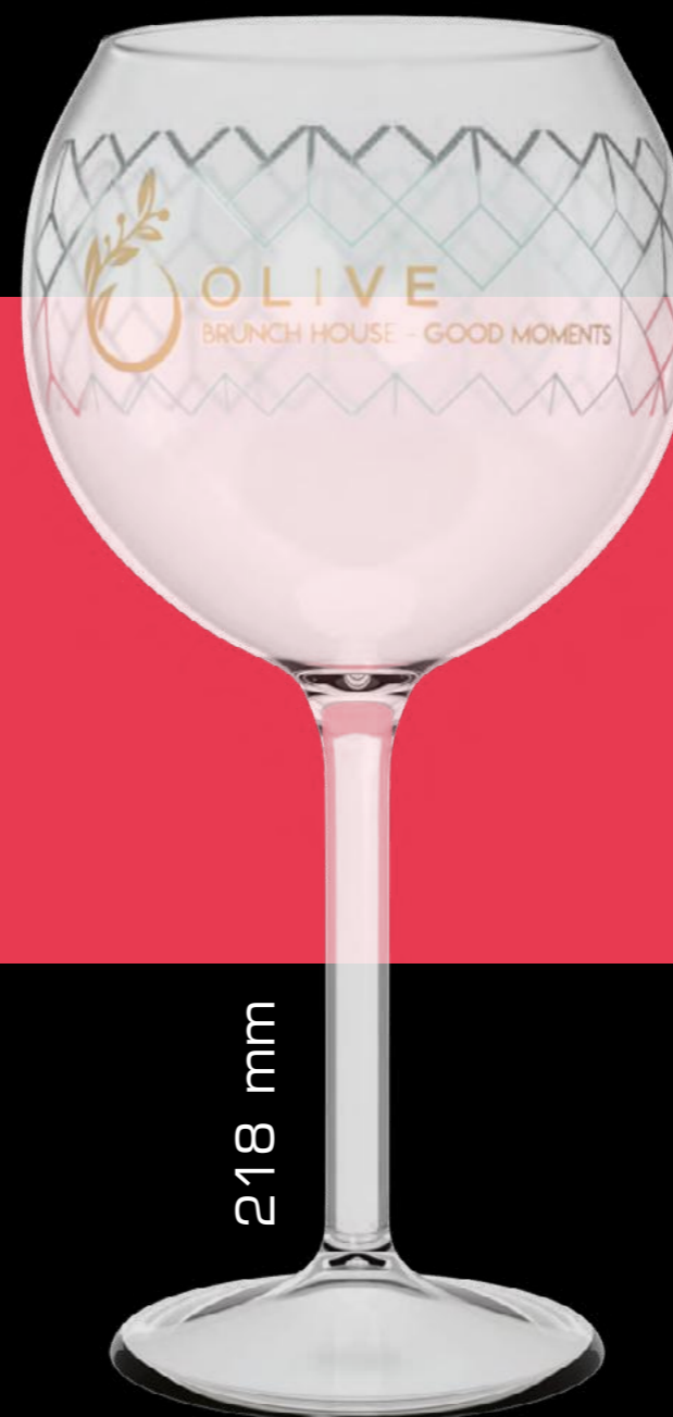
POOL PARTY WINE GLASS