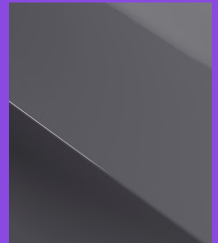
GRAPHENE GREY special Fr. 800.-