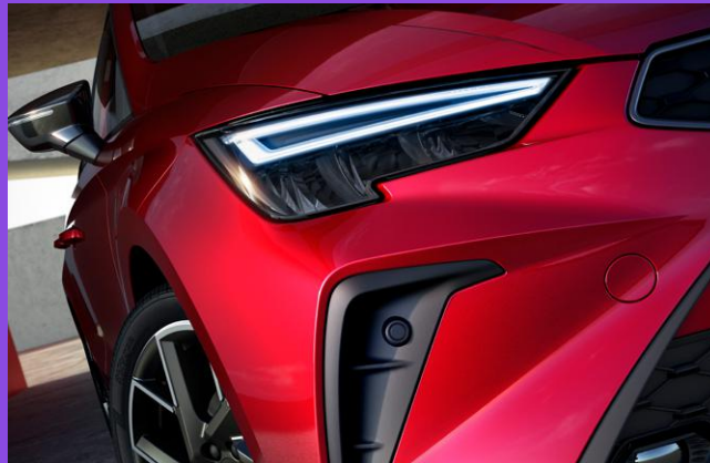
FULL LED Design Scheinwerfer mit dynamischer Leuchtweitenregulierung