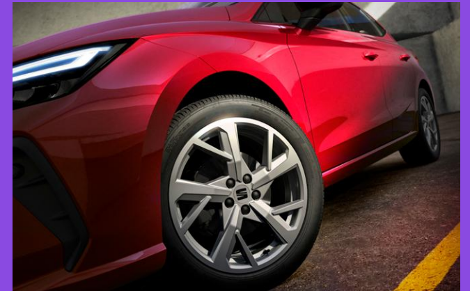
17-Zoll DYNAMIC Alufelgen in Brilliant Silver