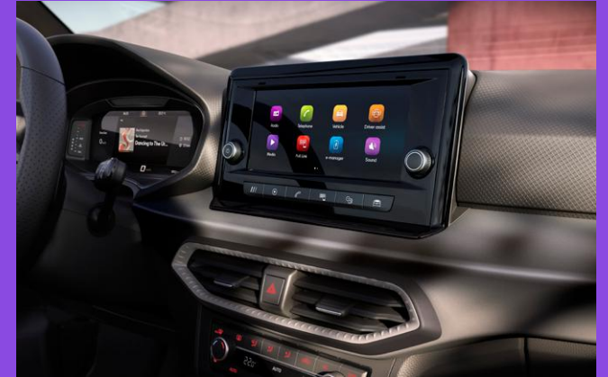
SEAT FULL LINK inkl. Apple CarPlay & Android Auto