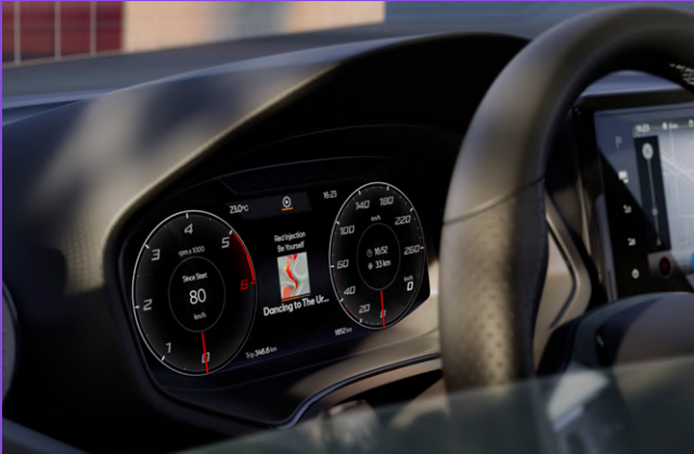
10.25" Digital Cockpit