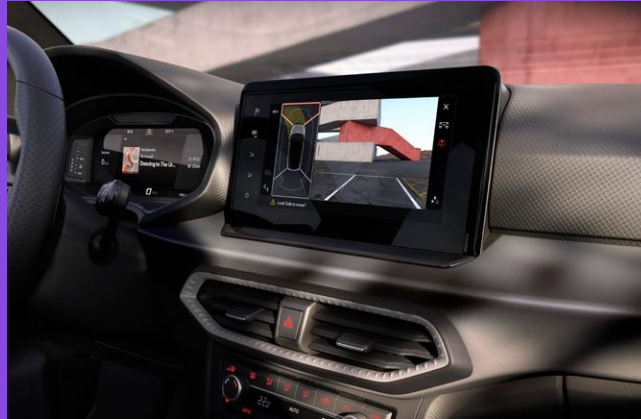
Einparkhilfe hinten & vorne mit Rückfahrkamera