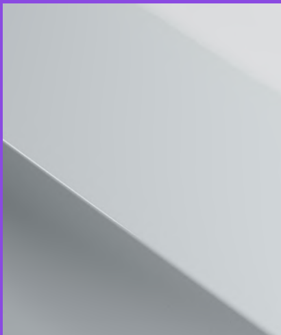
GLACIAL WHITE metallic Fr. 650.-