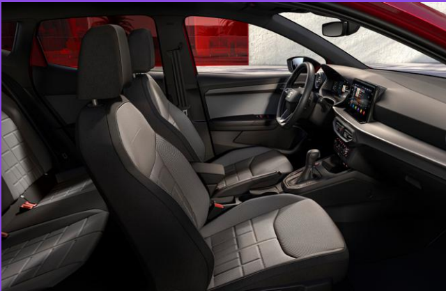
Sitzheizung für Vordersitze, getrennt regelbar