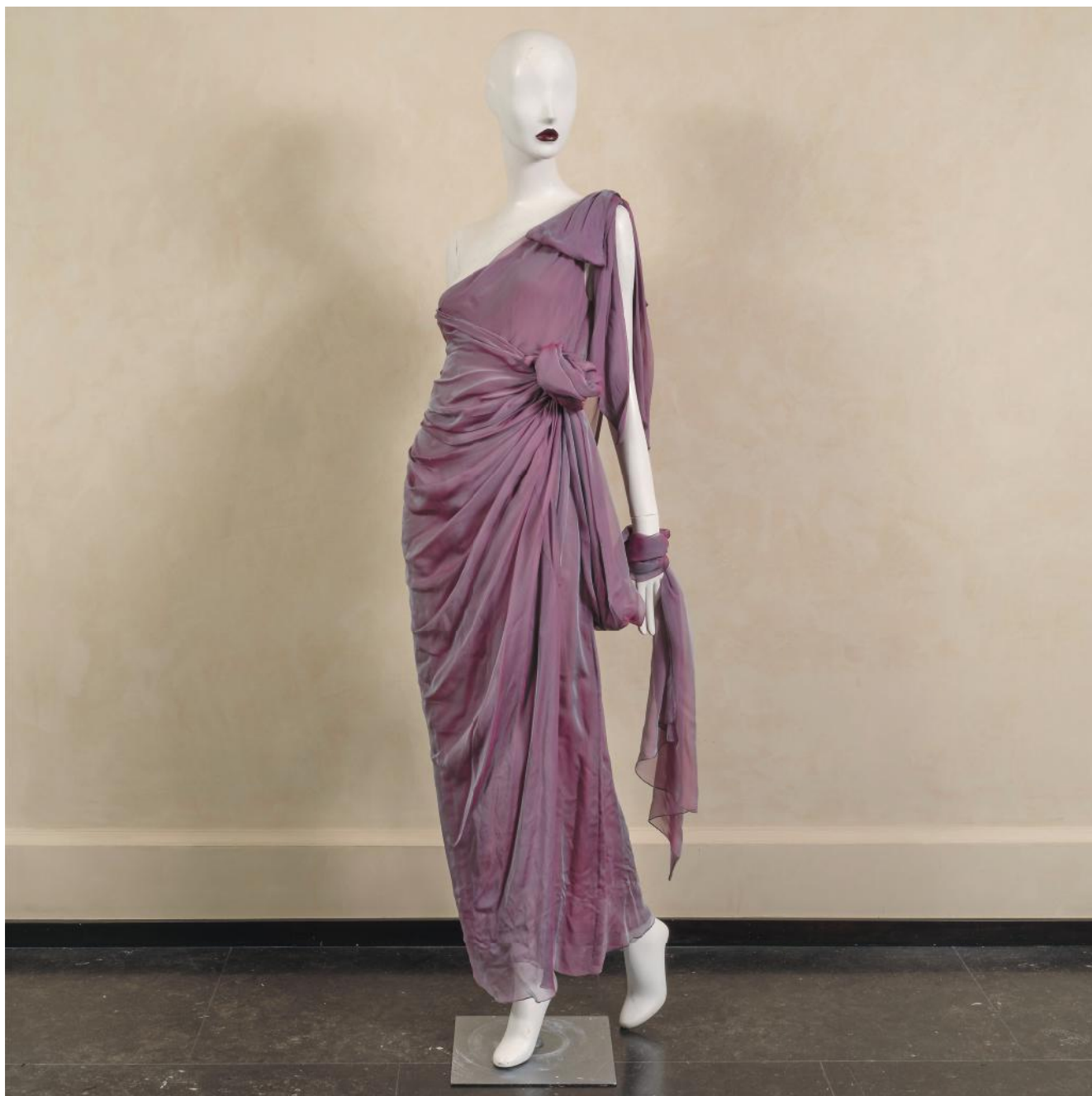
132. *Yves SAINT LAURENT haute couture Collection Printemps/Été 1999 n°075770 Robe longue asymétrique en mousseline de soie iridescente. Griffe blanche, graphisme noir