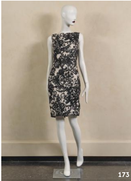
173. *Christian Dior X Bill Gayten Collection Pre-fall 2012 Robe sans manche en laine et soie écru, noire. Griffes noires, graphisme blanc. T.38 200 / 300 €