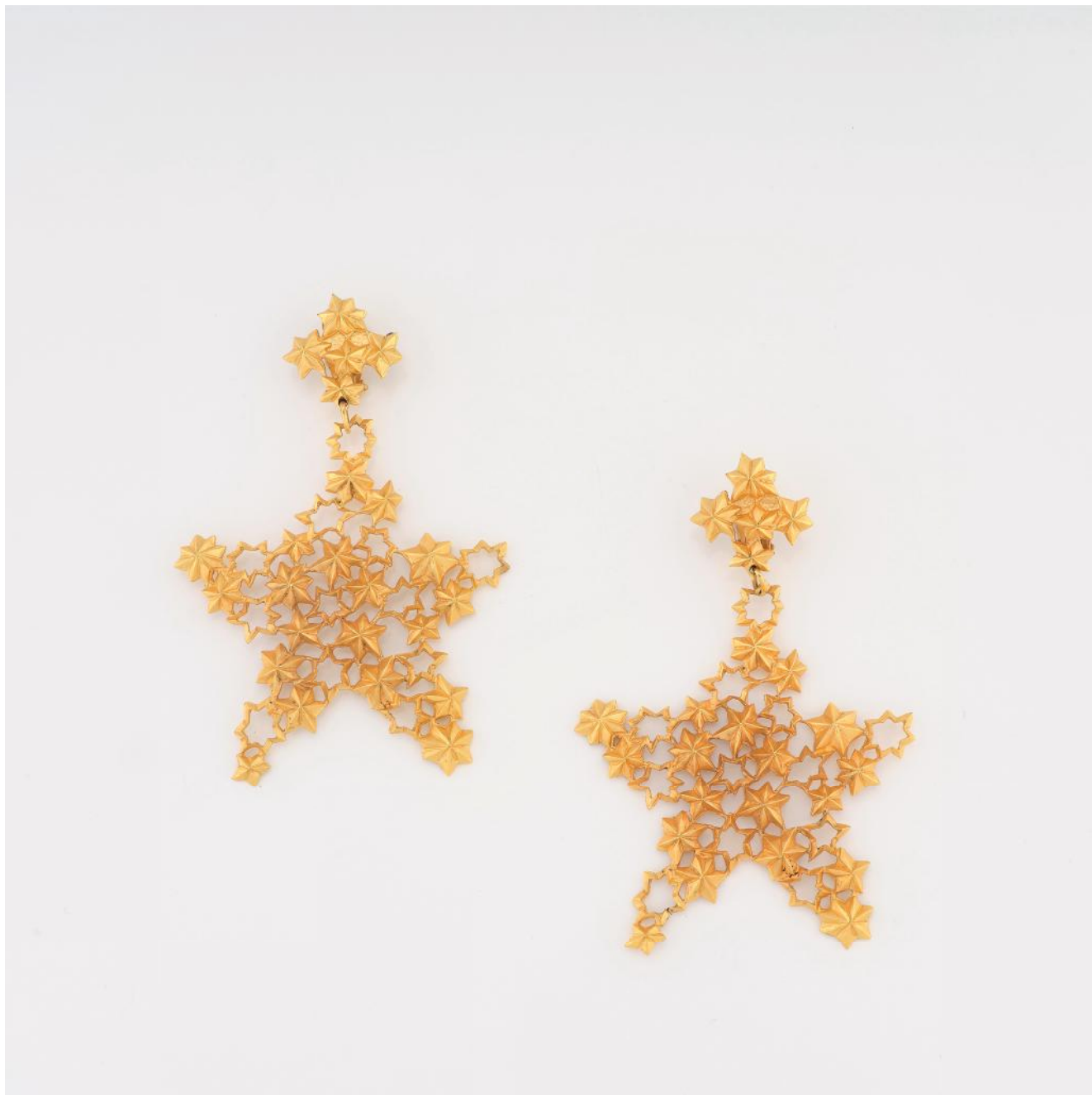
105. *Yves SAINT LAURENT rive gauche Exceptionnelle paire de pendants d'oreilles en métal doré à motif d'étoiles. Signée. Hauteur : 11cm.