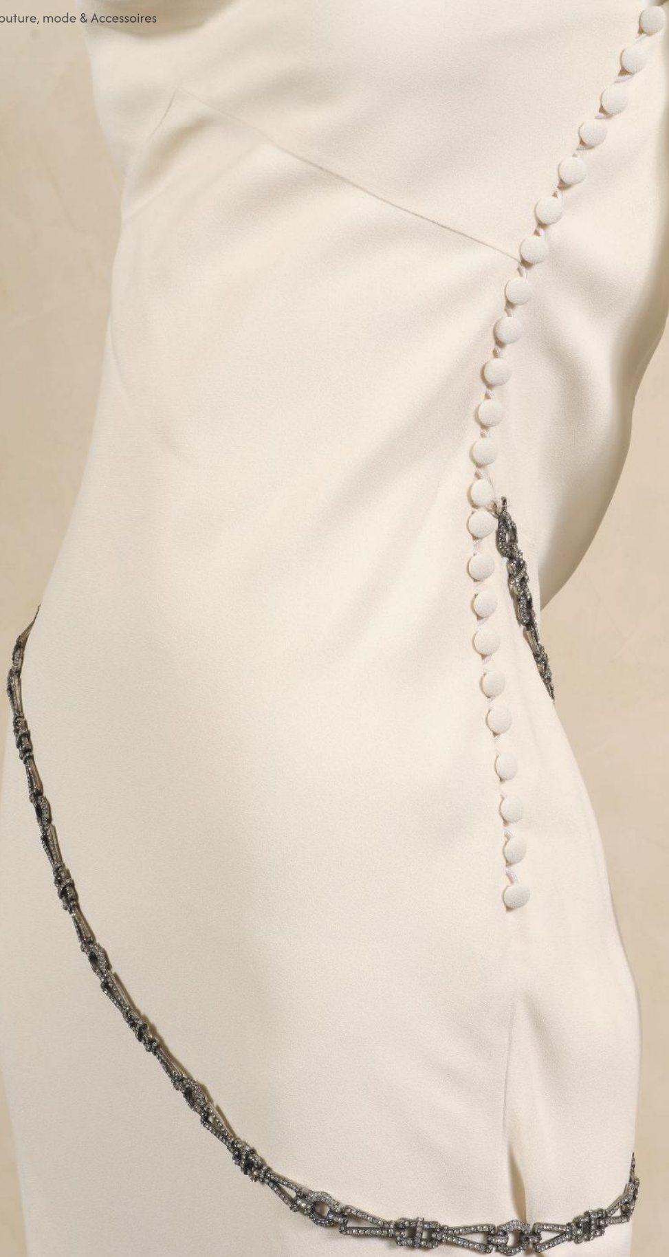
Détail lot n°437