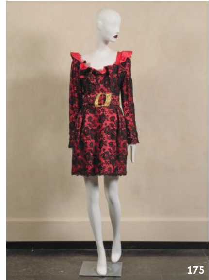
181. Christian DIOR X Gianfranco Ferré Veste en cuir agneau écru imprimé d'un motif pied de poule noir, garnie d'un motif perforé. T.42. (Salissures, traces). 150 / 200 €