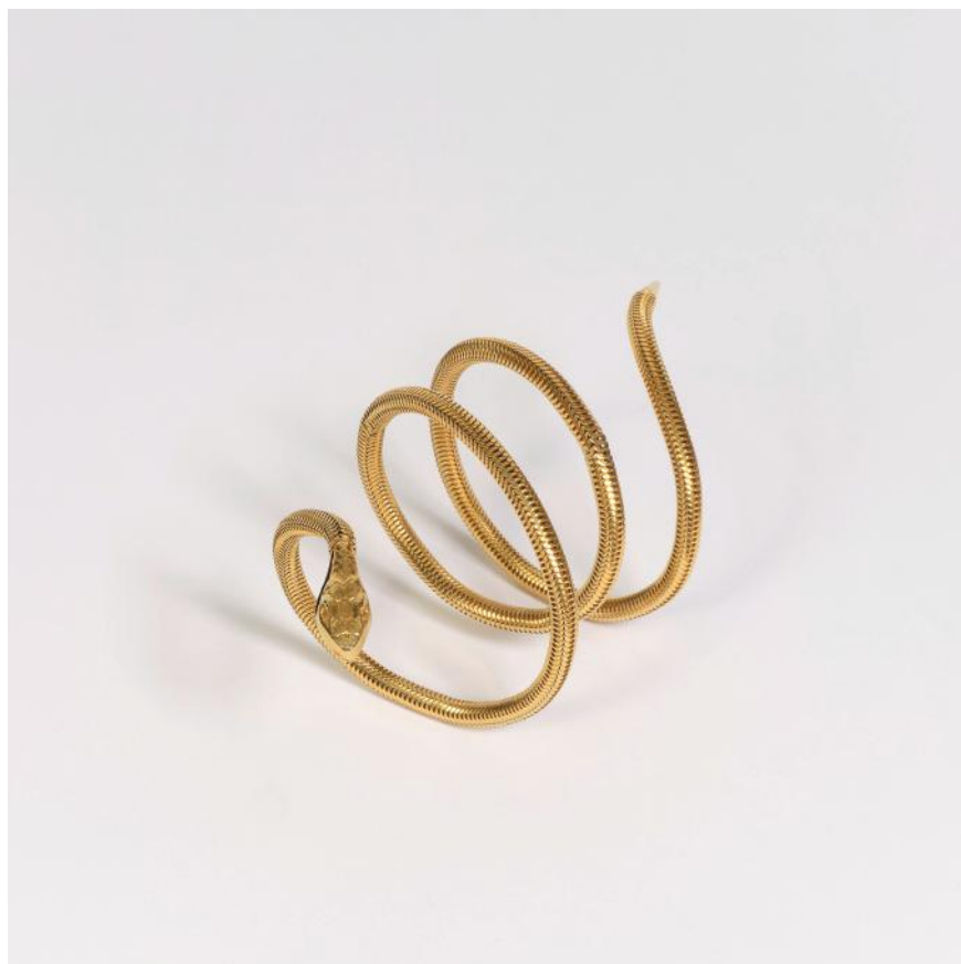
259. *Yves SAINT LAURENT haute couture Bracelet sur élastique composé de motifs en bakélite façon écaille. Non signé.