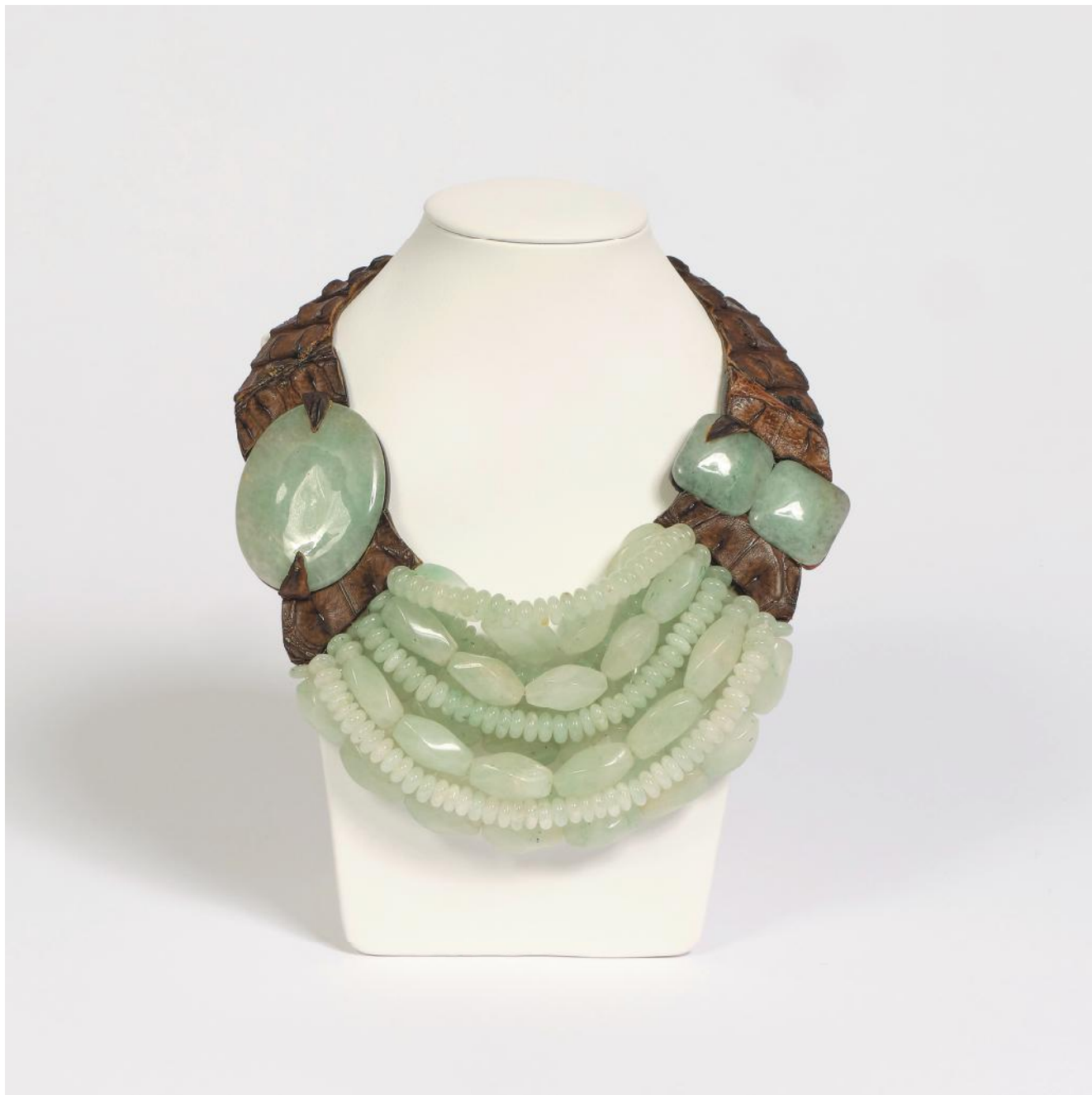
246. *Yves SAINT LAURENT haute couture Magnifique collier en Alligator cacao, perles et galets en aventurine verte. Non signé.