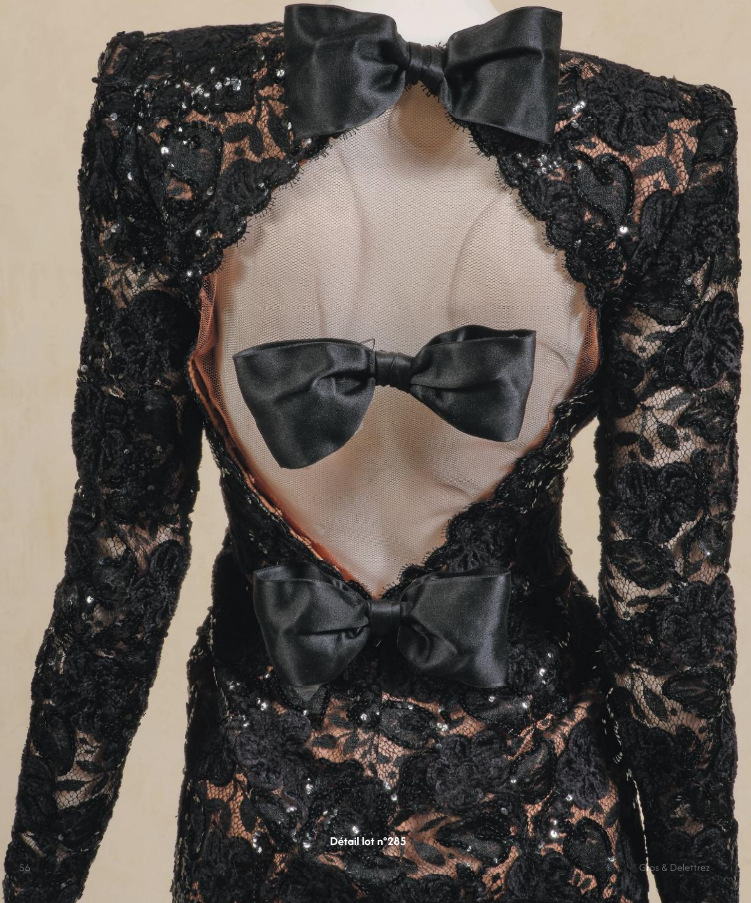
Détail lot n°285