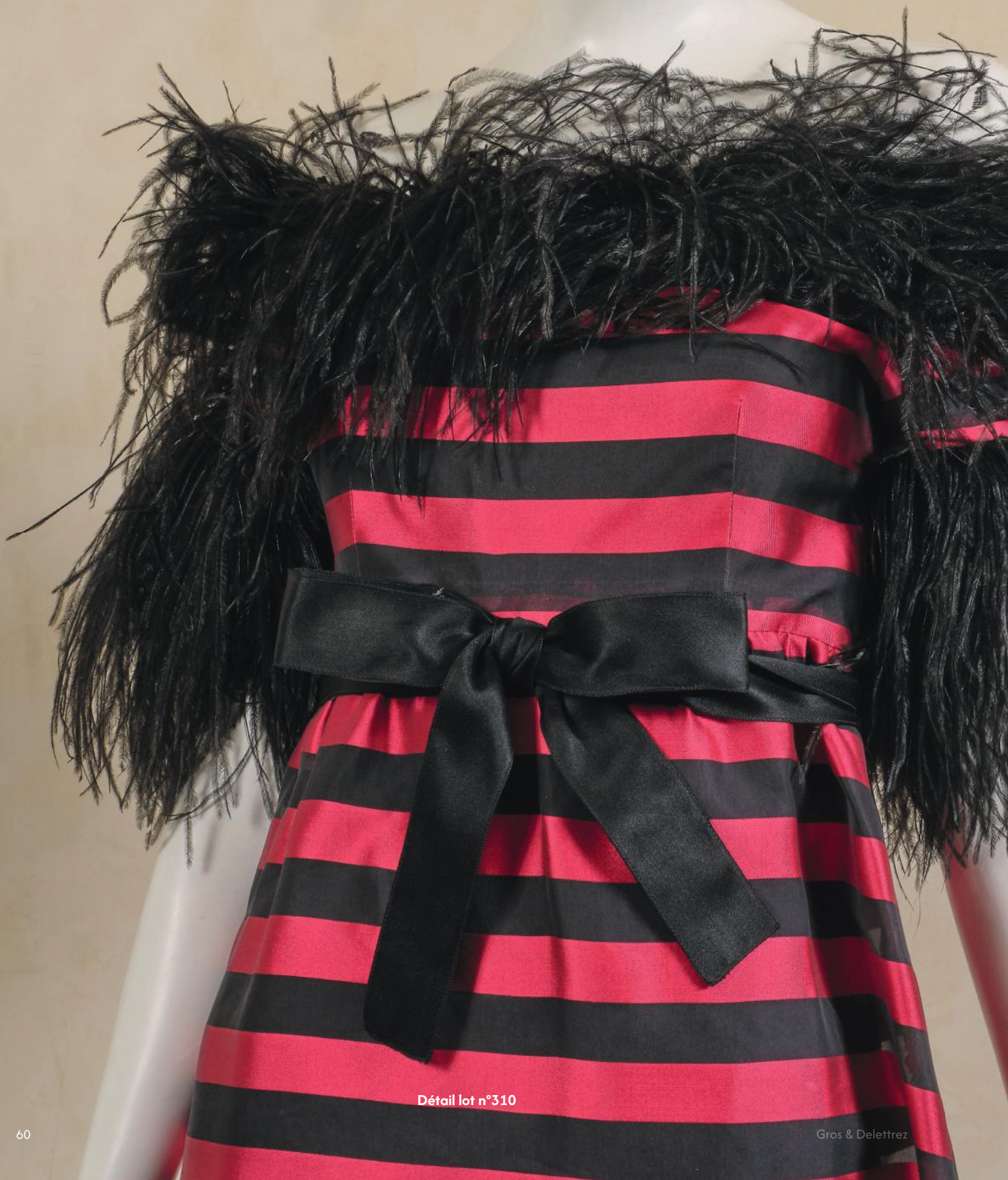
Détail lot n°310