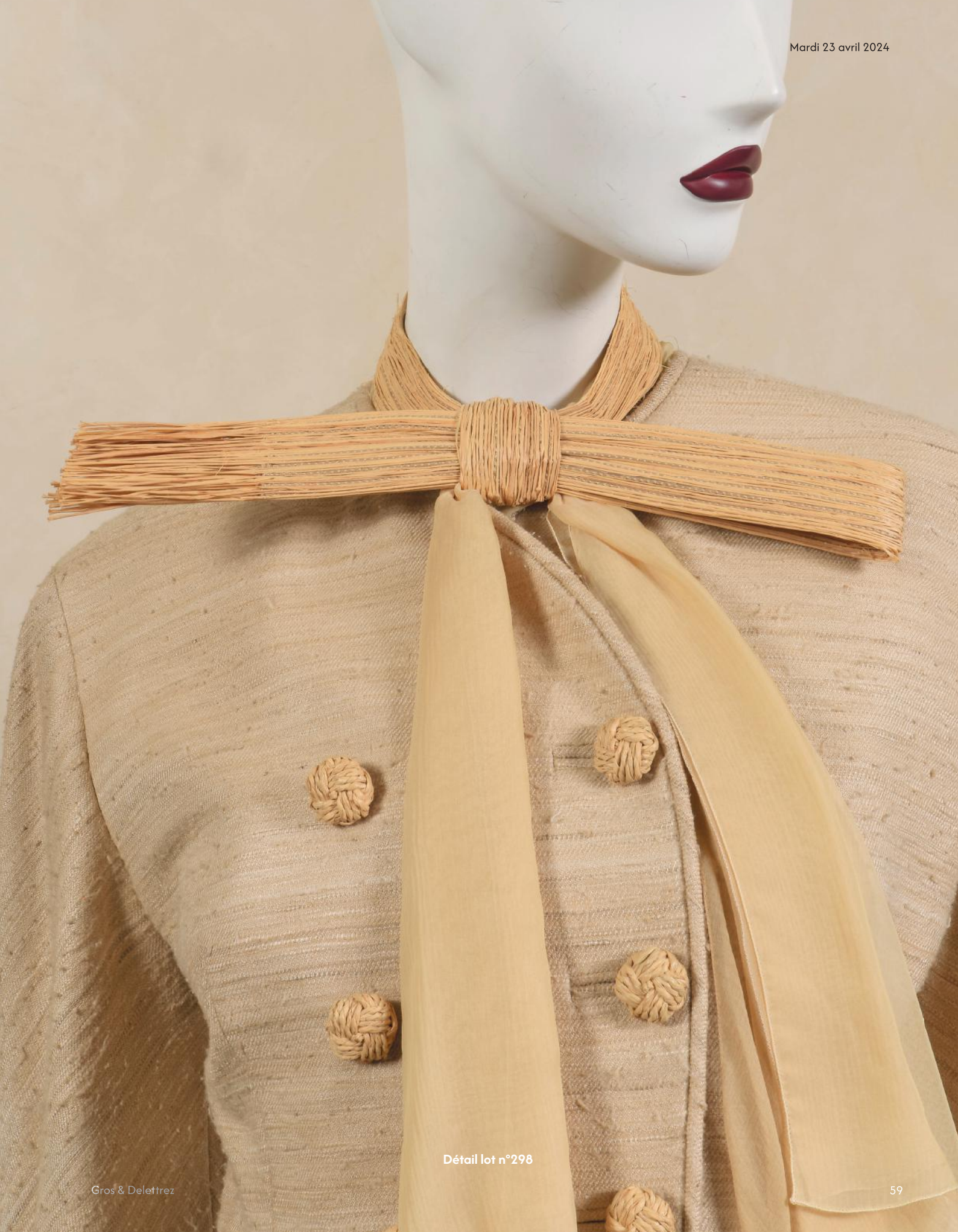
Détail lot n°298