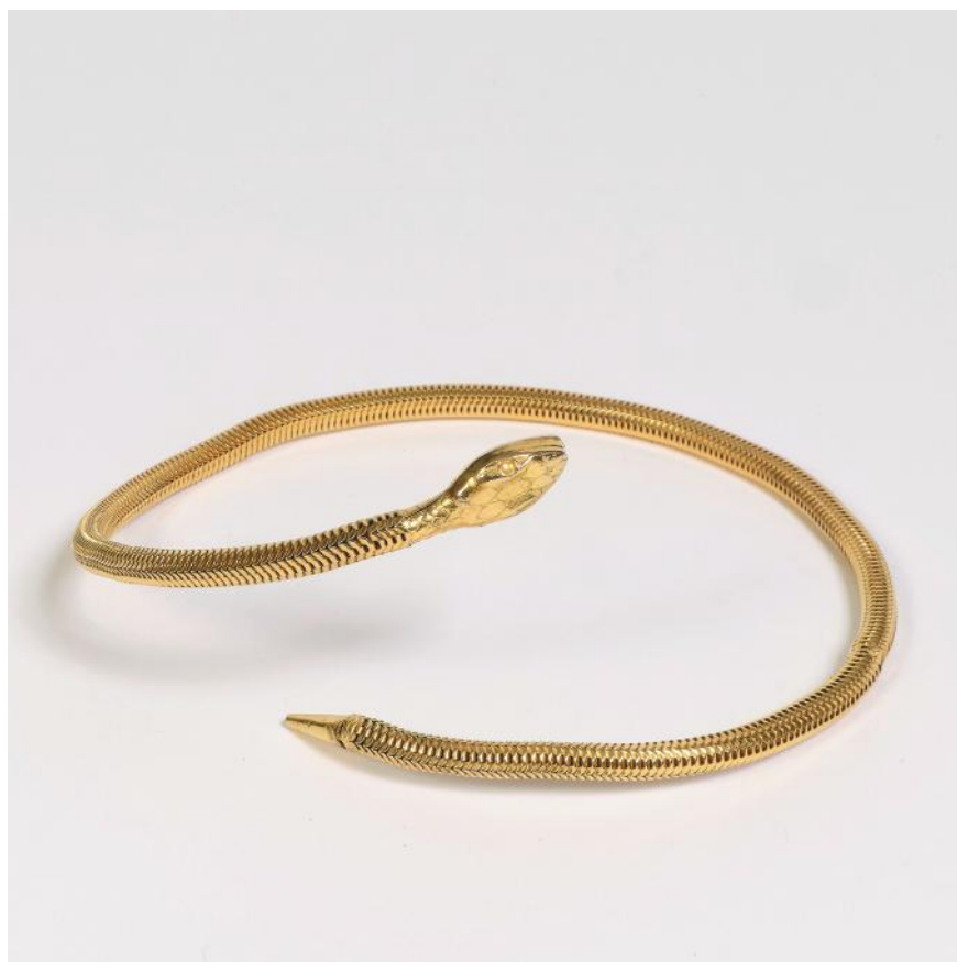
260. *Yves SAINT LAURENT haute couture Collier en métal doré à maille tubogaz figurant un serpent. Non signé.