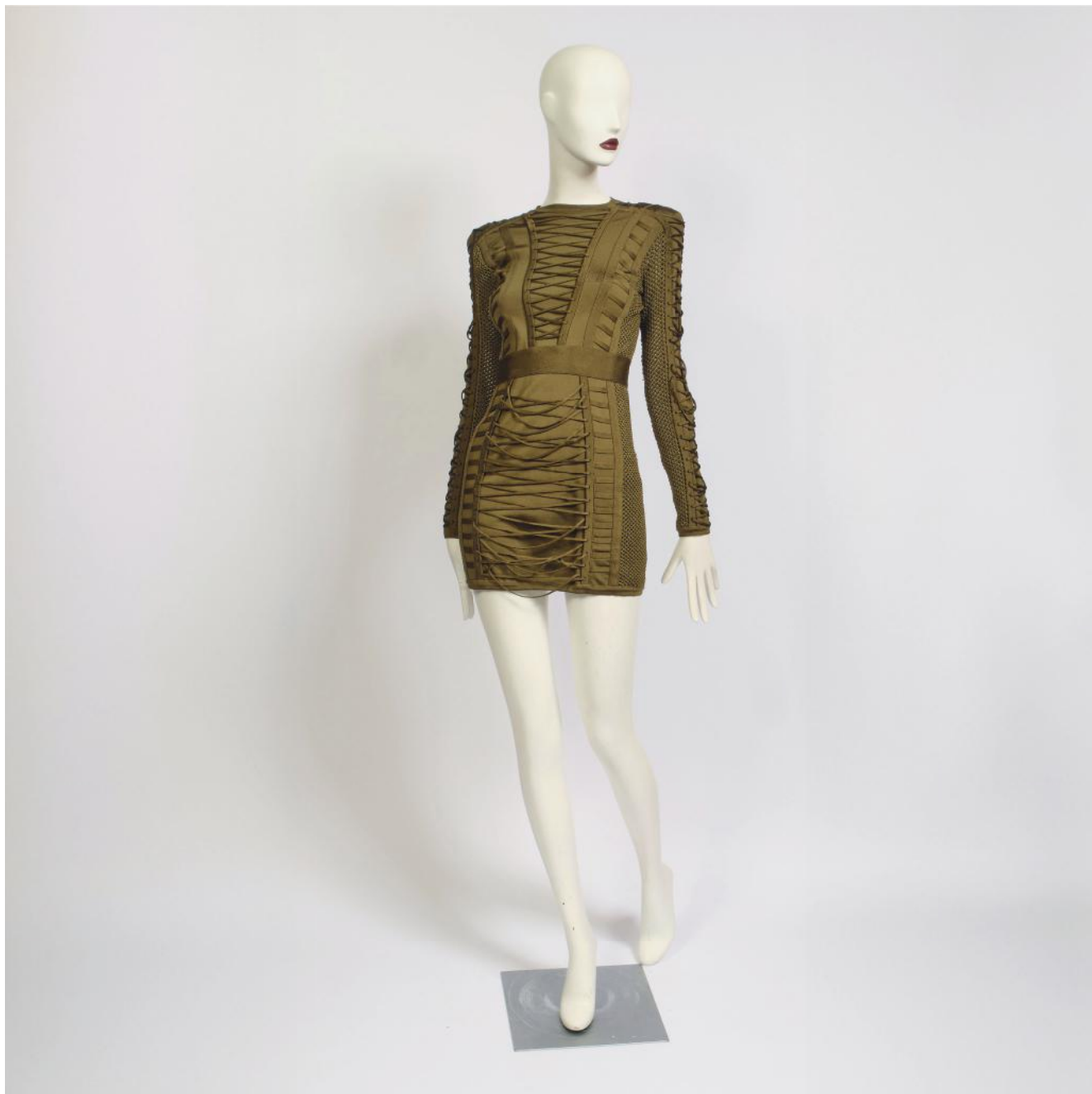
145. *BALMAIN X Olivier Rousteing Iconique robe "Army" en maille kaki lacée. Griffe noire, graphisme blanc. T.38.