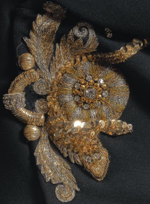
Détail lot n°210