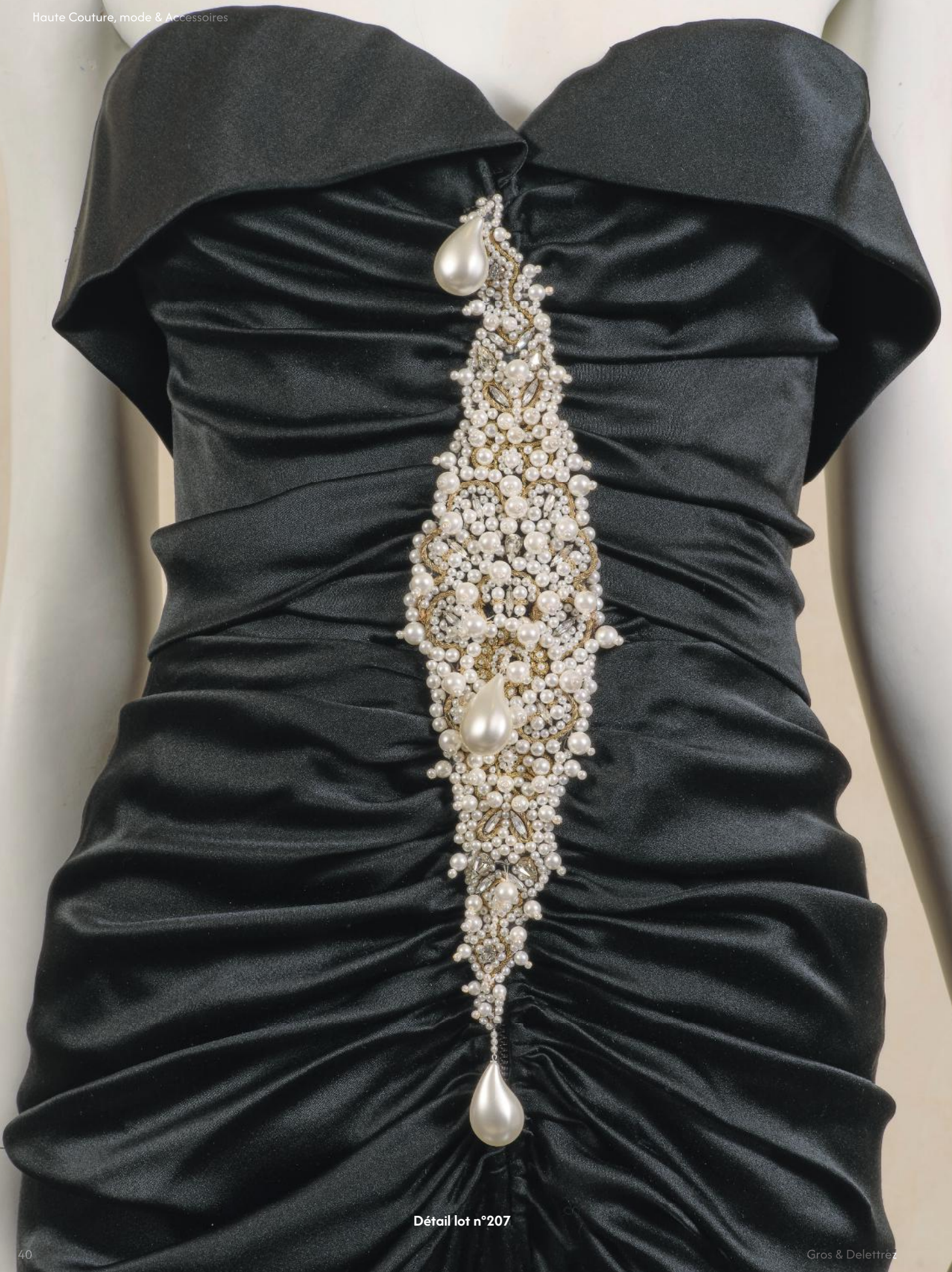
Détail lot n°207