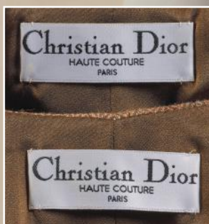
Détail lot n°471