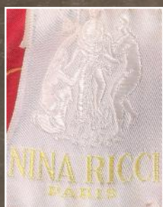
Détail lot n°422