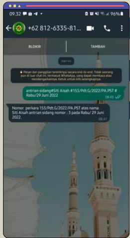
WASID (Whatsapp Antrian Sidang)