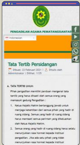
Tata Tertib Persidangan