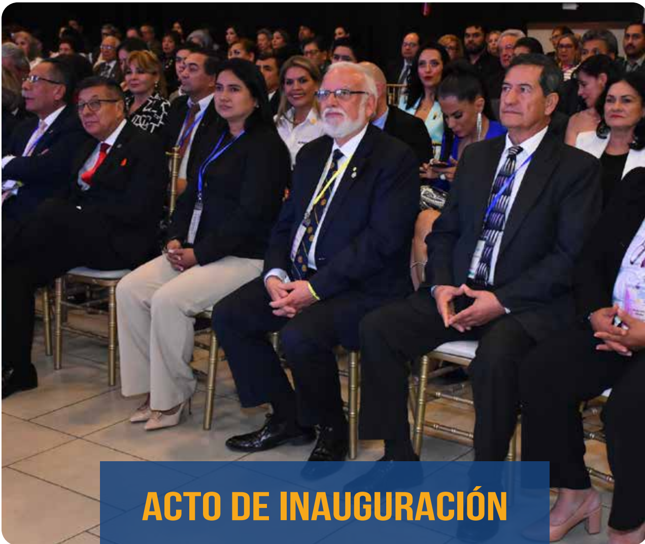
ACTO DE INAUGURACIÓN