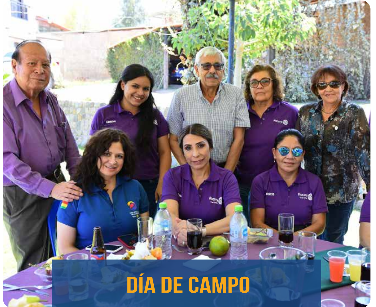
DÍA DE CAMPO