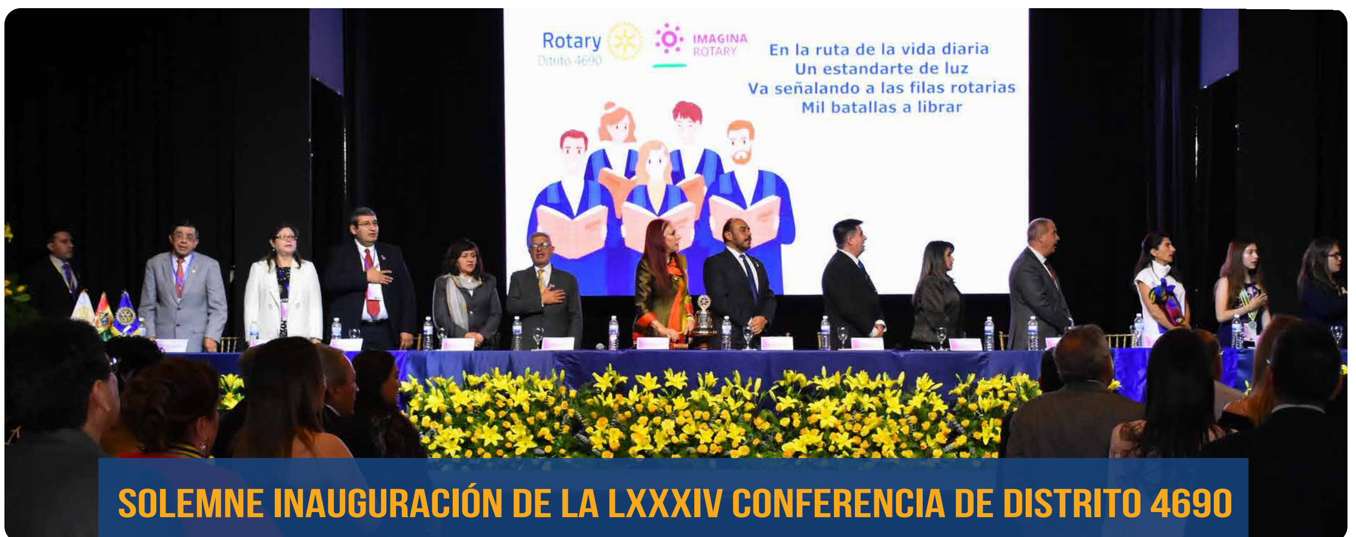
SOLEMNE INAUGURACIÓN DE LA LXXXIV CONFERENCIA DE DISTRITO 4690