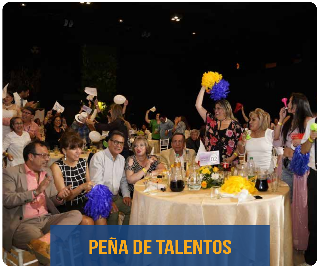
PEÑA DE TALENTOS