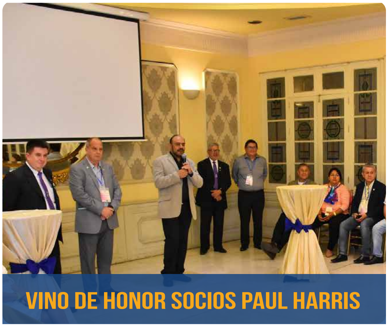
VINO DE HONOR SOCIOS PAUL HARRIS