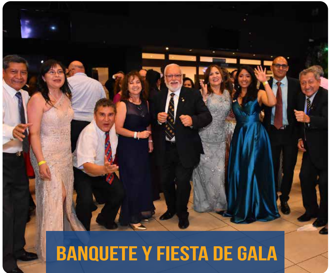
BANQUETE Y FIESTA DE GALA