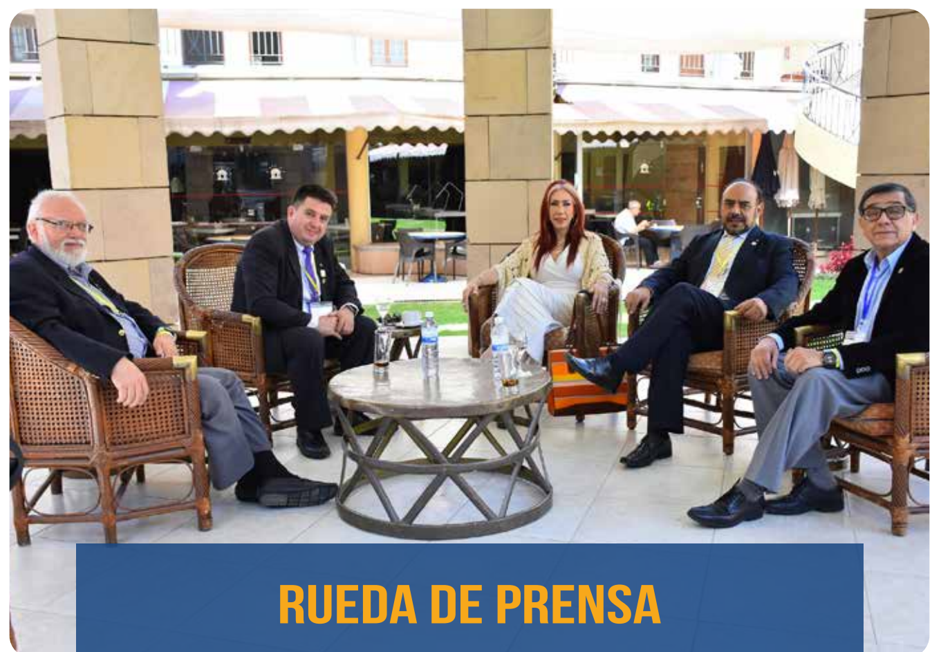
RUEDA DE PRENSA