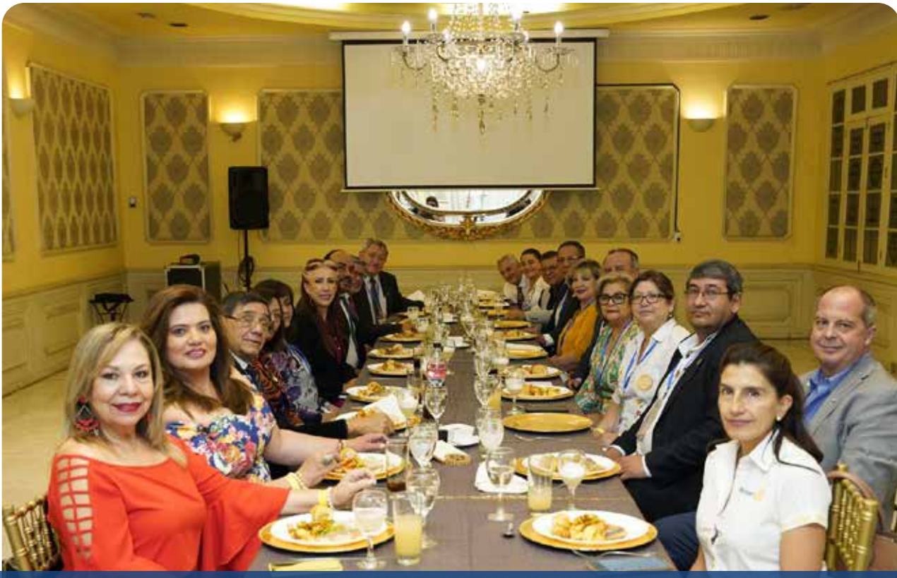
ALMUERZO DEL CONSEJO DE GOBERNADORES Y ESPOSAS DE GOBERNADORES DISTRITO 4690