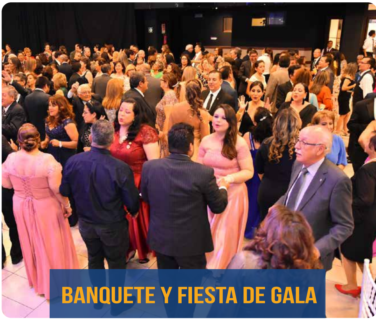
BANQUETE Y FIESTA DE GALA