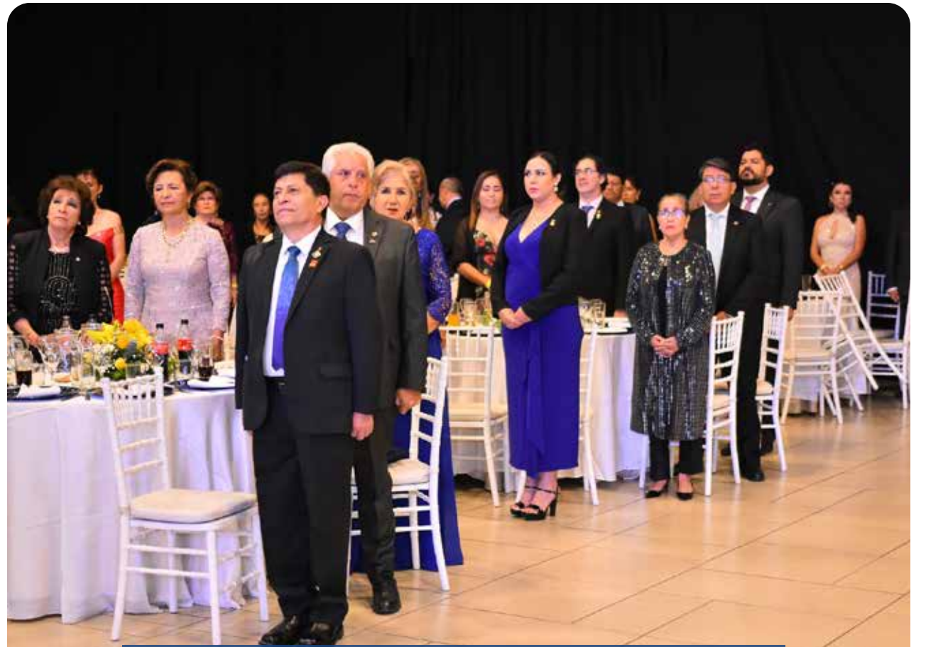
BANQUETE Y FIESTA DE GALA