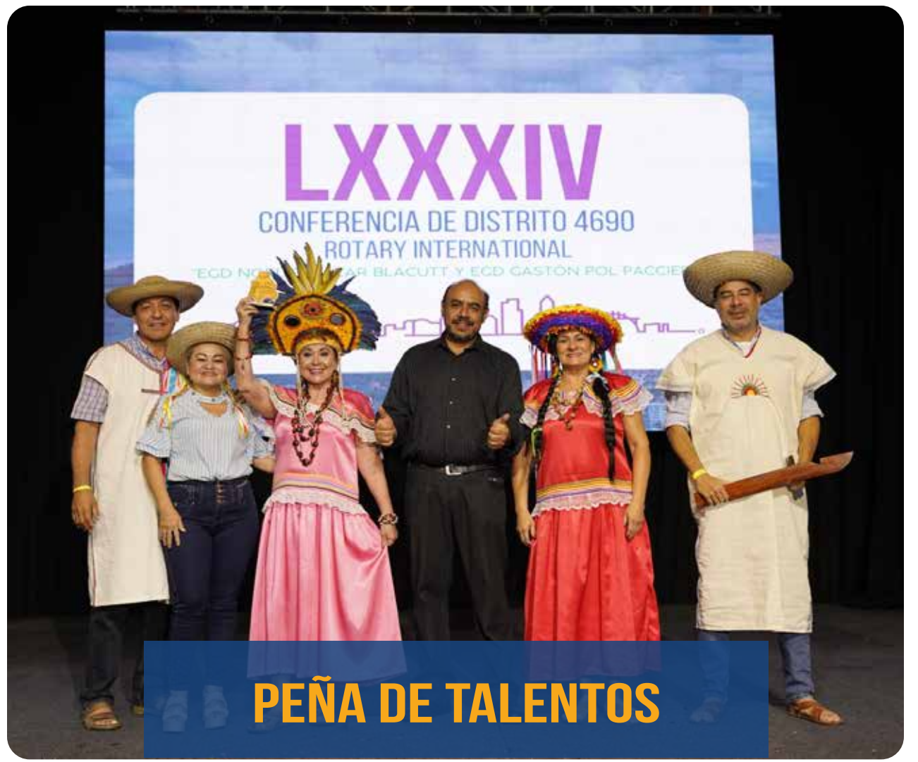
PEÑA DE TALENTOS