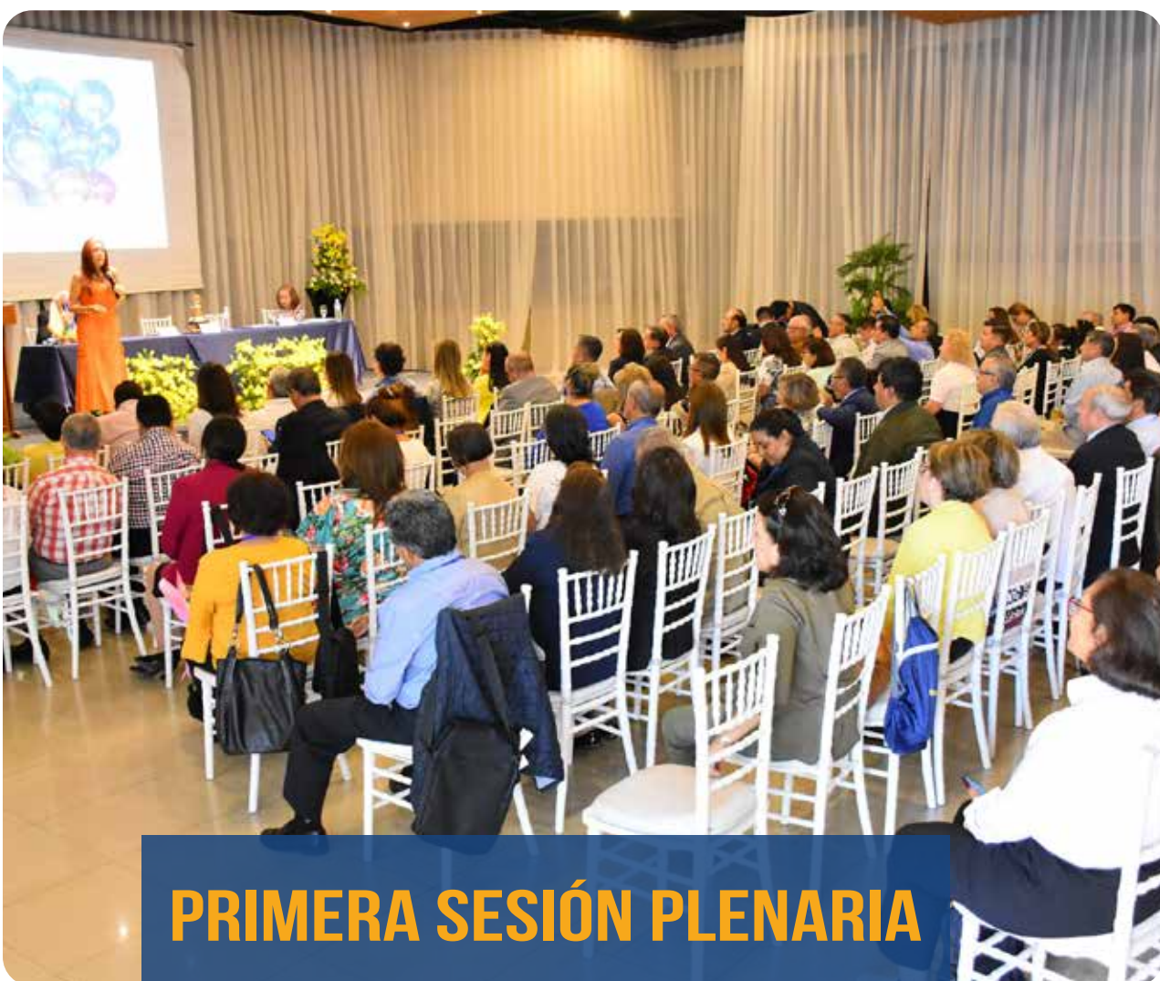
PRIMERA SESIÓN PLENARIA