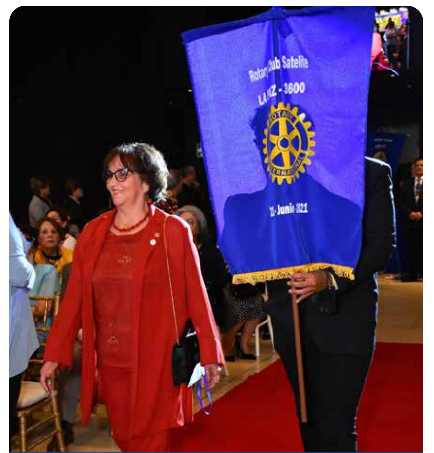
ACTO DE INAUGURACIÓN