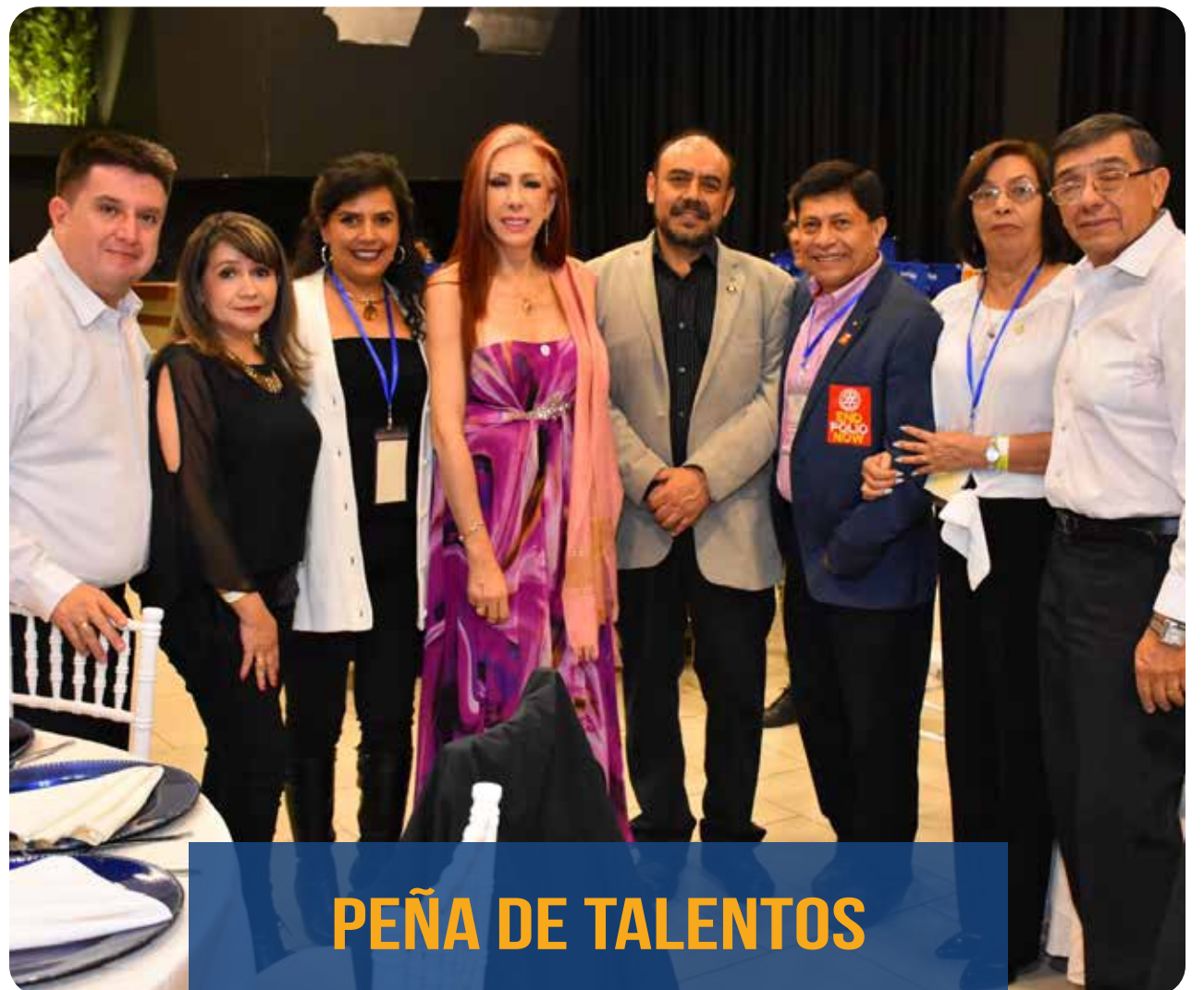
PEÑA DE TALENTOS