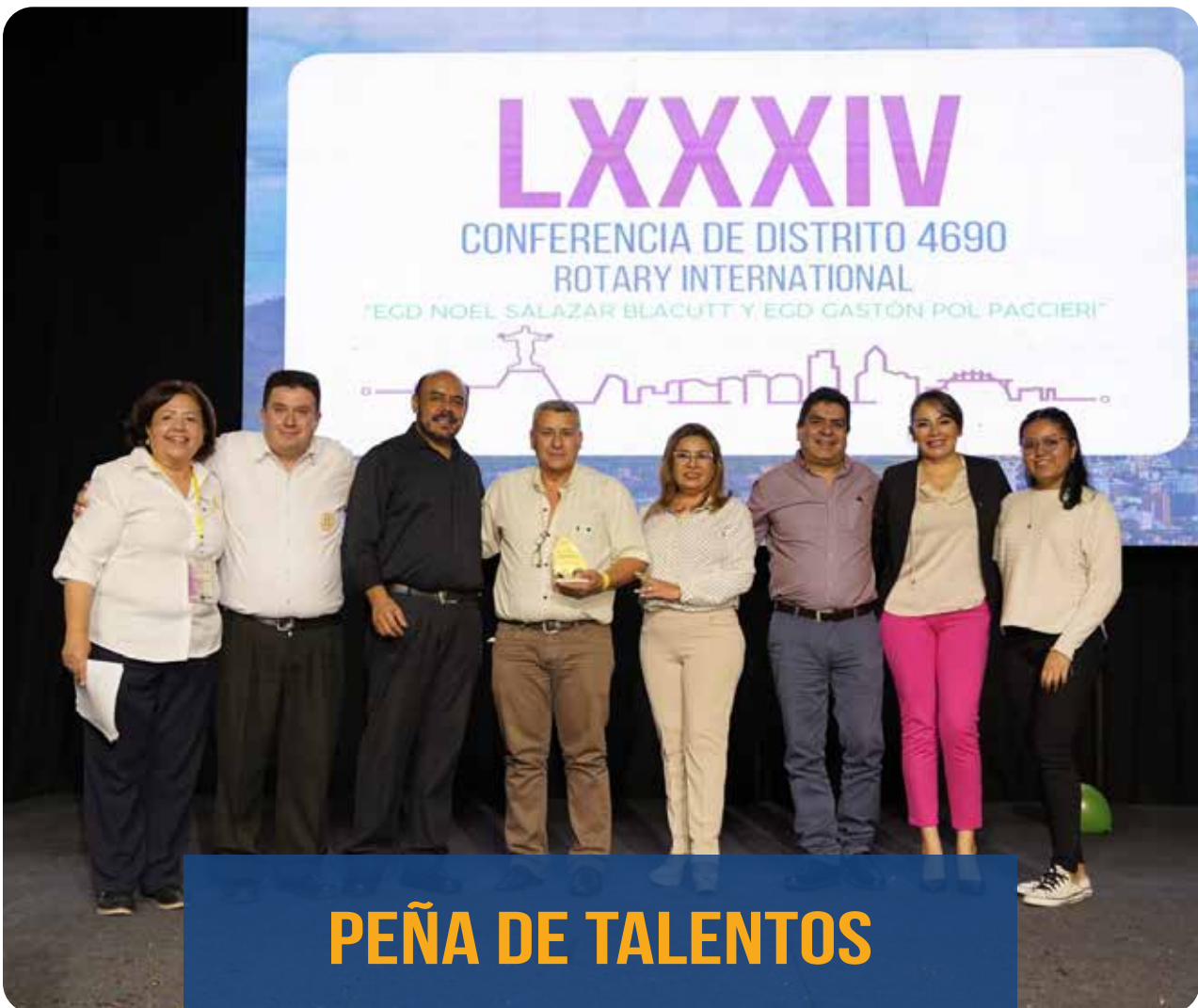
PEÑA DE TALENTOS