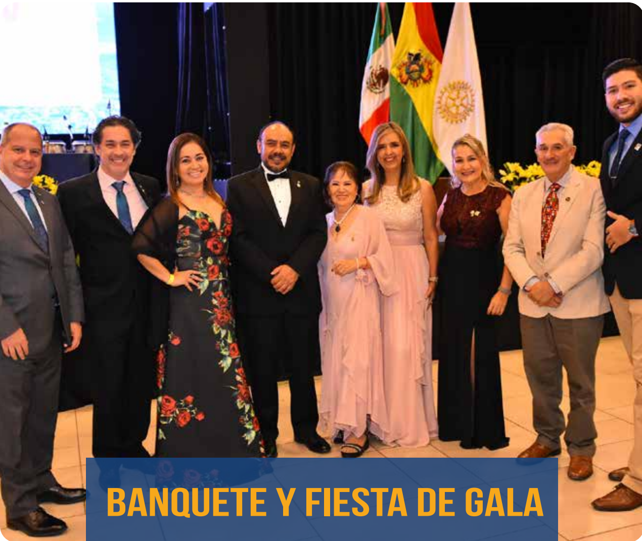
BANQUETE Y FIESTA DE GALA