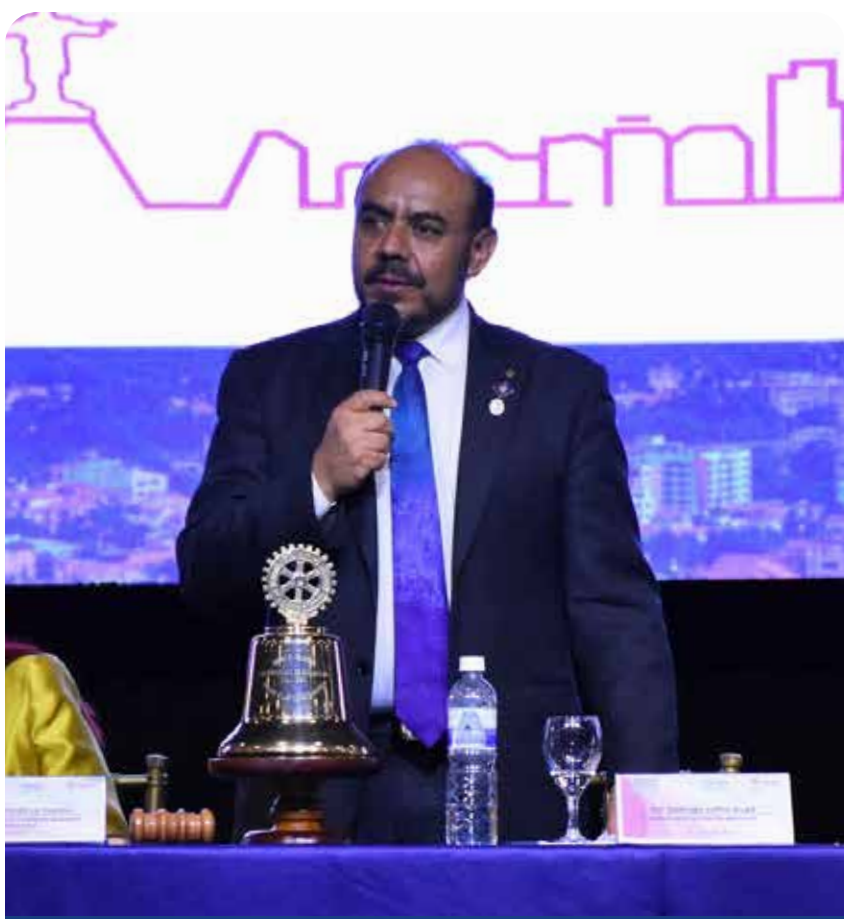
ACTO DE INAUGURACIÓN