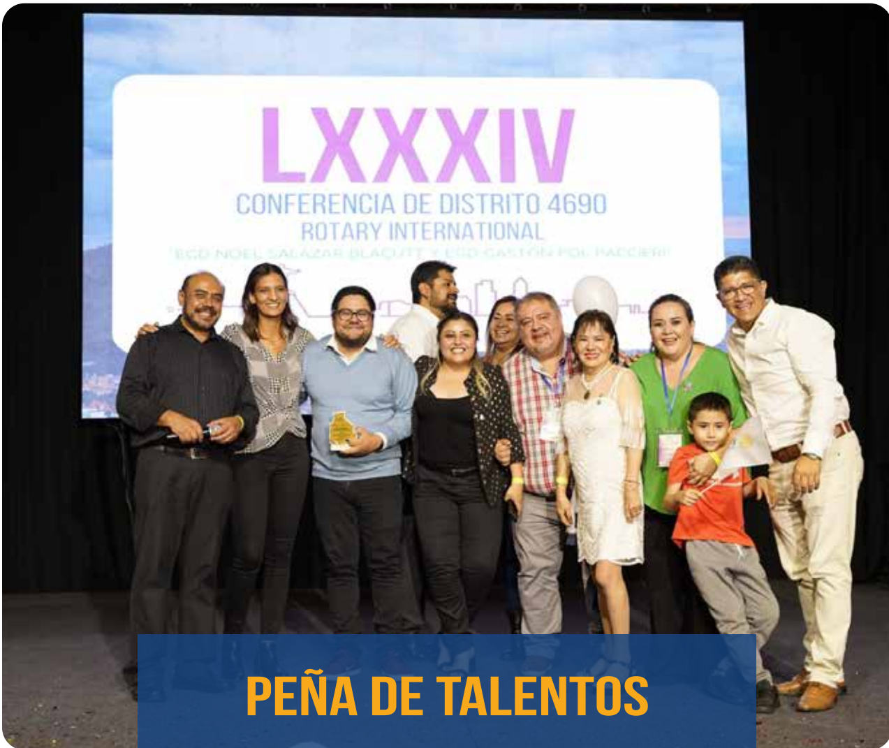
PEÑA DE TALENTOS