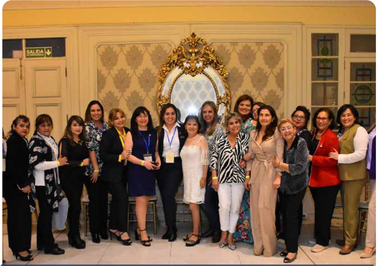
VINO DE HONOR SOCIOS PAUL HARRIS