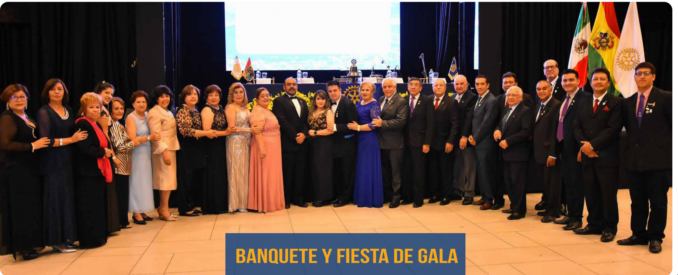
BANQUETE Y FIESTA DE GALA