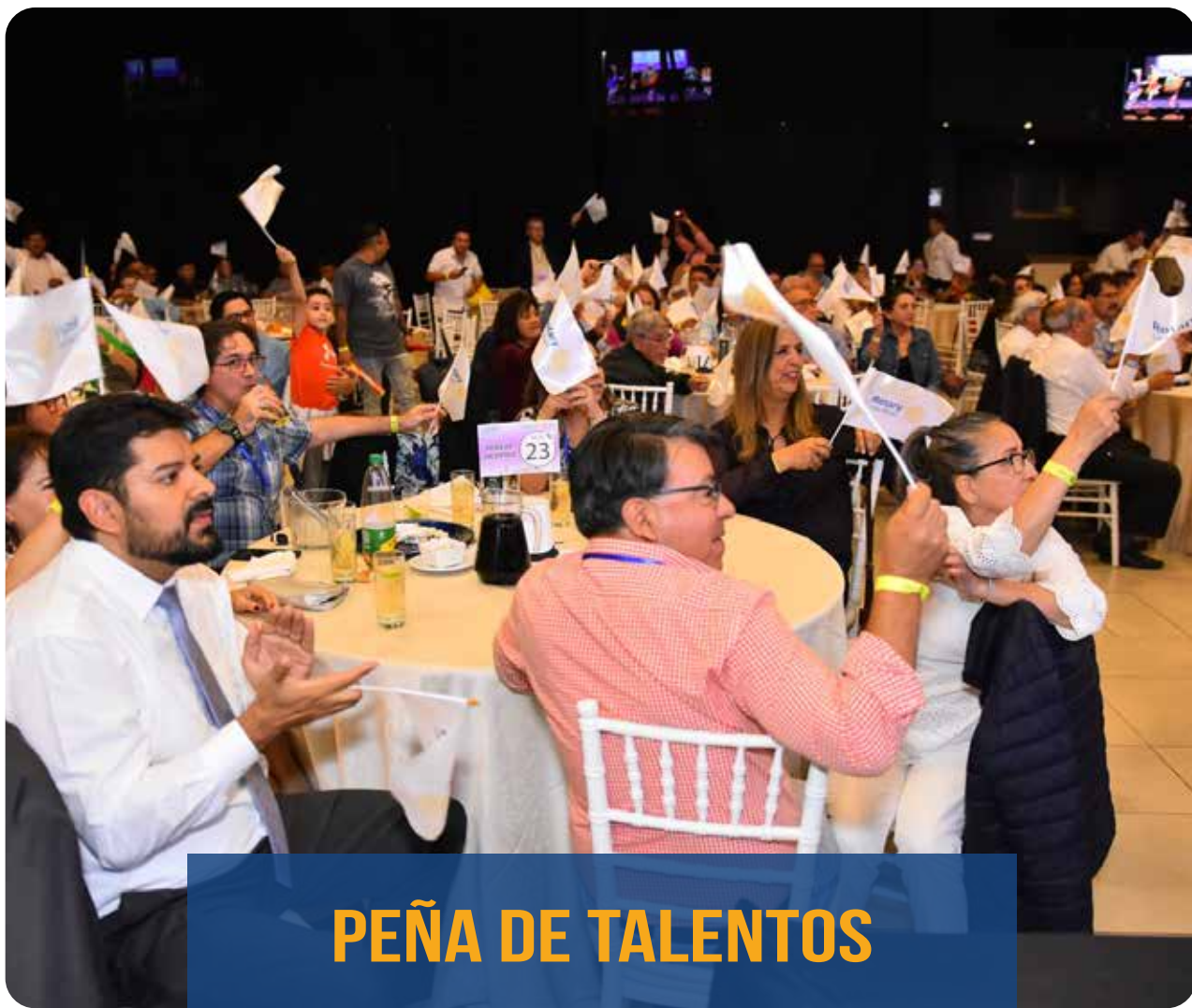
PEÑA DE TALENTOS