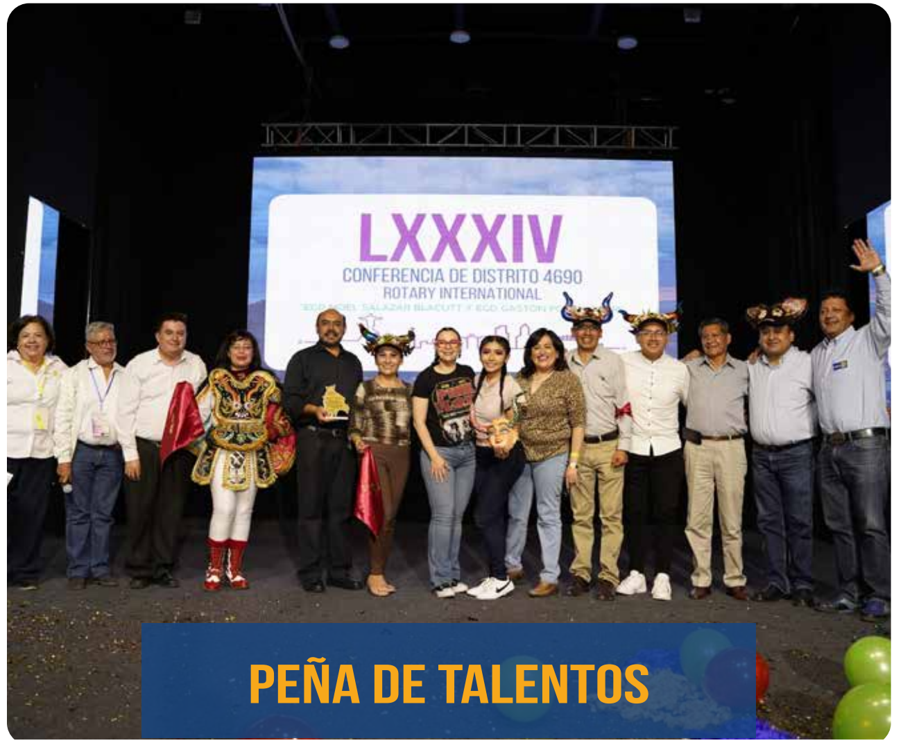
PEÑA DE TALENTOS