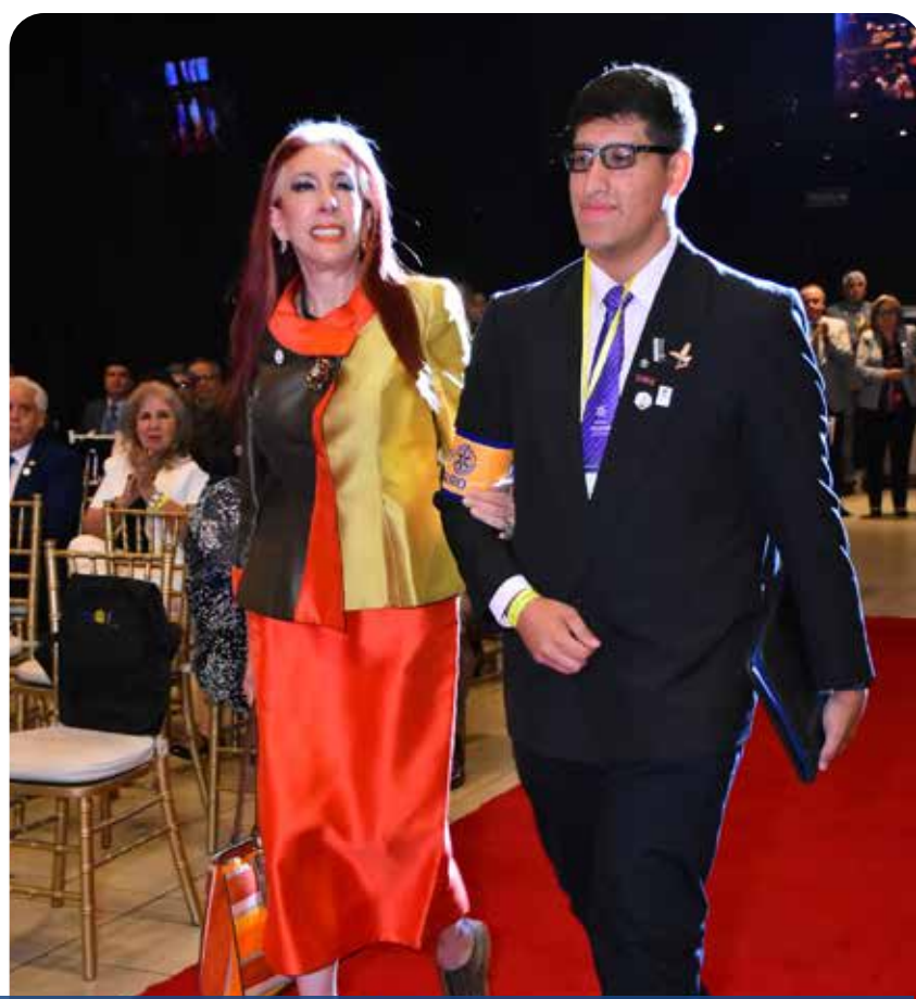
ACTO DE INAUGURACIÓN