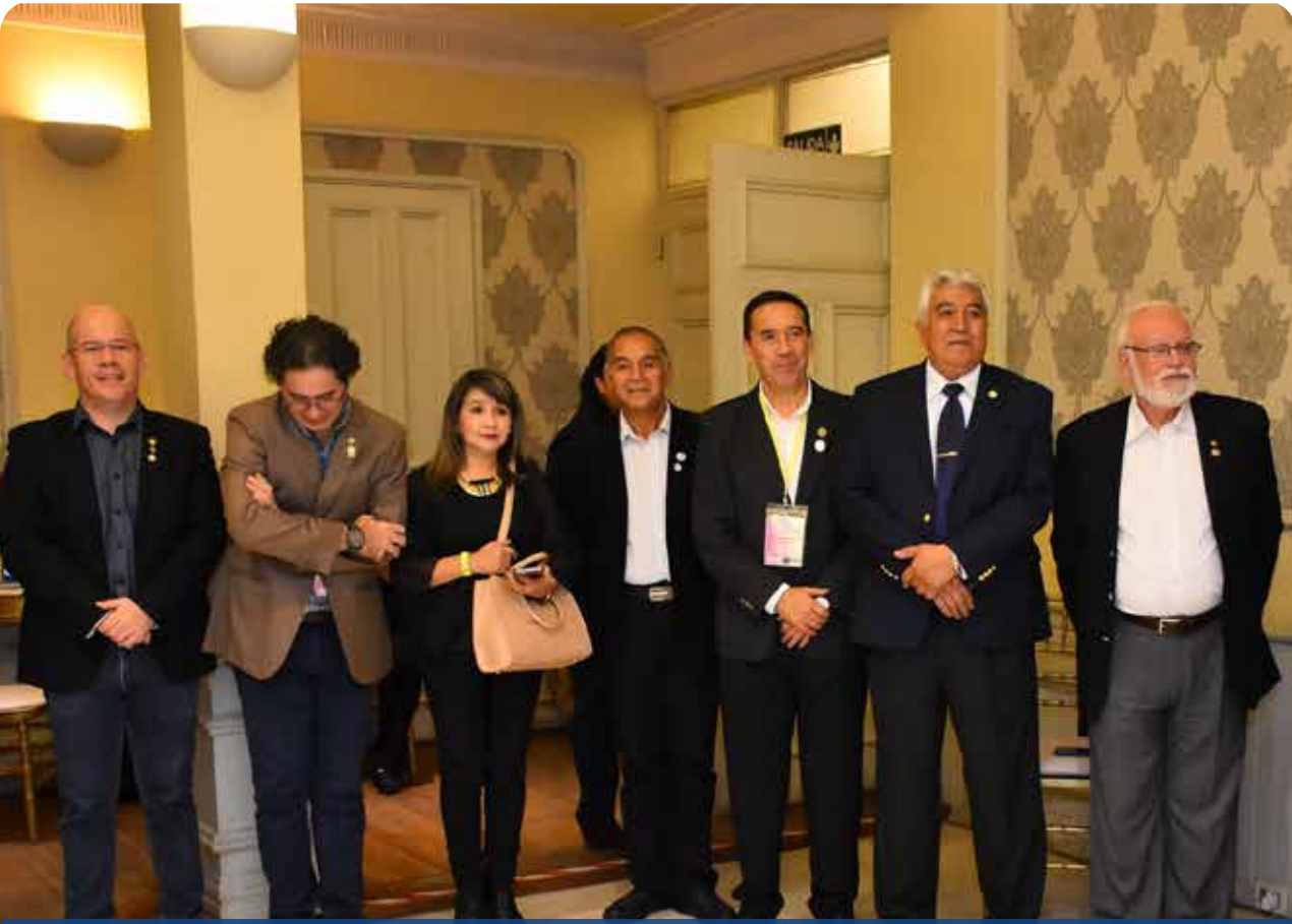
VINO DE HONOR SOCIOS PAUL HARRIS