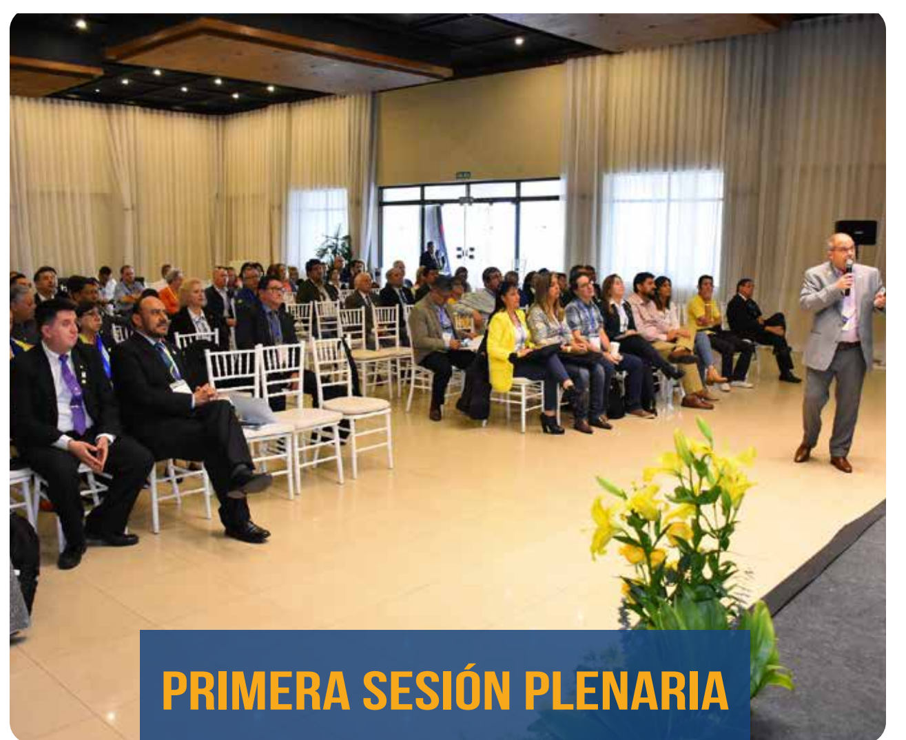
PRIMERA SESIÓN PLENARIA