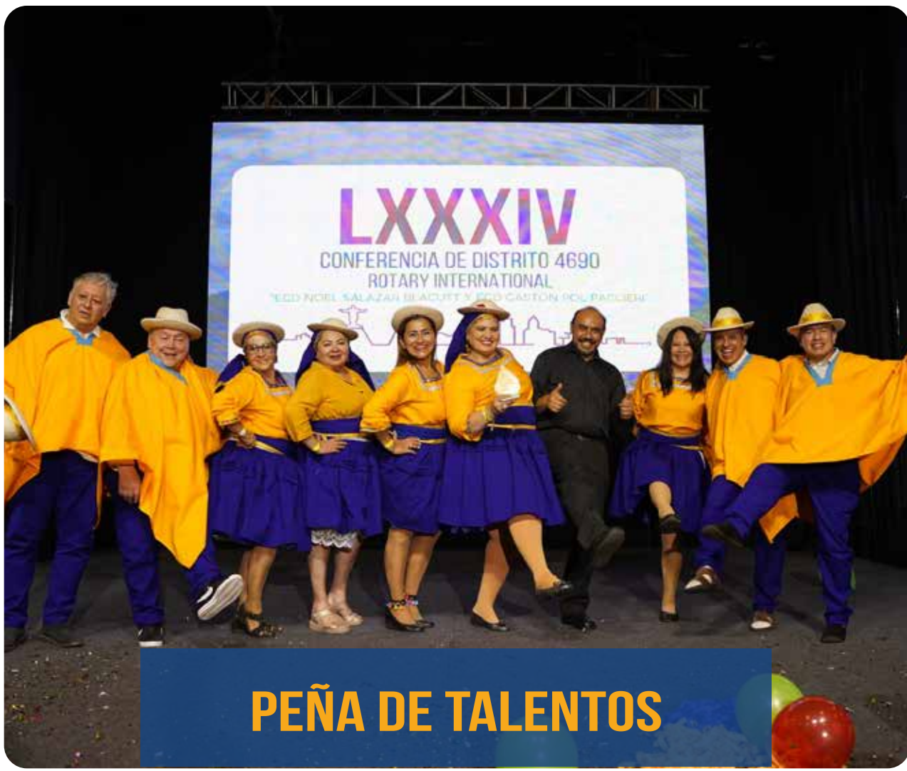
PEÑA DE TALENTOS