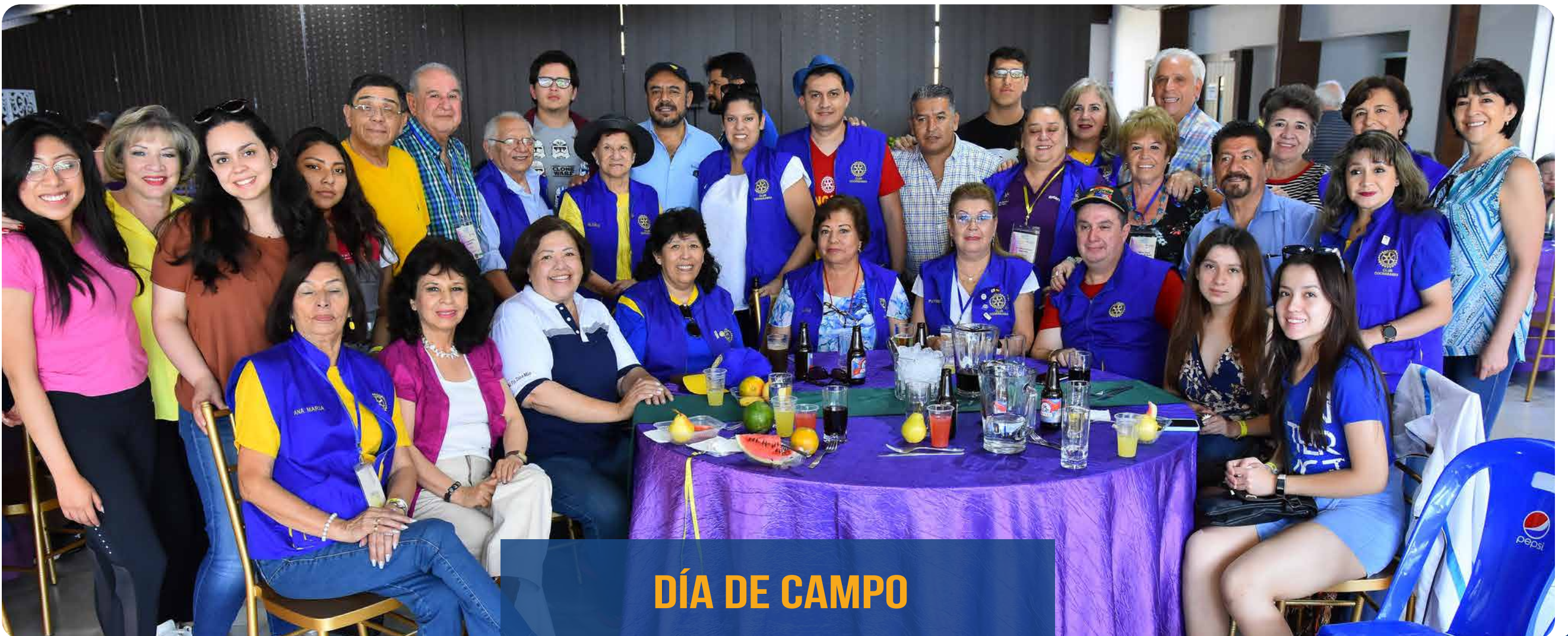
DÍA DE CAMPO