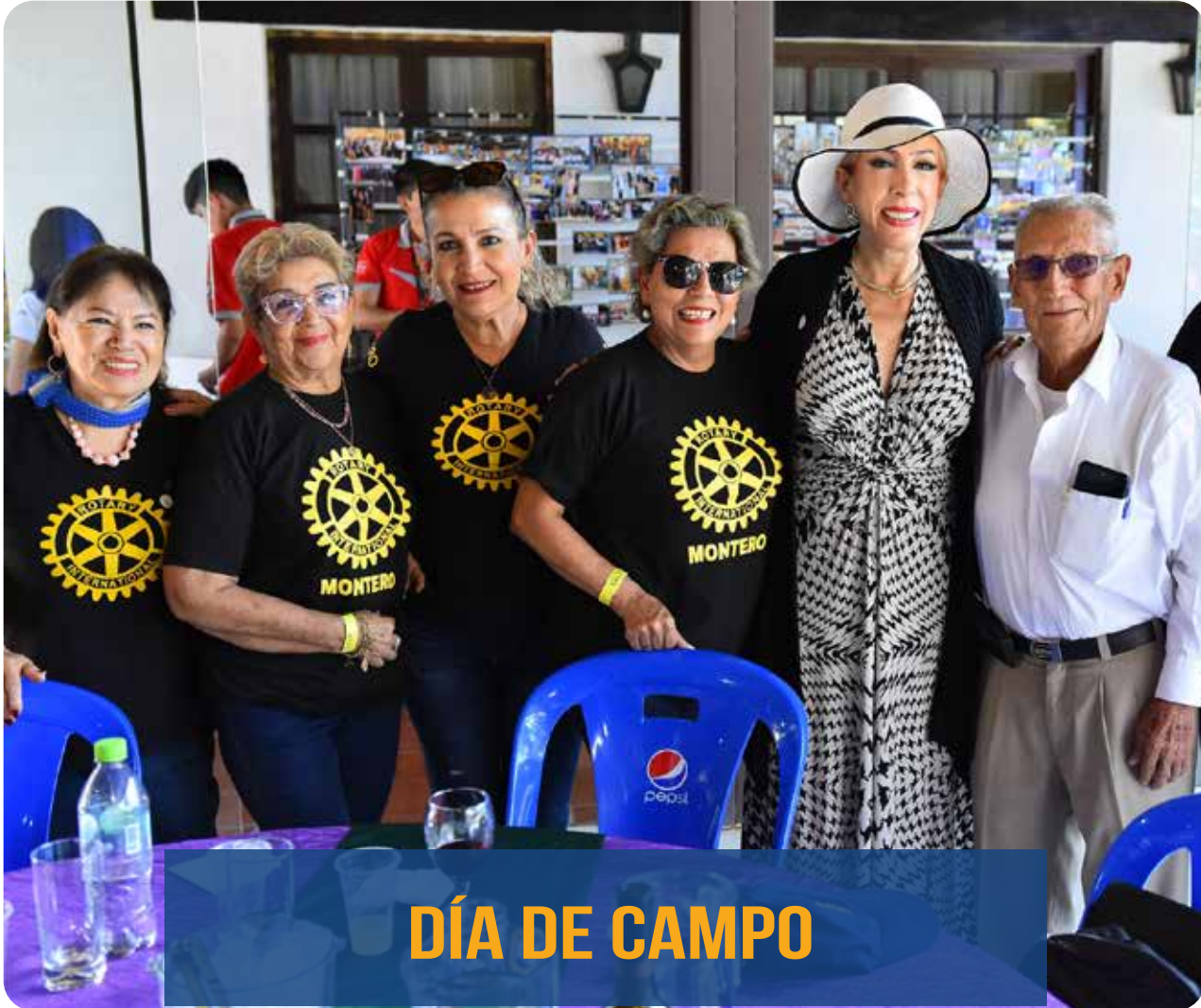
DÍA DE CAMPO