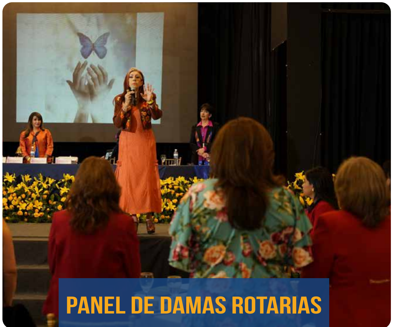
PANEL DE DAMAS ROTARIAS