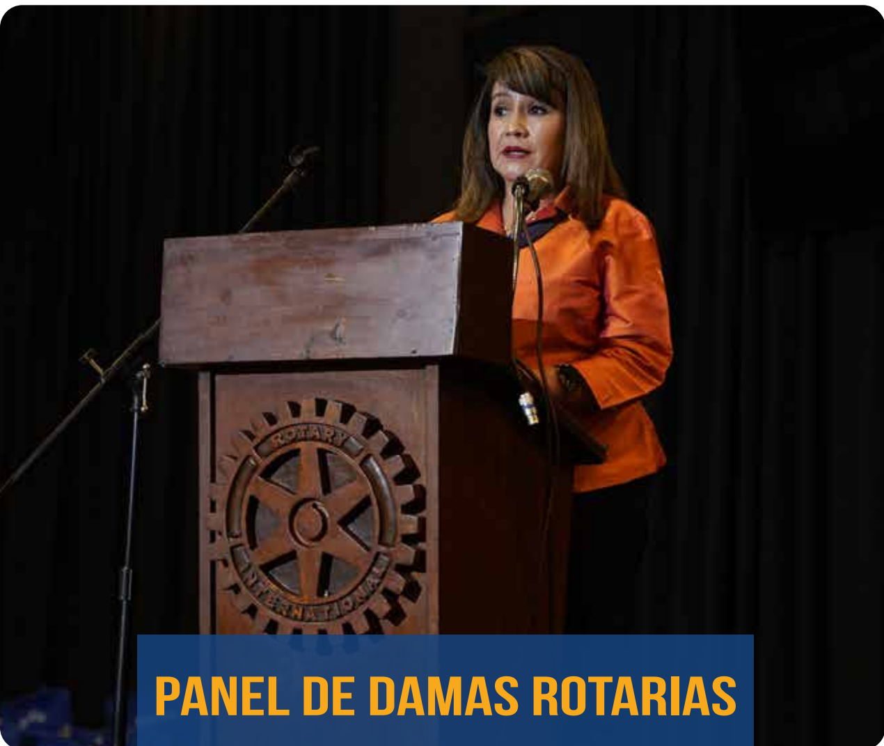
PANEL DE DAMAS ROTARIAS