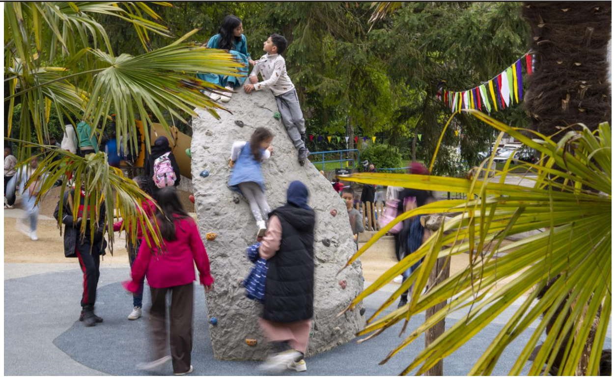
↑ Place à l'escalade à l'Île aux jeux, la nouvelle aire de jeux à Maurepas.

➤ Jeudi 26 juin, de 18h à 19h30. Archives de Rennes 18, avenue Jules-Ferry. archives.rennes.fr