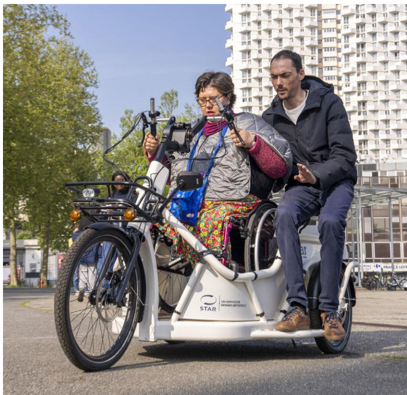
↑ Sur ce vélo électrique, on pédale avec les mains.