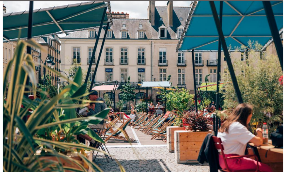
↑ Transat, c'est aussi un lieu de vie convivial, aménagé place de la Mairie.