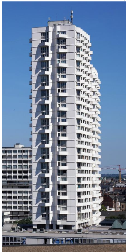
↑ L'Éperon au Colombier: le gratte-ciel le plus haut de Rennes après les Horizons.