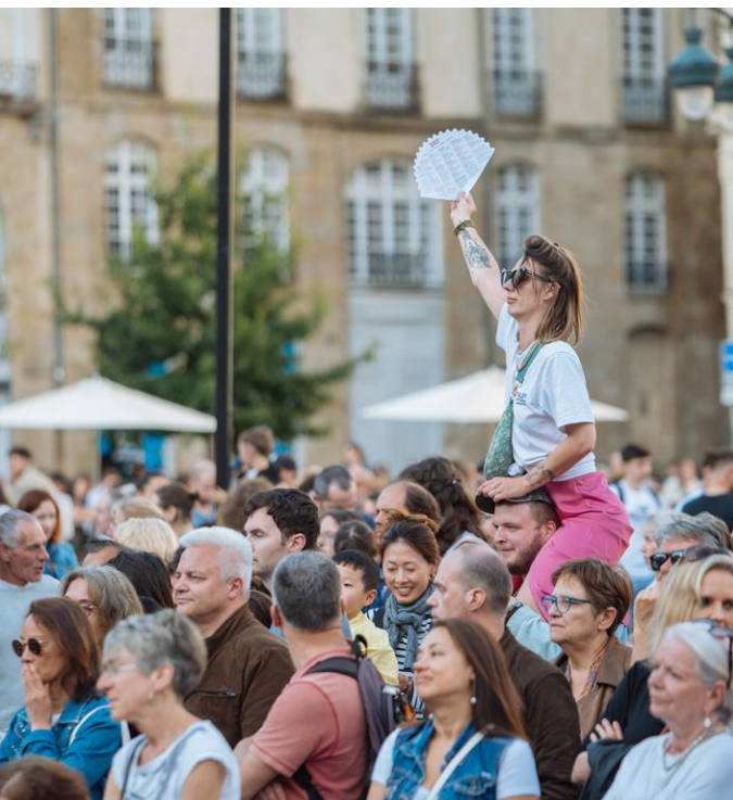
↑ Des fins connaisseurs aux néophytes, les spectateurs répondent présent.

« Je suis étudiant en première année de droit. Ma participation à Transat en ville, en 2024, a été un de mes jobs d'été les plus intéressants, principalement en raison du contact avec le public. J'ai rempli les fonctions d'agent d'accueil polyvalent : mise en place de la scène principale et des transats, information des touristes à la cabane Transat en ville, accueil des spectateurs... Le public est très varié, des familles aux connaisseurs habitués... Pour moi, l'expérience a été assez forte. »