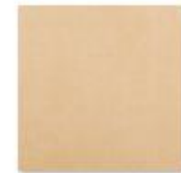
DAPHNE Gold .jpg