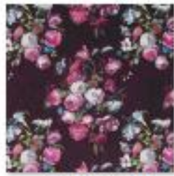
DANBURY Aubergine .jpg