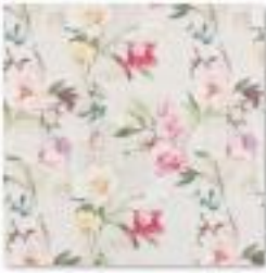
ASTLEY Blossom .jpg