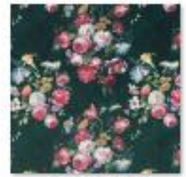
DANBURY Emerald .jpg