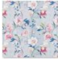
ASTLEY Egg Shell .jpg