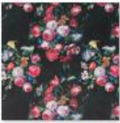
DANBURY Noir .jpg