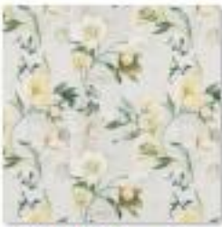
ASTLEY Pear .jpg