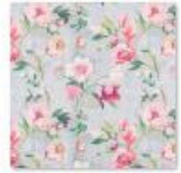
ASTLEY Hibiscus .jpg