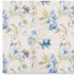
ASTLEY Cornflower .jpg