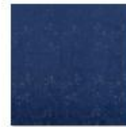
DAPHNE French Navy .jpg