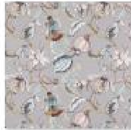
OLEANDER Slate .jpg