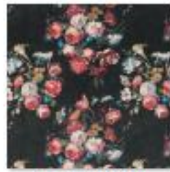
DANBURY Copper .jpg