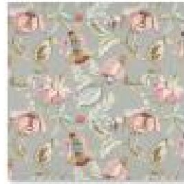
OLEANDER Eau De Nil.jpg