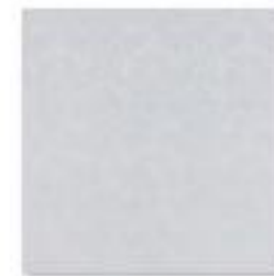
DAPHNE Egg Shell .jpg