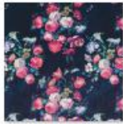
DANBURY Sapphire .jpg