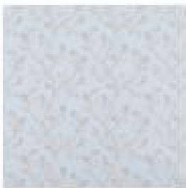
SAMLESBURY Egg Shell.jpg