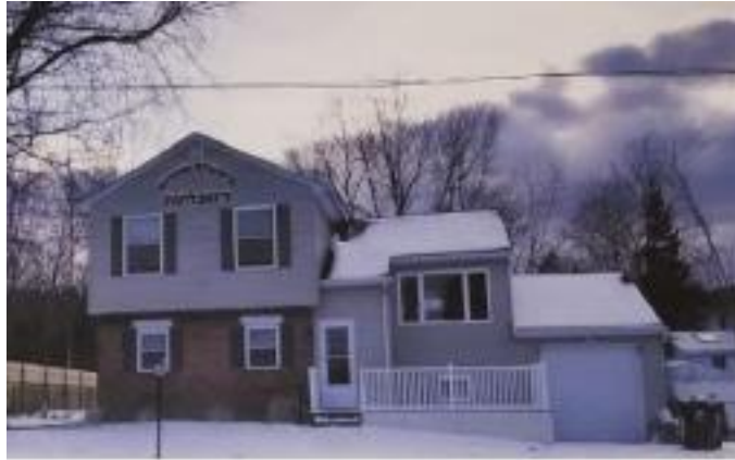
דעם-נייעם בנין אויף די רעד בויירד גאס אין לעיק שאר געגענט

און פילצאליגע מתפללים זענען טאקע אריבערקומען כאפן א בליק פון דער נאנט, זיך אומקוקן און דוסקוסירן די גרויסצוגיגע פלענער. ווי שיין און ערהאבן איז געווען די סצענע צו מיטהאלטן וויאזוי מתפללי בית המדרש ותושבי העיר האבן זיך נישט געקענט גענוג אנזעטיגן פון באטראכטן די הערליכע פלענער וואס איז נתפרסם געווארן אויף די ווענט פון דעם נייעם בית המדרש, און וועלן אט פארוואנדלט ווערן אין א רעאליטעט - גדול ומפואר יהי כבוד הבית הזה לתפארת כל השכונה!