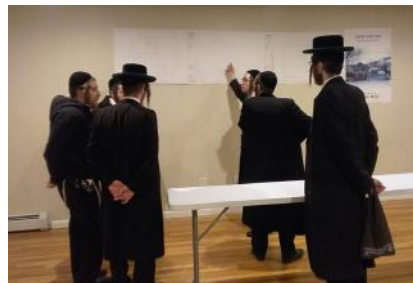
מתפללי ביהמ"ד קוקן זיך אום אויף די פלענער וואס ווערט פארגעשריבן פאר'ן נייעם ביהמ"ד ומקוה דק"ק זאבילטוב

מטעם הנהלת בית המדרש איז ספעציעל באשטימט געווארן דעם פארלאפענעם זונטאג אווענט ווען די קאנטראקטער'ס און דעזיינערס זענען אנוועזענע געווען אויפ'ן ארט, אין דעם גיי - אפגעקויפטן היכל בית המדרש,