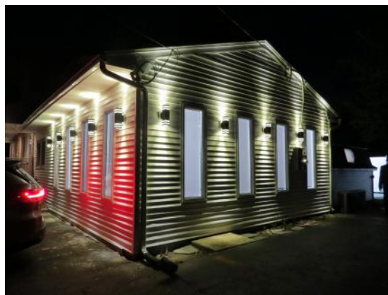
דער יעצטיגער בנין ביהמ"ד זאבליטוב אויף די מערייוואל נארט גאס

דער פריידיגער וואוקס און בליה פון די נאבעלע "לעיק שאור" געגנט איז ווירקליך צום מערסטנס קענטיג אין די בתי מדרשים