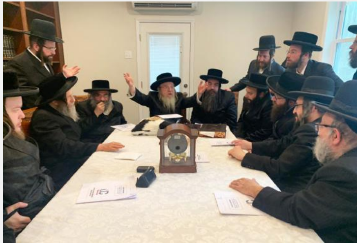
די רבי שליט"א ביי די אסיפת רבני בלומינגראו, וואו עס איז באהאנדעלט געווארן די פעולות פון יו.זשעי.סי. און געהערט געווארן דעת תורה, בנוגע די היסטארישע און קריטישע בעפארשטייענדע עלעקשאנס, וואס אין דעם איז געוואנדן בעז"ה די הצלחה און קיום פון אונזער ישוב בלומינגראו

ובזמן שהצדיק בתוככי עירנו הוא הודה הוא זיוה והדרה, מיט זיין געוואלדיגן כח התורה,