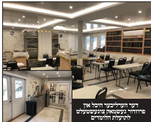
דער הערליכער היכל און פרודור געשמאק צוגעשטעלט לתועלת הלומדים

תושבי בלומינגראוו קוקן זיך צו מיט פרייד אויף די "הרחבת גבולי הקדושה" וואס באגלייט אט דעם נאבעלן מקום קדוש, מה טובו אוהליך יעקב משכנותיך ישראל!