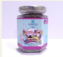
100% Kona coffee. $11.99