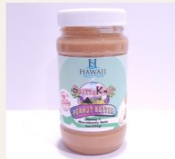
Peanut butter with macadamia nuts $9.99