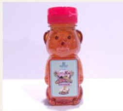
Honey with macadamia nuts. $8.99