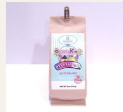
Buttermilk Pancake mix. $8.99

Boots & Kimo's Classic T-shirt & Tank top S - XL = $15.00 2XL - 5XL = 17.00